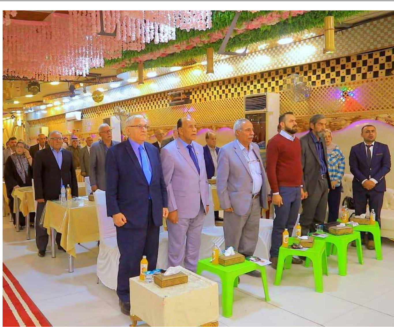
جانب من مؤتمر تحالف قيم المدني في محافظة ذي قار

وبلغت المستشار إلى أن هذا يتم "بالاستناد إلى المهام التي نص عليها نظام صندوق العراق للتنمية الذي يتشكل من 6 صناديق فرعية، أحدها سيخصص تماماً