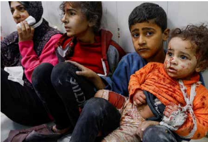
الأأم المتحدة تحذر من أن نصف سكان غزة يعانون من المجاعة

ومنذ 7 تشرين الأول، يشن الجيش الإسرائيلي حرباً مدمرة على غزة خلقت 17 ألفاً و997 شهيداً، و49 ألفاً و229 جريحاً، معظمهم أطفال ونساء، ودماراً هائلاً في البنية التحتية و"كارثة إنسانية غير مسبوقة"، بحسب مصادر رسمية فلسطينية وأمنية.