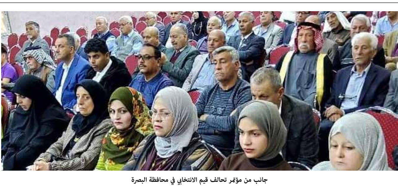
جانب من مؤتمر تحالف قيم الانتخابي في محافظة البصرة

وشدد المتحدث على ان «البناء الاقتصادي السليم يستلزم تقليل الاعتماد على الريع النفط في الموازنات».