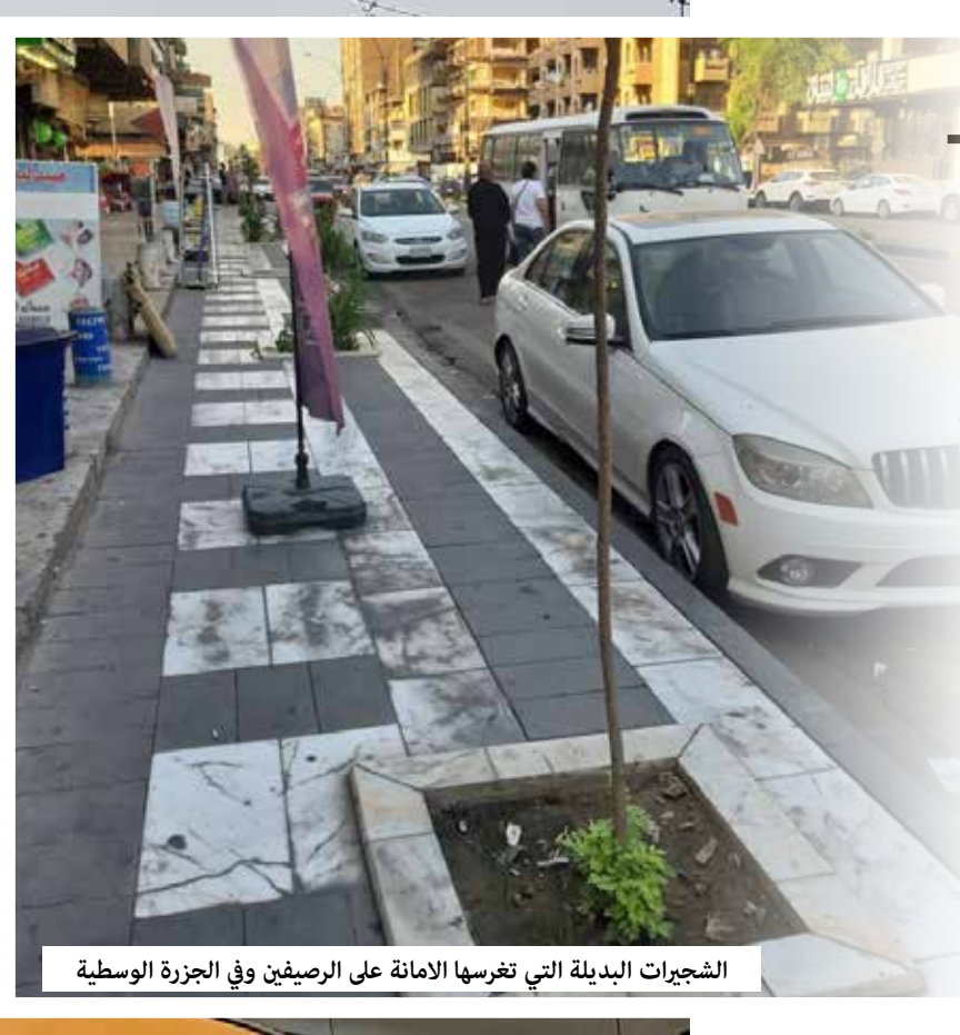
الشجيرات البديلة التي تغرسها الامانة على الرصيفين وفي الجزرة الوسطية

لم يبقَ من حوالي 300 شجرة معمره في شارع الكرادة - داخل بغداد، لحظة اعداد هذا التقرير في أواخر تشرين الأول 2023، سوى 166 شجرة. والظاهر ان وزارة الاعمار والإسكان وأمانة بغداد تعملان بشركتهما الاستثمارية وبجهود متواصلة، لقطع البقية الباقية من هذه الأشجار الممتدة على جانبي الشارع حتى الجسر المعلق، والتي يقارب عمر بعضها 60 عاما.