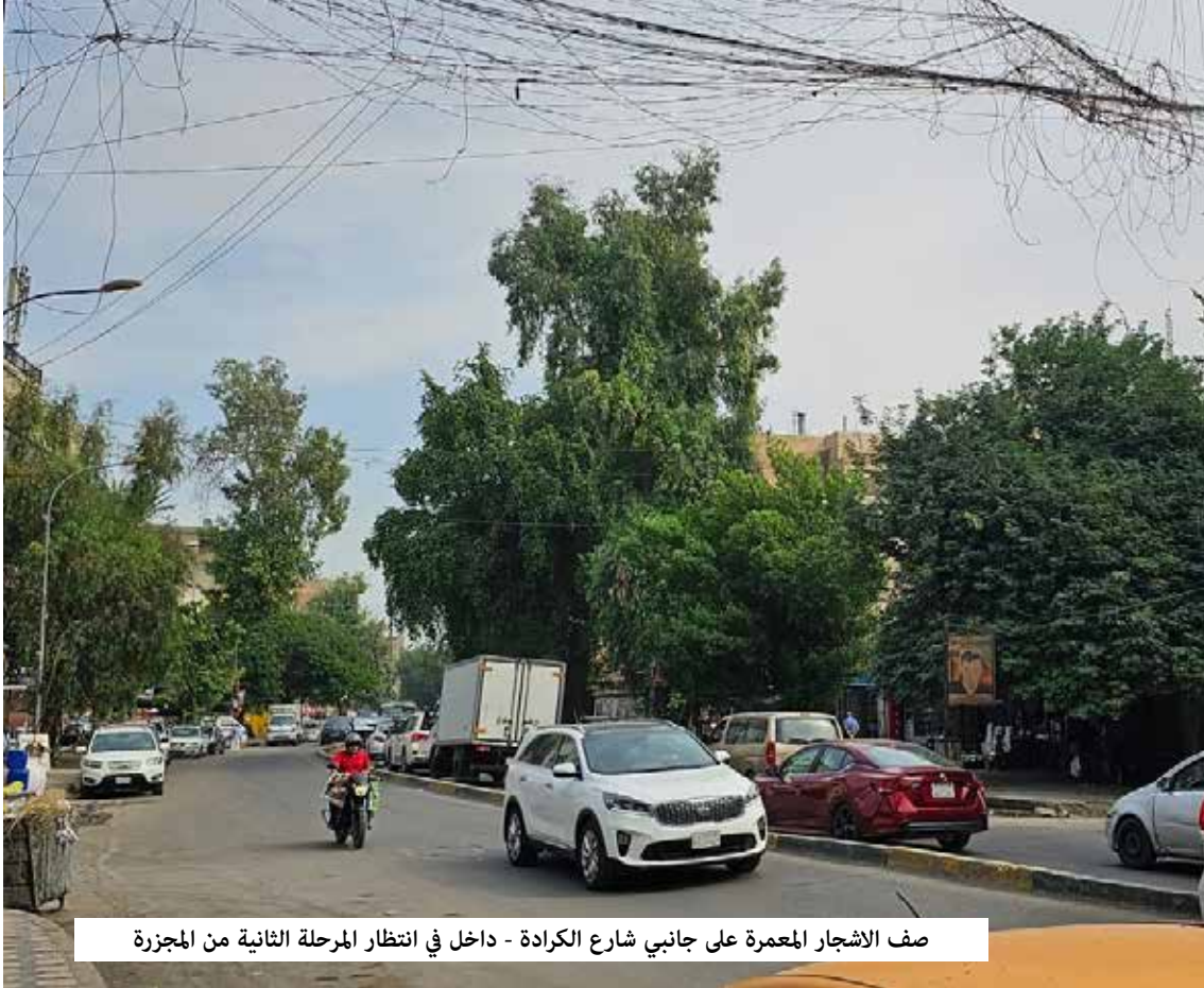
صف الاشجار المعمره على جانبي شارع الكرادة - داخل في انتظار المرحلة الثانية من المجزرة