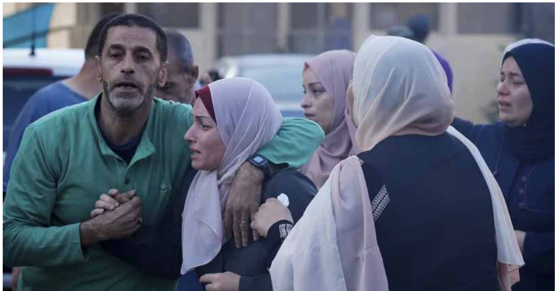
أحزان الغزاويين على شهدائهم أمام مشرحة دير البلح امس الاثنين