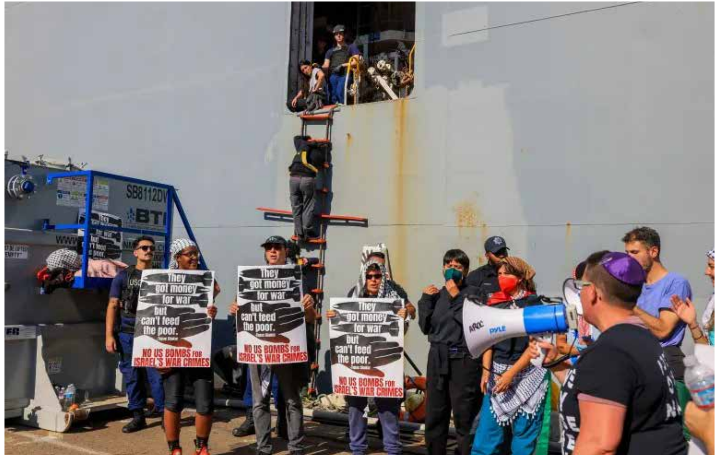
متظاهرون في ميناء أوكلاند بولاية كاليفورنيا الأمريكية حاولوا عرقلة إبحار سفينة قالوا إنها تحمل شحنة مساعدات عسكرية أمريكية إلى إسرائيل

إن وجود الوثيقة لا يعني بالضرورة أن الحكومة الإسرائيلية ستنتج بتنفيذها، لكن حقيقة أن وزارة إسرائيلية توصلت إلى مثل هذا الاقتراح التفصيلي في خضم هجوم عسكري واسع النطاق على قطاع غزة،