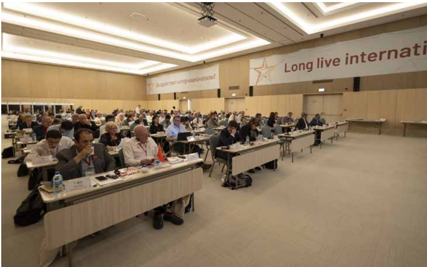
ممثلو الأحزاب في قاعة الاجتماع