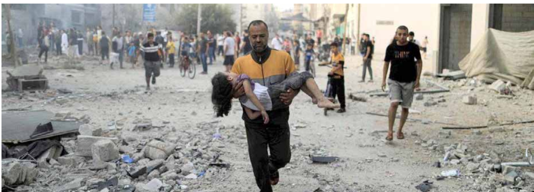
الغارات الصهيونية الوحشية على قطاع غزة لا تنقطع والاطفال اولي ضحاياها

تشكلت حكومة السيد محمد شياع السوداني بعد عام من إجراء انتخابات تشرين 2021 البرلمانية، وجاءت حالة الاستعصاء السياسي الناجمة عن تشبث المنتفضين بنهج المحاصصة المقيت، وتقاسمهم المواقع باعتبارهم ممثلين لـ "المكونات" حسب ادعائهم. ولم يتم حسم الصراع بشأن تشكيل الحكومة الا بعد امتناع التيار الصدري عن المشاركة فيها غداة انسحابه من البرلمان. تشكلت الحكومة من برلمان يفتقد للشرعية السياسية والشعبية والذي جاء أساسا في انتخابات لم تزد نسبة المشاركة فيها عن 20 في المائة، وبعد صراع مرير صاحبه إراقة دماء. وجاءت الحكومة وفقا لآليات التحاصص المعهودة، وكان للارادات الخارجية والارتهاق لها دورها الواضح في مسار التشكيل. كما انها حظيت بدعم الاطراف التنسيقي، الذي توافق مع قوى سياسية أخرى لتشكيل تحالف قوى الدولة، بمعنى ان الاطراف التنسيقي هو من يتحمل المسؤولية الأولى عن نجاح أو فشل الحكومة، وان لم يعف هذا الأطراف الأخرى في تحالف قوى الدولة من المسؤولية، بحكم دعمها ومشاركتها فيها. وتشكلت الحكومة وأمامها أعباء وتحديات جسيمة، وفي مقدمتها حالة الاستياء الشعبي الواسع وعدم الثقة وحتى النفور من أقطاب السلطة والأحزاب والقوى والشخصيات الماسكة بزمامها، والتي كان انفجار الاحتجاج الشعبي في تشرين 2019 تعبيرا صارخا عنها، وعن الغضب المتراكم عند قطاعات شعبية واسعة. وأكدت مسيرة الحكومة في سنتها الأولى التناقض الصارخ بين البرنامج الحكومي وأولوياته والذي