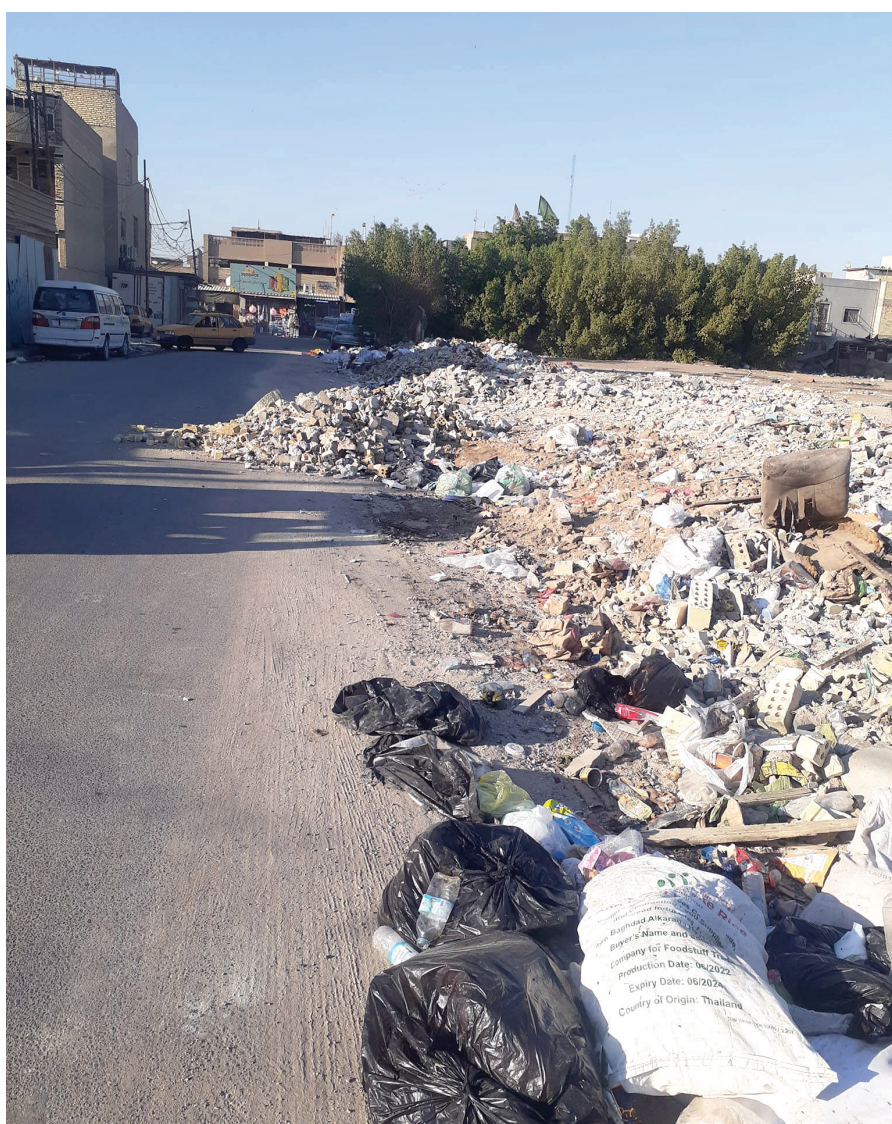
الزقاق ٥٧ - المحلة ٧١٧ في بغداد الجديدة .. سكانه يشكون من تحول زقاقهم إلى مكب للنفايات وأنقاض البناء