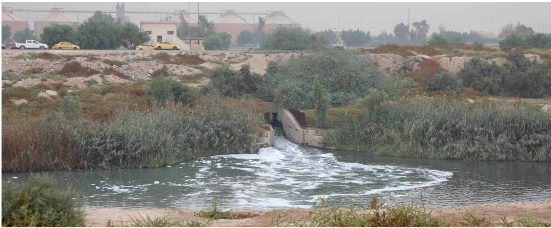
مياه الصرف الصحي والمياه الملوثة للمؤسسات الصحية وغيرها تطلق دون معالجة الى الانهار

وقال هورامي إن "المصابين بالإسهال والقيء حالياً يعالجون كحالات كوليرا"، مؤكداً أن مستشفيات المنطقة تستقبل يومياً عشرات المصابين بهذه الأعراض.