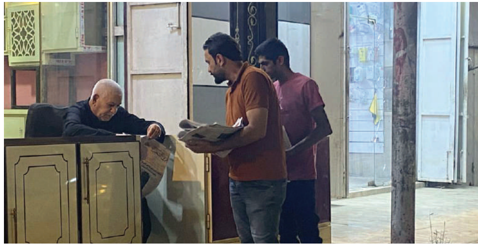
ميسان. طريق الشعب