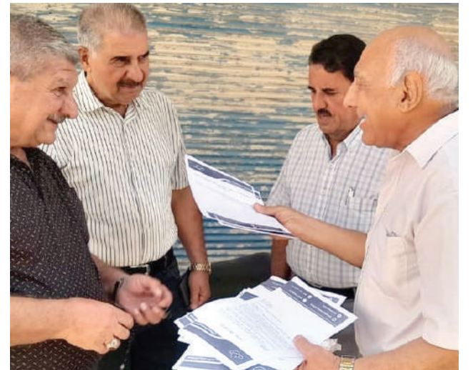
ديالى. طريق الشعب

نظم الشيوعيون جولة ميدانية في بعقوبة، لتوزيع نسخ من مذكرة اللجنة المركزية للحزب الشيوعي العراقي، التي وجهت الى الرئاسات الثلاث بخصوص القضية الفلسطينية وضرورة التحرك العاجل لوقف العدوان الاسرائيلي الغاشم على قطاع غزة. وجرى توزيع نسخ من جريدة «طريق الشعب» والحديث مع المواطنين حول برنامج «تحالف قيم المدني» ومشروعه لتغيير واقع الفشل والأزمات الناتجة عن نظام المحاصصة.