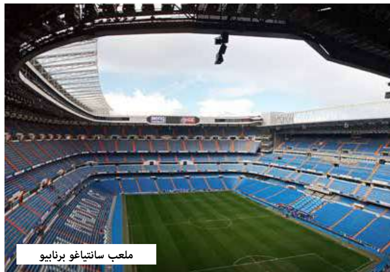
ملعب سانتياغو برنابيو

ومن المقرر أن يكتمل بحلول عام 2028 مما يعني أنه لن يستضيف نهائيات كأس أفريقيا 2025 التي ستقام في المغرب. ويعتبر الهدف الرئيسي من بناء الملعب هو منافسه سانتياغو برنابيو بشكله الجديد لاستضافة نهائي كأس العالم، رغم اعتبار كل من البرتغال وإسبانيا أن إقامة المباراة في إسبانيا أمر غير قابل للتفاوض، إلا أن المغرب ترفض الاستسلام وتقاتل من أجل هذا الحلم. يذكر أن الاتحاد الدولي لكرة القدم "فيفا" وضع شرطاً وجيداً لملاعب المباريات النهائية، وهو أن يتسع الملعب لأكثر من 80 ألف متفرج وهو ما ينطبق على سانتياغو برنابيو وكامب نو وملعب الدار البيضاء الجديد. وتتضمن خطة المغرب كذلك إعادة تصميم خمسة ملاعب أخرى تم اختيارها بالفعل كمرشحين لتنظيم كأس العالم ووقع الاختيار على كل من: طنجة، الرباط، أغادير، مراكش وفاس.