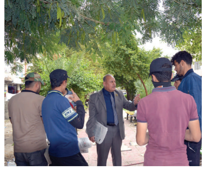
كركوك. طريق الشعب