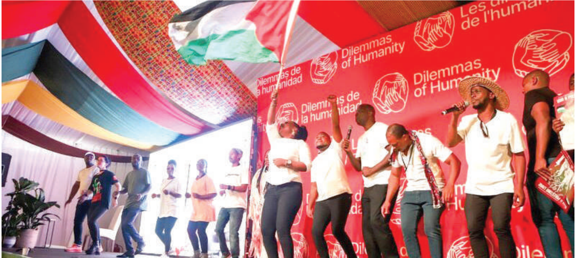
أعلن المؤتمر تضامنه مع الشعب الفلسطيني