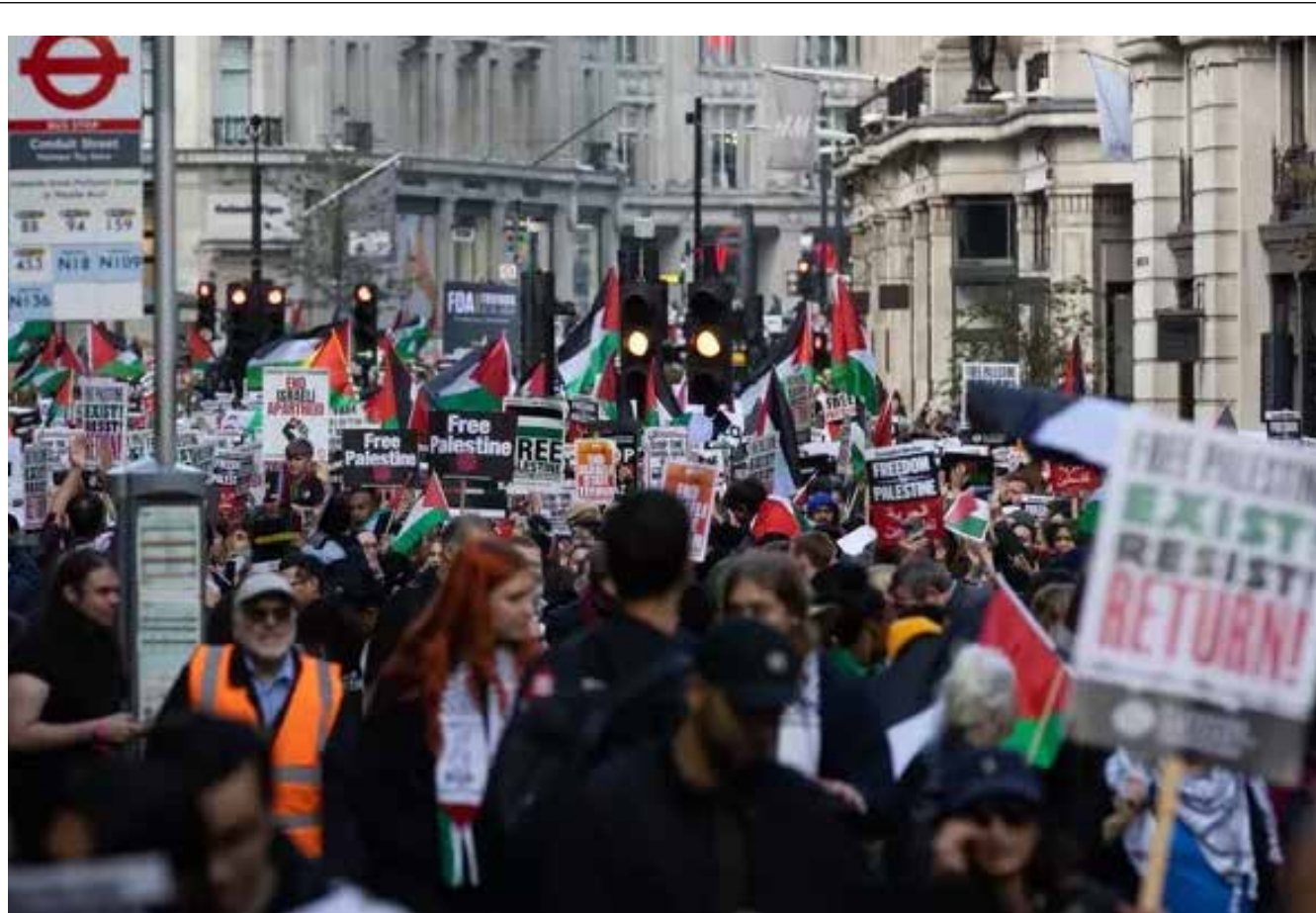
تظاهر الآلاف في لندن امس السبت رغم الجو الماطر للمطالبة بوقف فوري لحرب الاحتلال الإسرائيلي على قطاع غزة

من جانبه، قال الرئيس المصري، عبد الفتاح السيسي،