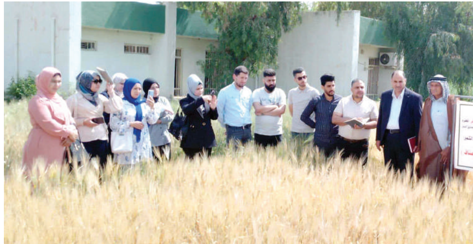
نينوى. طريق الشعب

حول «تحالف قيم المدني» وبرنامج الذي سيخوض انتخابات مجالس المحافظات المقبلة، سعياً لتحقيق التغيير المنشود. وحث الرفاق المواطنين على المشاركة الواسعة في الانتخابات والمساهمة في تغيير منظومة المحاصصة والفساد ومحكمة قتلة المتظاهرين، والمطالبة بحقوقهم من أجل عيش كريم آمن وخدمات أفضل. اقام رفاق اللجنة المحلية للحزب الشيوعي في نينوى، جولات اعلامية راجلة قرب البيوت السكنية والاماكن العامة في الموصل - القوش - بعشيقه - الرشيدية والنمرود. وجرى توزيع مطبوعات تتضمن مواقف الحزب بشأن عدد من القضايا الهامة، فيما تحدث الرفاق مع الأهالي