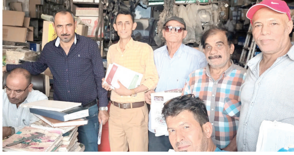
الكويت. طريق الشعب