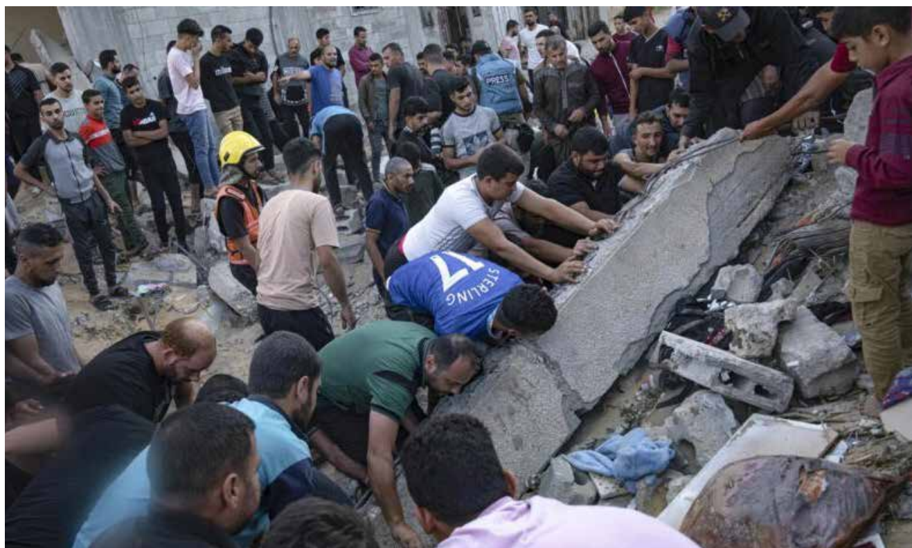
البحث عن ناجين تحت الأنقاض في خان يونس بقطاع غزة بعد القصف الإسرائيلي الوحشي