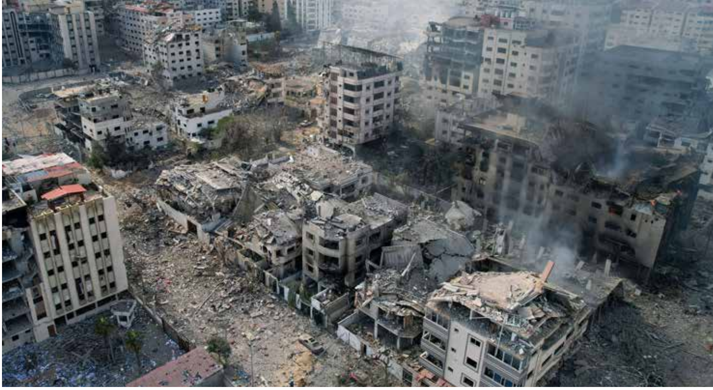
هكذا ”دافعت“ إسرائيل عن نفسها في غزة!

انتقد رئيس الوزراء الأيرلندي ليو فارادكار إسرائيل بسبب قطعها إمدادات المياه والكهرباء عن قطاع غزة، ووصف ذلك بأنه انتهاك للقانون الإنساني الدولي. وقال