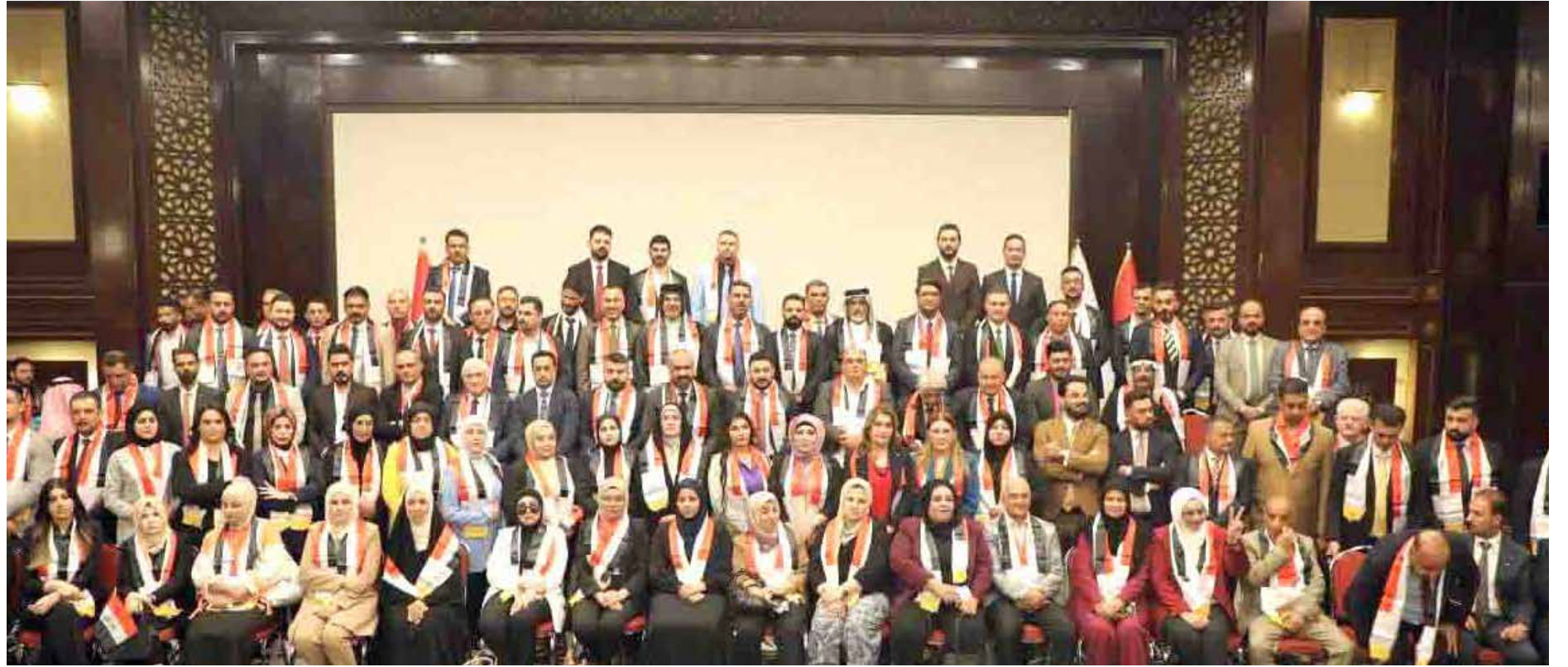
من مؤتمر الاعلان عن تحالف قيم المدني

ثقة الناس، وهي قادرة على ذلك، كونها الأقرب لهم، وأكثرها معرفة بمعاناتهم.