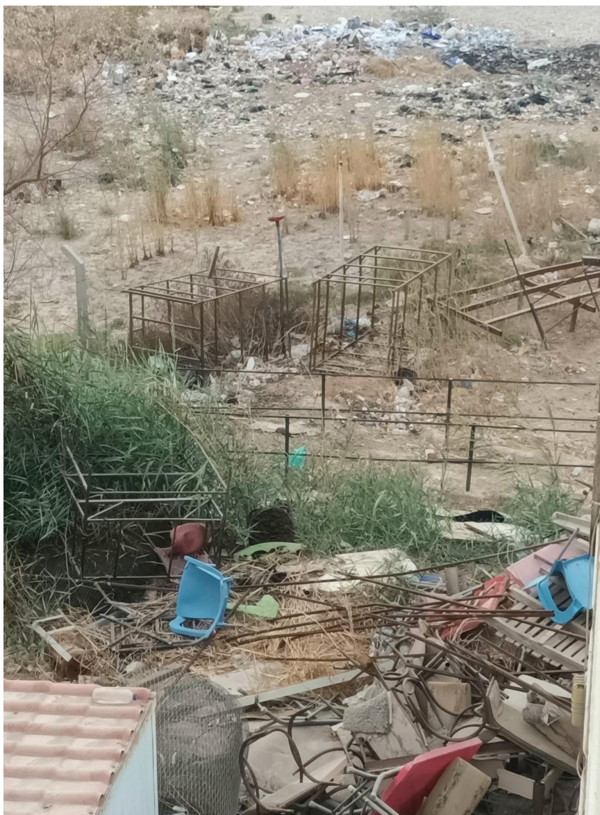
هذا ليس مكب أنقاض.. انها ضفاف نهر دجلة في كورنيش مدينة الكوت! هل يستحق هذا النهر الجميل أن يتحول إلى بؤرة للنفايات والقاذورات والأنقاض؟! الكوت - نجم خطاوي