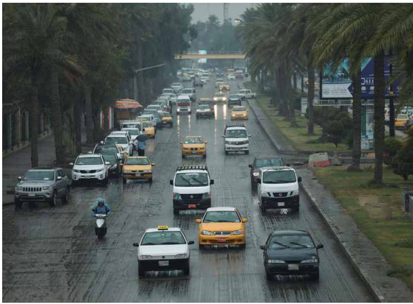
بعد موسم صيف قاس.. أمطار خفيفة تعد بشتاء ممطر ينتظره الناس في عموم العراق