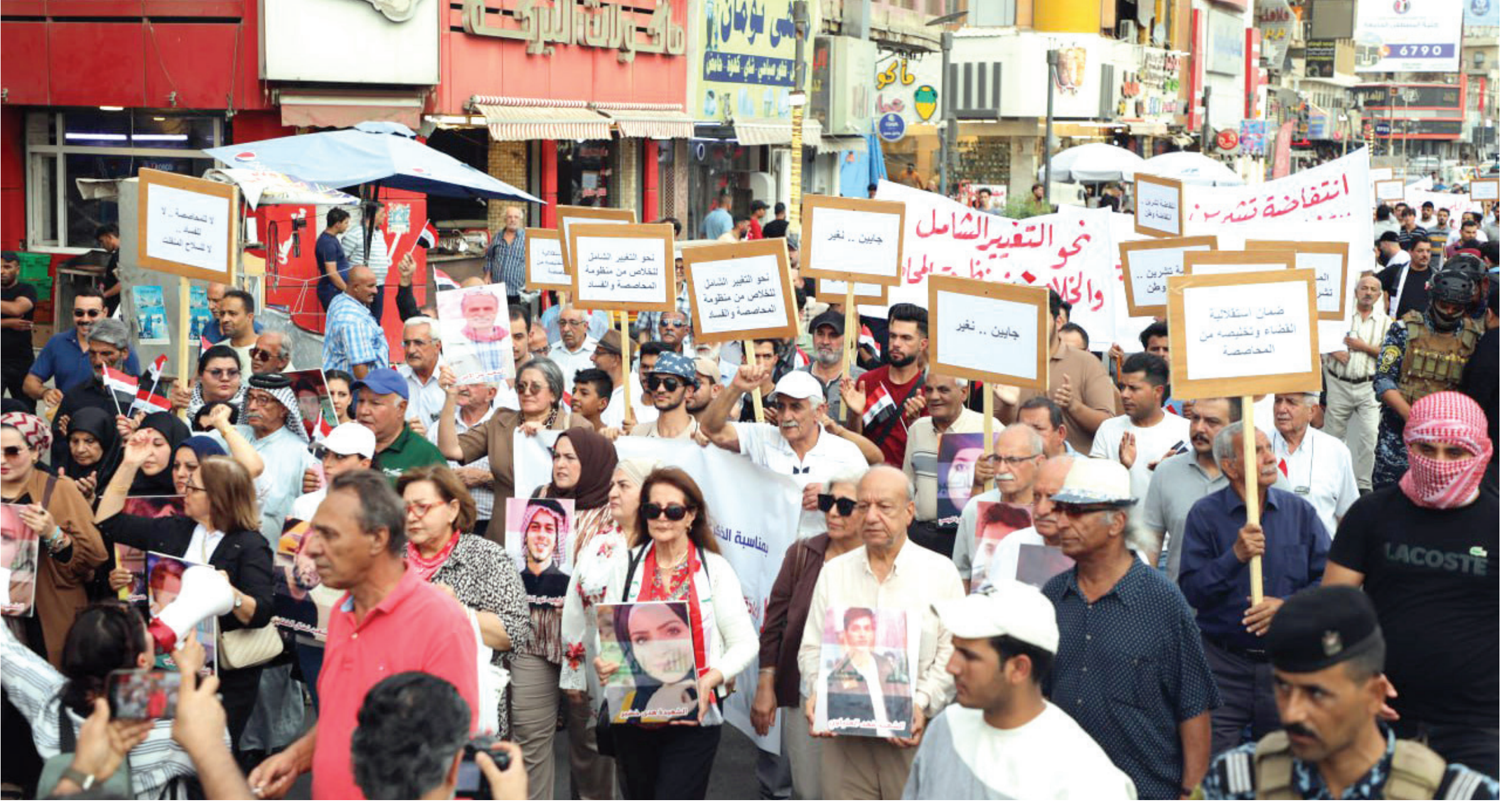
مسيرة احياء الذكرى الرابعة للانتفاضة تشرين الباسلة

كيف تراقبون تطورات الأحداث الأخيرة في كركوك، وما هو الحل الأمثل لأزمة هذه المدينة، وهل ترى أن الحلول الترتيبية غير مجدية وتعيد الأزمة كل فترة كما حصل مؤخرًا؟