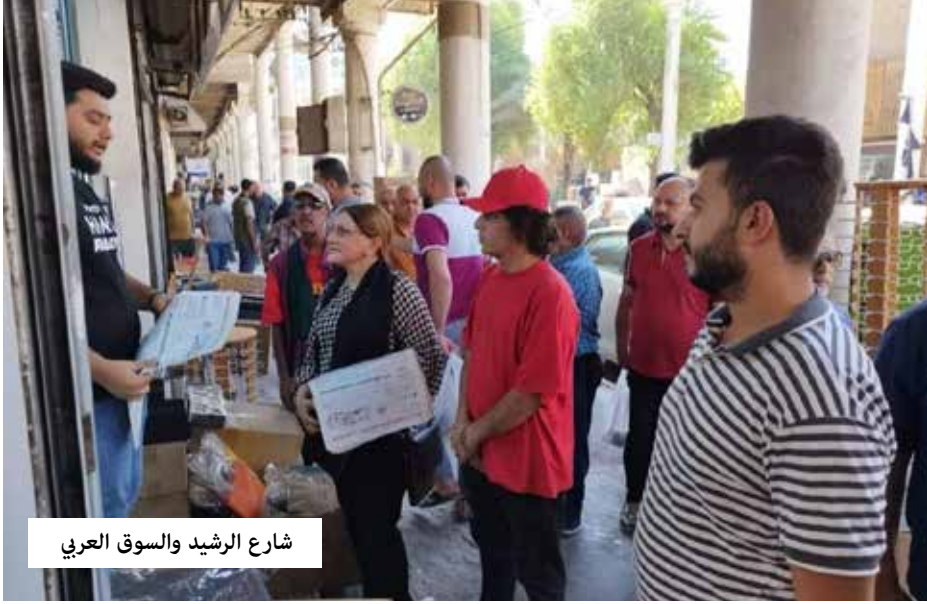
شارع الرشيد والسوق العربي

من جانبهم، نظم فريق من اللجنة المحلية للحزب الشيوعي العراقي في الرصافة الثالثة جولة إعلامية داخل منطقة الأعظمية لتوزيع جريدة «طريق الشعب» على