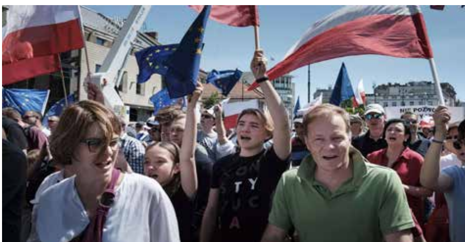
نصف مليون مواطن يشاركون في مسيرة من اجل الديمقراطية وارسو 4 حزيران 2023

تشير استطلاعات الرأي حتى الآن، الى تقارب بين المعسكر الحكومي، ومعسكر المعارضة، مما يزيد مخاوف الحزب