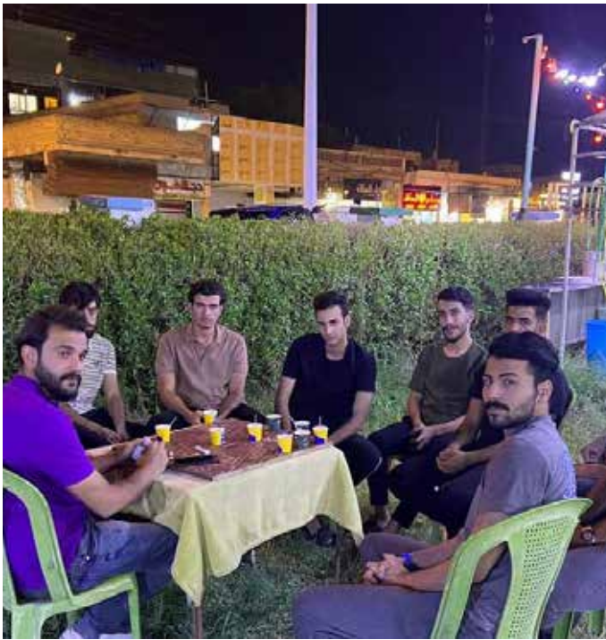
ميسان. طريق الشعب