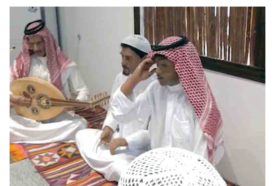
مشهد لفرقة «الخشابة» من مجسمات المتحف