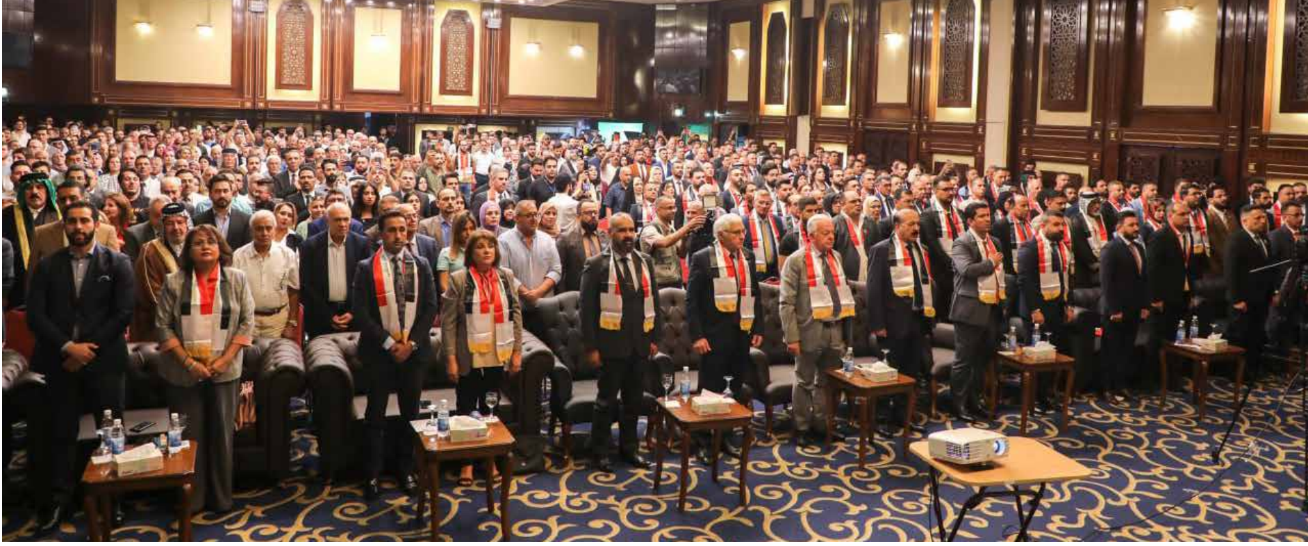
حفلة اعلان تحالف قيم المدني

واكد البصري انه "وسط كل هذا بقيت هناك عينة من فئة الشباب ما زالت حتى الان تصارع وتناهض السلطة، وهي بصدد تأسيس جبهات مدنية حقيقية تسعى لإنجاح عملها، بعيداً عن الأذرع الحزبية للسلطة رغم الضغوط والمحاولات التي تتعرض لها هذه الفئة التي حافظت على هويتها ومبادئها ولم تهادن".