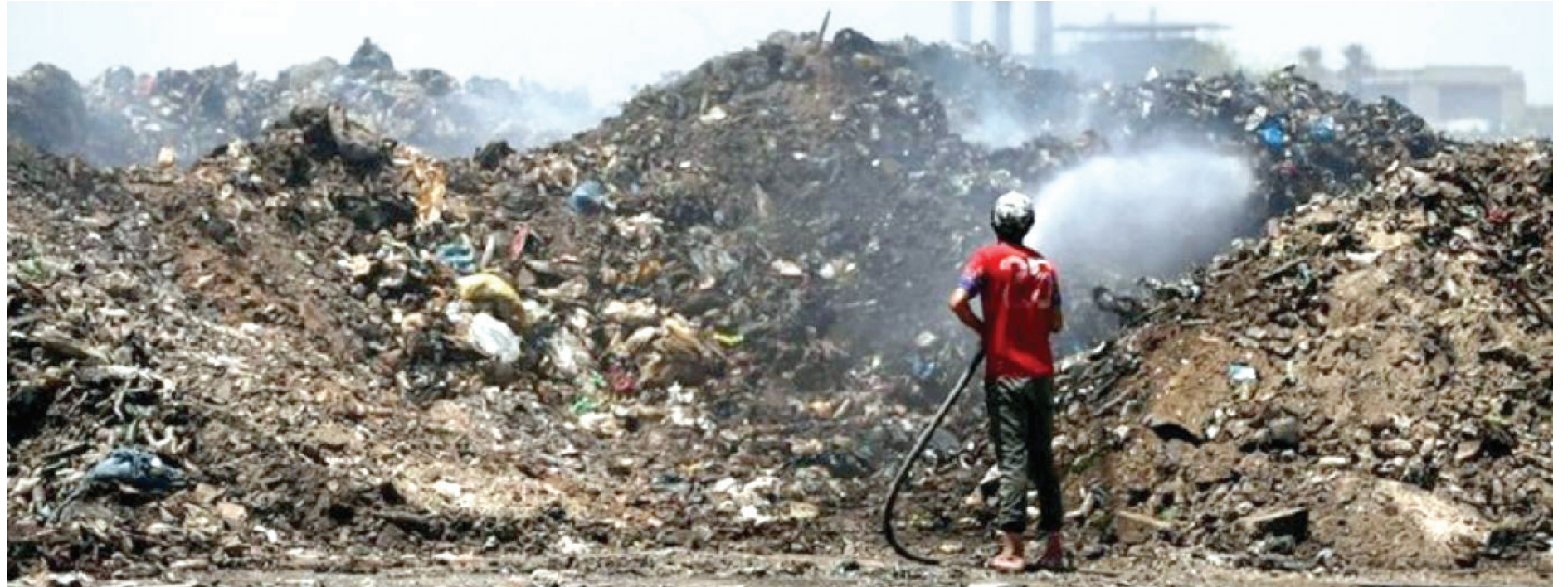
بغداد. طريق الشعب