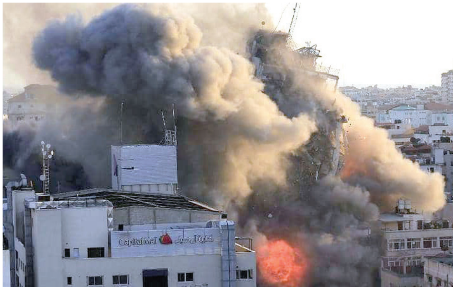
متابعة - طريق الشعب

التصعيد في الأراضي الفلسطينية. ففي تصريحات أدلى بها بعيد وصوله إلى مطار بن غوريون في تل أبيب، دعا بليكن كل الأطراف إلى وقف العنف وأعمال التصعيد التي تؤدي بحياة الإسرائيليين والفلسطينيين، وقال إن تهديده الأجواء ونشر السلام لحماية أرواح الإسرائيليين والفلسطينيين هما مسؤولية الجميع، وفق قوله.