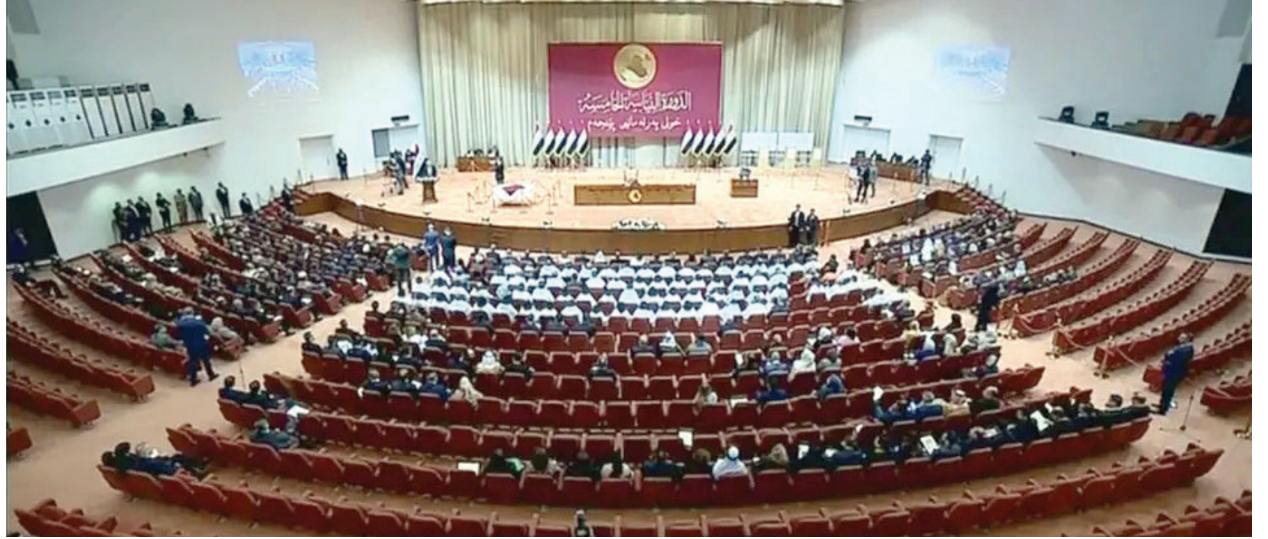
بغداد. طريق الشعب

الموازنة: الأول تخفيض مجمل مبالغها، والثاني المناقشة بين الأبواب. أما إذا أراد الزيادة فيكون ذلك عند الضرورة وبعد العودة إلى مجلس الوزراء.