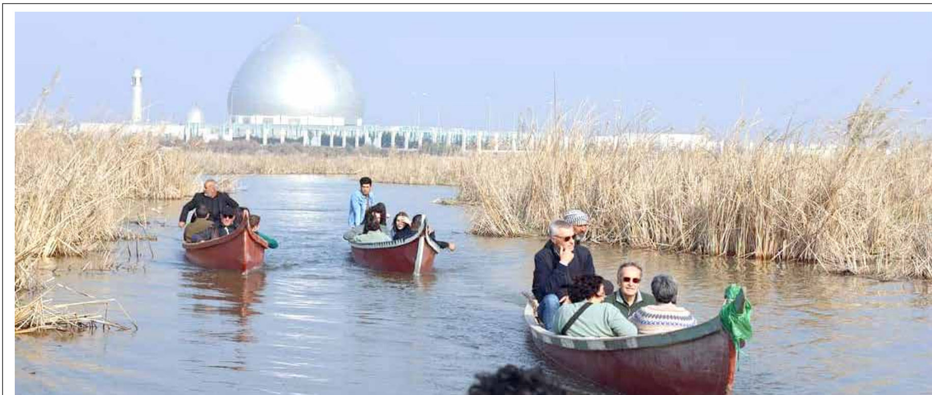
سياح أجانب يزورون احوار الناصرية بعد ان انعشتها الامطار

بدوره، أكد النائب عن الإطار التنسيقي، عقيل الفتلاوي، أن بعض اللجان النيابية تم اختيار رئاساتها من خلال آلية "التوافق".