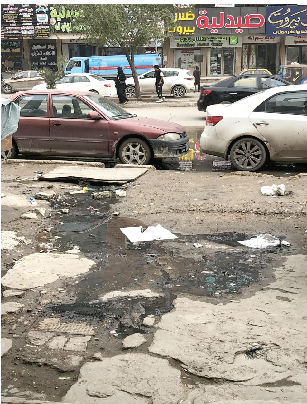
هذا الرصيف يقع في "ساحة بيروت" وسط بغداد. وما أكثر أمثاله في أرجاء العاصمة!