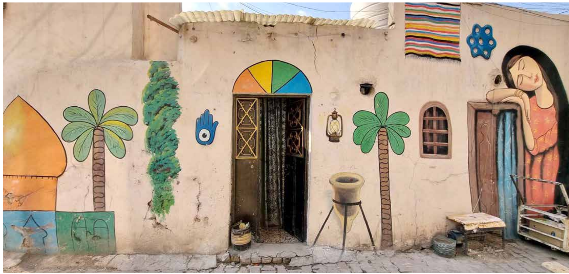
شبان يزینون جدران محلة الانبارية في مدينة الكاظمية برسومات تراثية

وعن إمكانية إيفاء السوداني بوعدده بخصوص إجراء التعداد، قال المحلل السياسي، أن هناك "الكثير من القضايا التي ضمنها السيد السوداني في برنامجه الحكومي، ولعل أبرزها إجراء انتخابات خلال فترة سنة، وهذا الحديث يتقاطع بشكل واضح مع إجراء التعداد