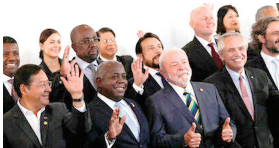
بعض من الشخصيات المشاركة في المؤتمر

وشددت الدول الأعضاء في البيان الختامي على «الاعتراف بأمريكا اللاتينية ومنطقة البحر الكاريبي كمنطقة سلام خالية من الأسلحة النووية»، والالتزام «بالتسوية السلمية للنزاعات ونظام دولي قائم على الاحترام، وعلاقات صداقة وتعاون خالية من التهديدات