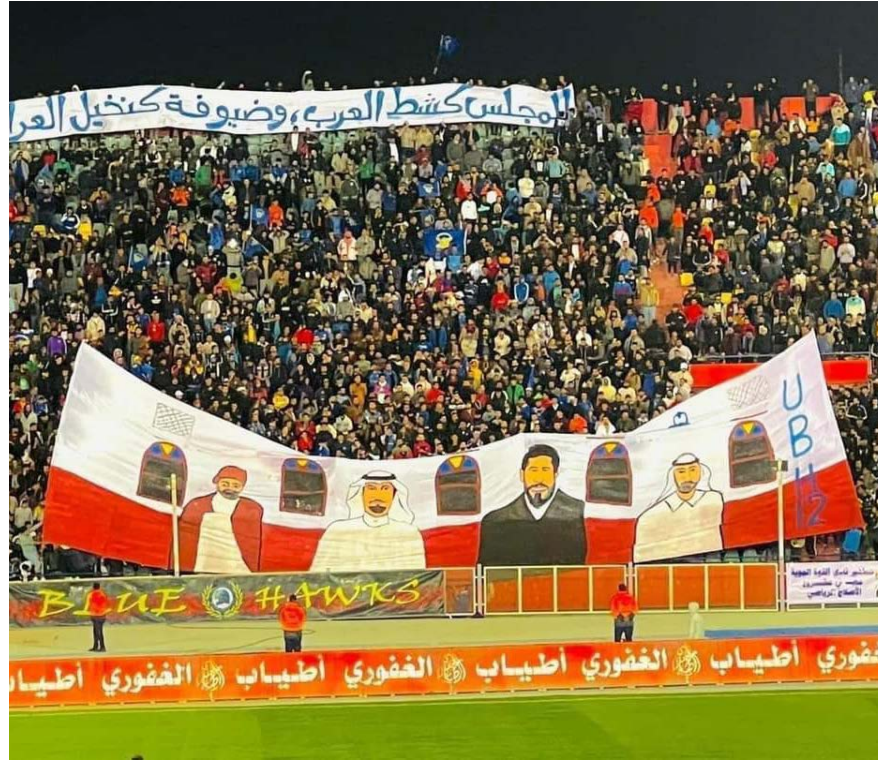
جانبا من مباراة القوة الجوية والطلبة

وبهذه النتيجة رفع القوة الجوية رصيده للنقطة 28 متمسكاً بالصدارة، بينما تجمد رصيد فريق نادي الطلبة عند النقطة 24 بالمركز الرابع.