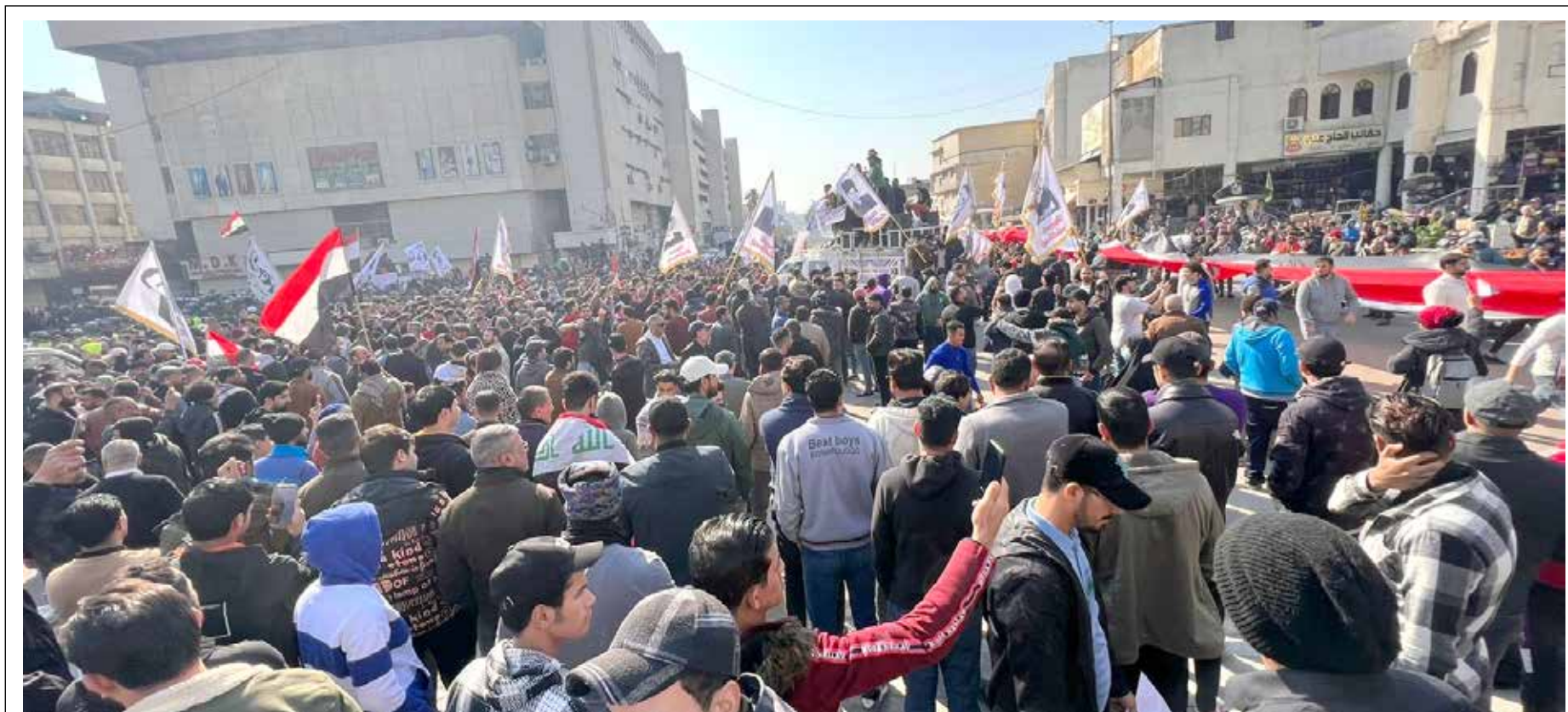
تظاهرة حاشدة يوم أمس أمام البنك المركزي في بغداد

وأشار الرفيق الى ان هناك اشكالية في عدم تسوية سلف كثيرة في عام 2014، ونتيجة عدم اقرار الموازنة عرقلت الحسابات الختامية على اعتبار ان الاساس في ذلك هو موازنة عام 2014، ومن غير المقبول الاستمرار في عدم وجود حسابات ختامية طيلة السنوات الماضية، منتقداً تماهل ديوان الرقابة المالية والحكومة