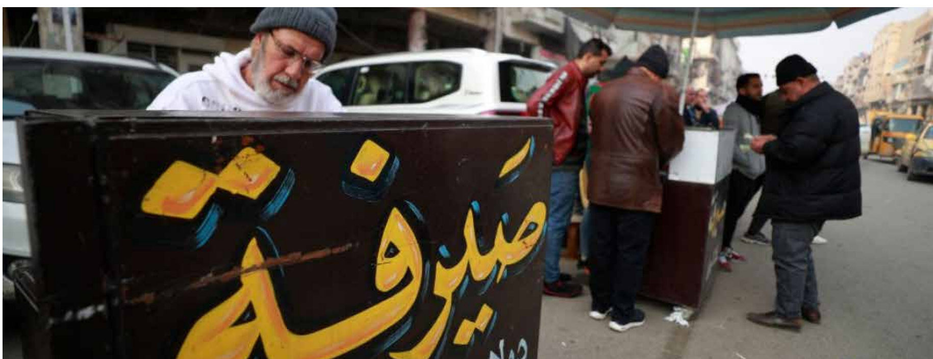
شلل تام يضرب بورصتي الكفاح والحارثية لليوم الثالث على التوالي

تواصل الاحتجاجات المطالبة في مناطق متفرقة من محافظات البلاد، للمطالبة بتوفير فرص العمل والخدمات وتحويل اصحاب الاجور اليومية الى عقود، وفق قرار مجلس الوزراء رقم 315. <<2