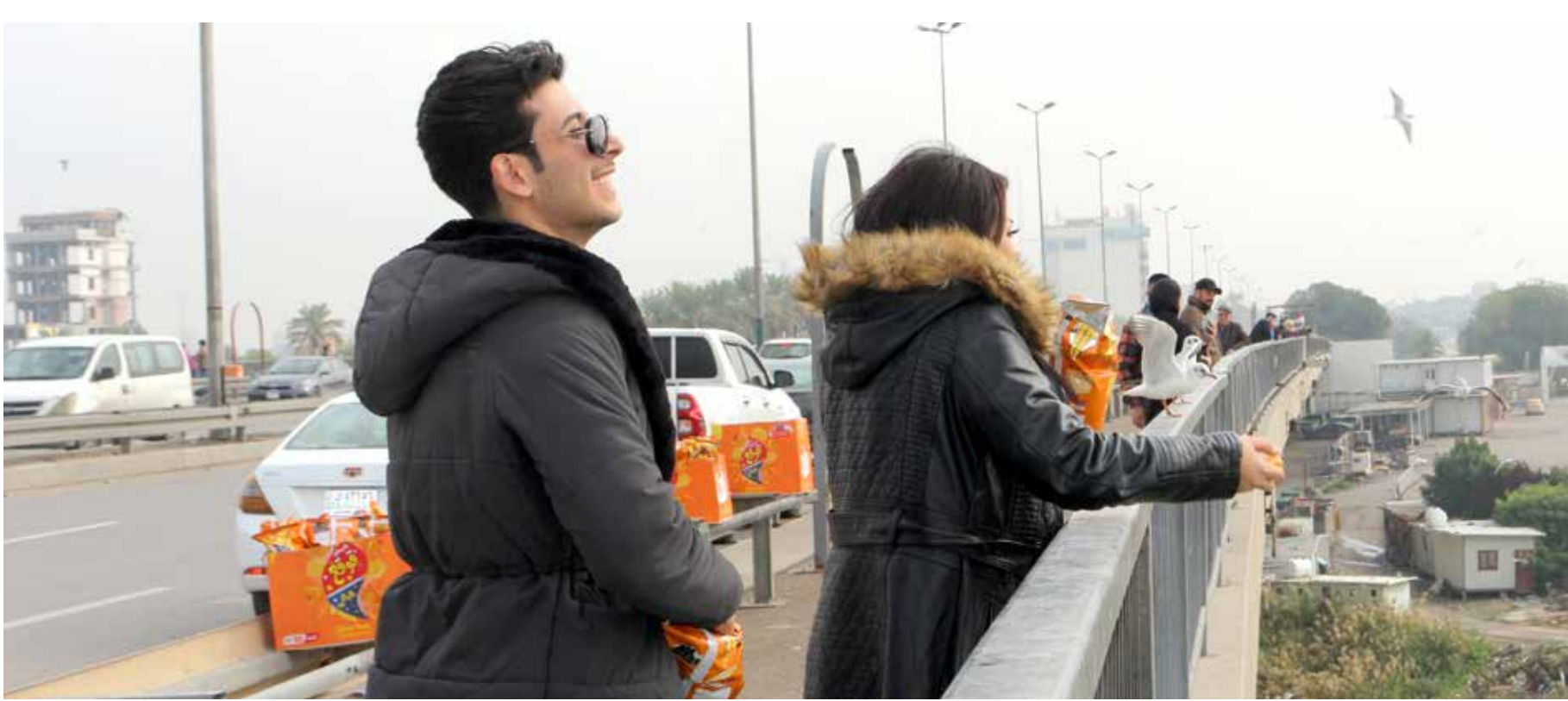
شباب وطلبة من جامعة بغداد على جسر الجادرية يطعمون النورس المحلقة فوق نهر دجلة

واضاف ان الخريجين الاوائل المستعدين من قانون 67 بسبب كتاب صادر من الامانة العامة لمجلس الوزراء الذي قام بدمج الدراسات الصباحية والمسائية وأخذ الثلاثة الأعلى معدلا واستبعدت الثلاثة الآخرين، خرجوا في تظاهرة في بغداد وطالبوا الجهات المعنية بإنصافهم وإلغاء كتاب الاستبعاد وشمولهم بالتعيين.