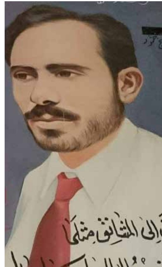
علي الشبيخ حمود

عاشت الذكرى 66 لانتفاضة مدينة الحي الباسلة بمناسبة مرور 66 عاما على اعدام قادة انتفاضة مدينة الحي الباسلة المجد والخلود لشهداء انتفاضة الحي في كانون الأول عام 1957 خلال حقبة العهد الملكي شبه الاقطاعي شهدت المدن العراقية حراكا وفعاليات جماهيرية واسعة من أجل حرية واستقلال البلاد وسعادة الشعب العراقي ضد سياسة النظام البائد الذي خضع لمشيئة الحكومة البريطانية الاستعمارية وجعل نظامه يأتمر بأمرها. ومدينة الحي شأنها كباقي المدن العراقية التي انتفضت ضد تلك السياسة المناوئة لمصالح الشعب والوطن. وكانت ذروة الاحتجاجات في تلك المدينة عام 1957 عندما حصلت المواجهة المسلحة مع قوات النظام المدججة بشتى أنواع الأسلحة وذلك في النصف الثاني من شهر كانون الأول من عام 1957 وقد أريق مرة أخرى الدم العراقي على الساحة العراقية في مدينة الحي البطلة وكانت حصيلة تلك المواجهة عدد من الشهداء والجرحي. وبعد سيطرة القوات الحكومية على المدينة أقدمت على حملات