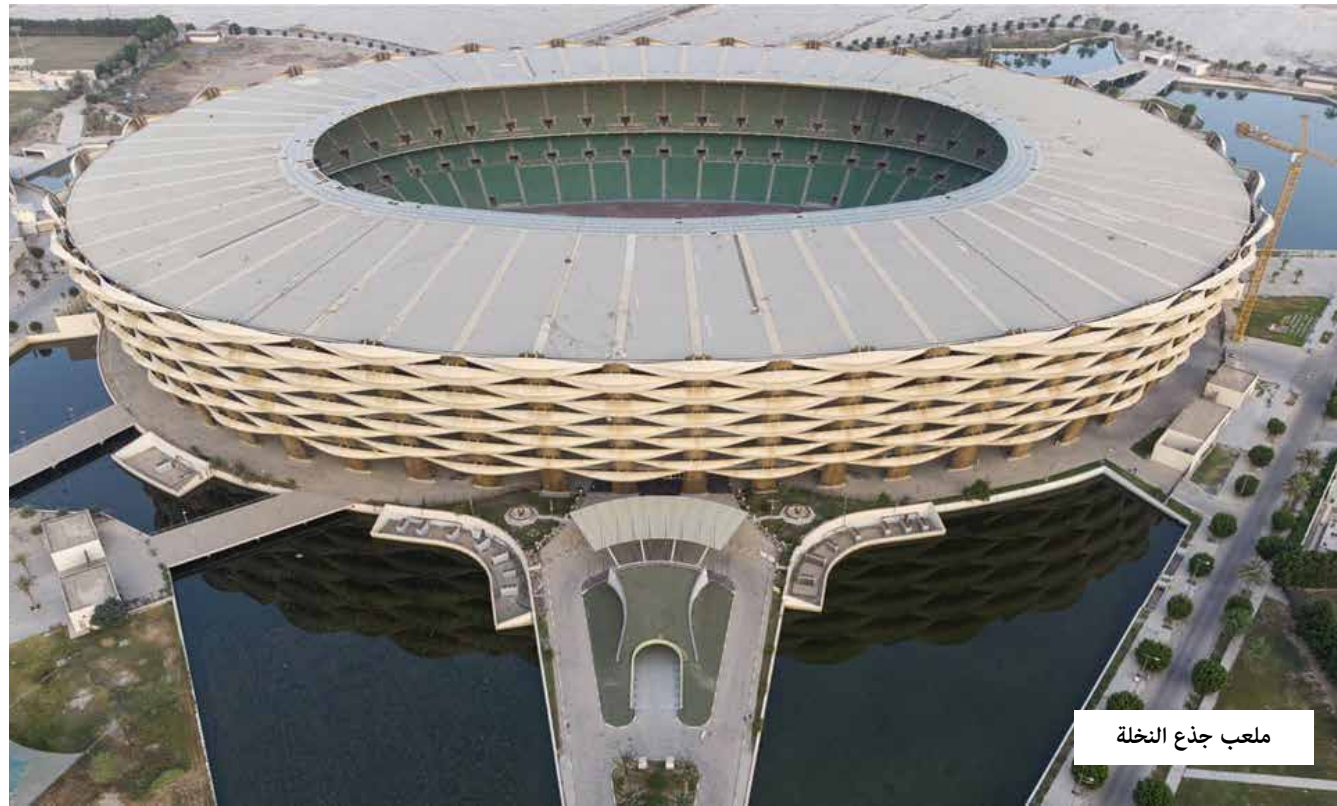
ملعب جدد النخلة

وفي الوقت الذي وصلت الفرق المشاركة في البطولة إلى مدينة البصرة، وسط ترحيب كبير من قبل الجماهير البصرية بالفرق والمشجعين، ظهرت بوادر بيع أسعار تذاكر المباراة الافتتاحية ووصل سعر التذكرة في الدرجة الرابعة إلى حوالي 75 ألف دينار. وعرضت شركات سياحية بيع التذاكر على منصات التواصل الاجتماعي بخمسة اضعاف سعرها الرسمي.