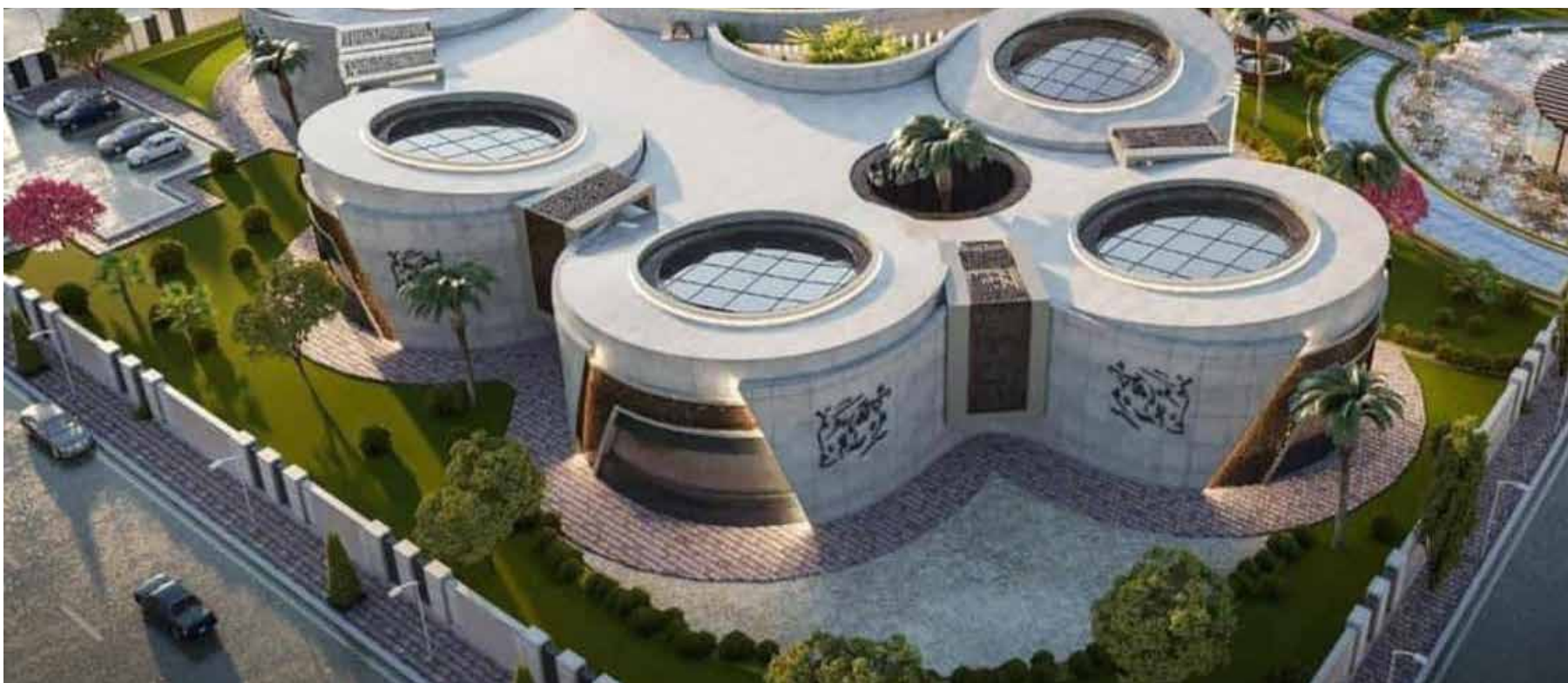
التصميم الاساسي لمركز تنمية قدرات الطفل في الموصل