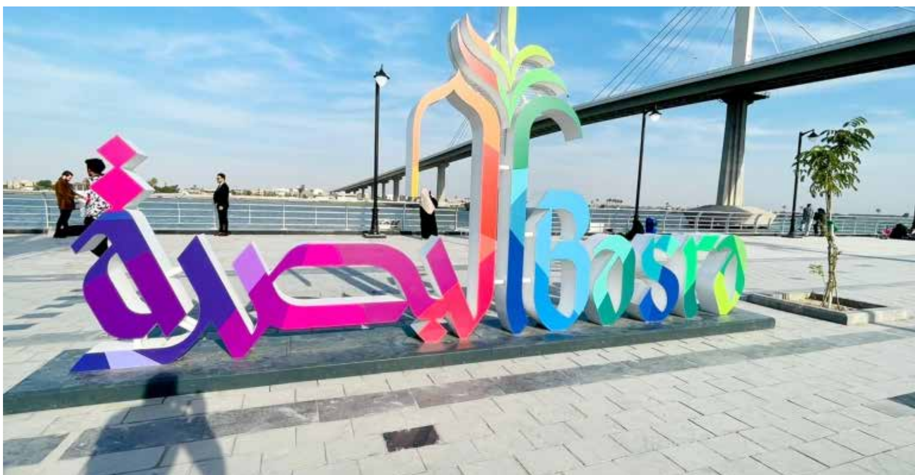
كورنيش البصرة في حلة جديدة استعداداً لاستضافة خليجي 25

وبين ان الموازنة التشغيلية ستكون بحدود 110 ترليوناً والاستثمارية 30 ترليوناً، وهي غير كافية لتحقيق رغبات الحكومة والمحافظين وتطلعات الناس، متوقعا تنفيذ بعض البرامج الترقية في المحافظات،