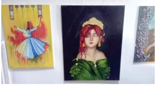
من أعمال المعرض

تحت عنوان «عيون سومرية»، أقامت نقابة الفنانين العراقيين في ذي قار، أخيراً على قاعة القصر الثقافي في الناصرية، المعرض التشكيلي النسوي الثاني، بمشاركة 30 فنانة من بنات المحافظة. المعرض الذي شهد حضوراً حاشداً من مثقفين وفنانين وأدباء ومتذوقين للفن التشكيلي، قص شريط افتتاحه الفنان علي جودة. وضم المعرض لوحات منجزه مختلف المدارس والأساليب الفنية. وقد حملت موضوعات الأعمال رسائل تعبر عن حب الحياة وعن دور المرأة في نهضة المجتمع.