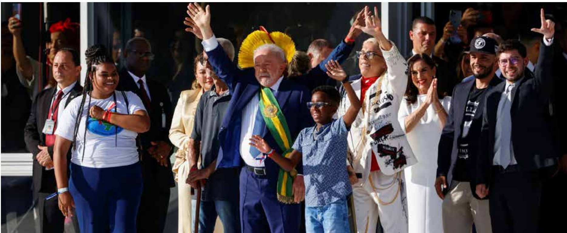
لولا يتسلم الوشاح الرئاسي

في خطابه الأول كرئيس جديد للبلاد، وعد "لولا" بالتركيز أكثر على الحوار في السياسة الخارجية وتوسيع التعاون مع الدول المجاورة في أمريكا الجنوبية وأفريقيا.