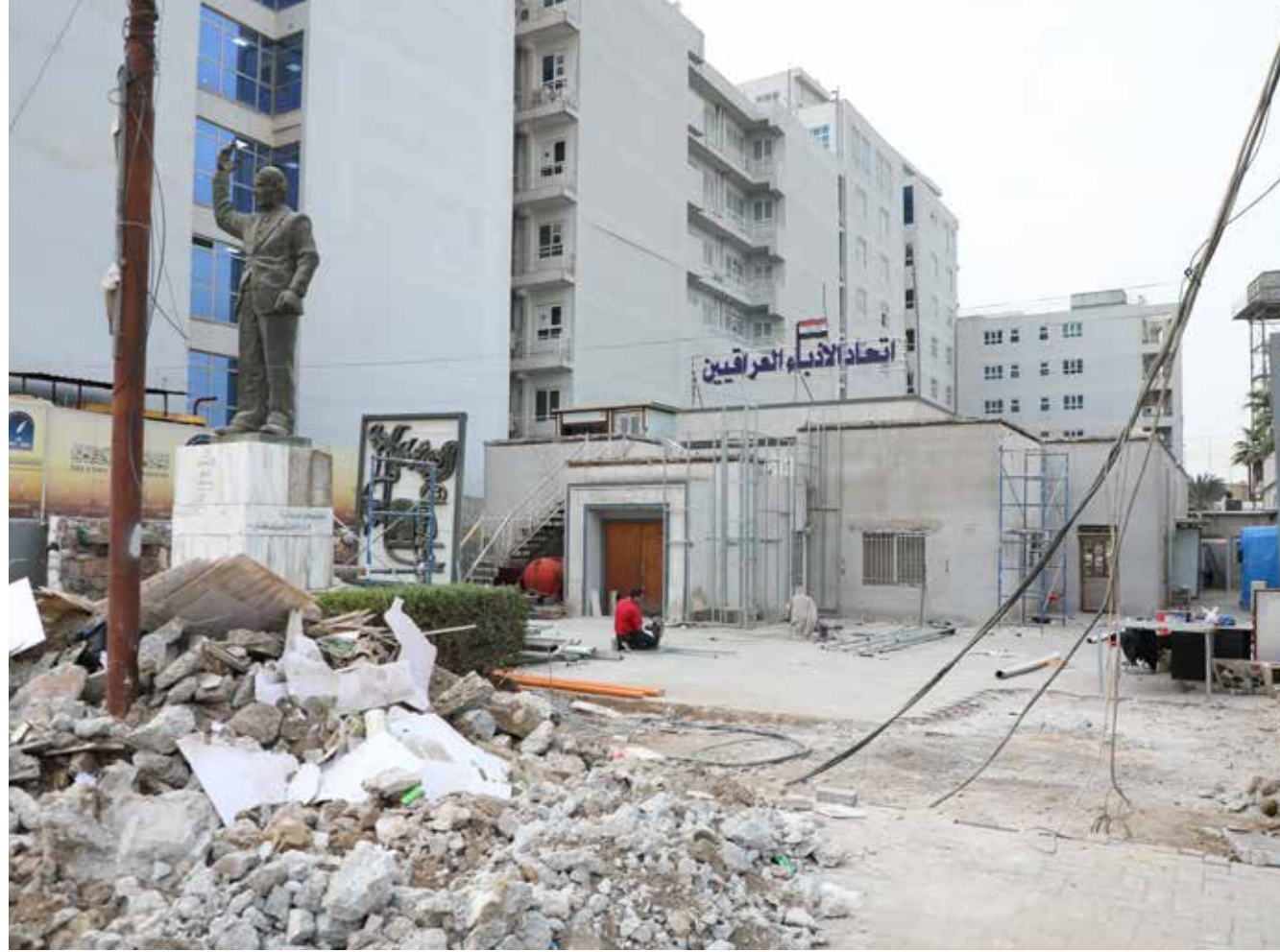
مراسل "طريق الشعب" التقط هذه الصورة لعملية اعمار مبنى الاتحاد

الأمين العام للاتحاد العام للأدباء والكتاب في العراق الشاعر عمر السراي، تحدث في لـ "طريق الشعب"، عن تأهيل مبنى الاتحاد بأنه "منذ أكثر من تسعة أشهر، تعمل على تأهيل مبنى الاتحاد، لكي يكون واجهة جميلة ومميزة تليق بسمعة الأديب العراقي، لذلك تم التواصل مع البنك المركزي ورابطة مصارف الخاصة ومبادرة (تمكين) من أجل تحقيق هذا الغرض، وانطلاقاً مما حققه الاتحاد من دعم للموضوعات والمشروعات الرائدة والجيدة والجميلة (من أجل عراق وبغداد اجمل) تمكنا من استحصال الدعم لتأهيل مرافق مهمة من مرافق الاتحاد". وأضاف السراي، ان "من بين المرافق التي يتم العمل على تأهيلها في مبنى الاتحاد، البوابة الخارجية وواجهة الاتحاد، فضلاً عن تأسيس متحف خاص بالأدباء، كوننا نعاني من ضياع الذاكرة الأدبية والثقافية"، لافتاً الى ان "المتحف سيحتوي على مجموعة من لقي الأدباء وتمثيل ولوحات فضلاً عن مقتنيات بسيطة تمثل تجاربهم من مخطوطات وكتب قديمة وأدوات قريبة منهم في حيز الاستعمال، لذلك سوف يكون جزءاً كبيراً من قاعة (زها حديد)، التي يجري العمل حالياً على ترميمها وتأهيلها وتحويلها إلى مكان يليق بهذا المتحف". وتابع، انه "يتم أيضاً تأهيل سطح إحدى القاعات لكي