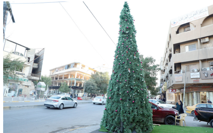
شجرة الميلاد في شارع الكرادة داخل طريق الشعب