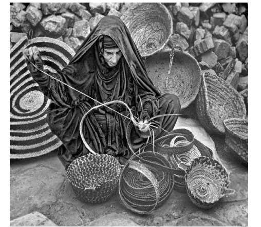
من أعمال المعرض

وأوضح أن الكتاب يتحدث عن «طريق الحرير» الذي يعد طريقاً تجارياً متشعباً استطاعت الصين عبره التواصل مع أوروبا وأمريكا والدول النامية، مبيناً أن الكتاب تناول قضايا تاريخية