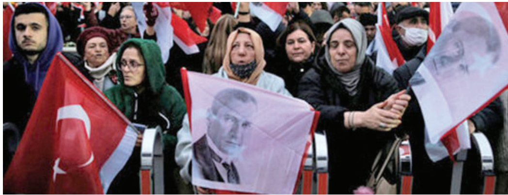
احتجاج أنصار أوغلو أمام مبنى محافظة إسطنبول بعد إصدار الحكم

حزيران ٢٠٢٣. والمعروف ان الدستور التركي يحظر على الرئيس الترشح لأكثر من ولايتين، الا إذا قرر البرلمان بأكثرية ٦٠ في المائة من أعضائه اجراء انتخابات مبكرة.