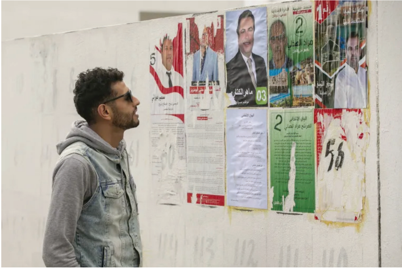
مراقبون يتحدثون عن مشاركة ضعيفة في الانتخابات البرلمانية التونسية

«المشاركة ضعيفة جداً في الخارج، في انتظار تحيين معطيات الملاحظين». وبين أن «نسب المشاركة هي الأضعف منذ 2011، وهو أمر منتظر بسبب غياب المنافسة حيث يوجد مترشح وحيد وهو فائز، بحيث لا يرى بعض الناخبين بدأ من الذهاب للاقتراع للمشاركة في الخارج لا تُعدّ معياراً لاعتبار أنها أقل من نسب المشاركة في الداخل». وقال إن «غياب البعثة الأوربية للمراقبة عن ملاحظة هذه الانتخابات بعد قرارها الخميس، مؤشر سلبي حيث اعتدنا وجودهم خلال المحطات الانتخابية السابقة، وهذه المرة اختاروا عدم الحضور، ولديهم أسبابهم الخاصة، وهذا القرار ليس اعتباطياً، وقد يأتي تقييماً منهم بأن هذه الانتخابات لا تستجيب للمعايير التي يعتمدونها».