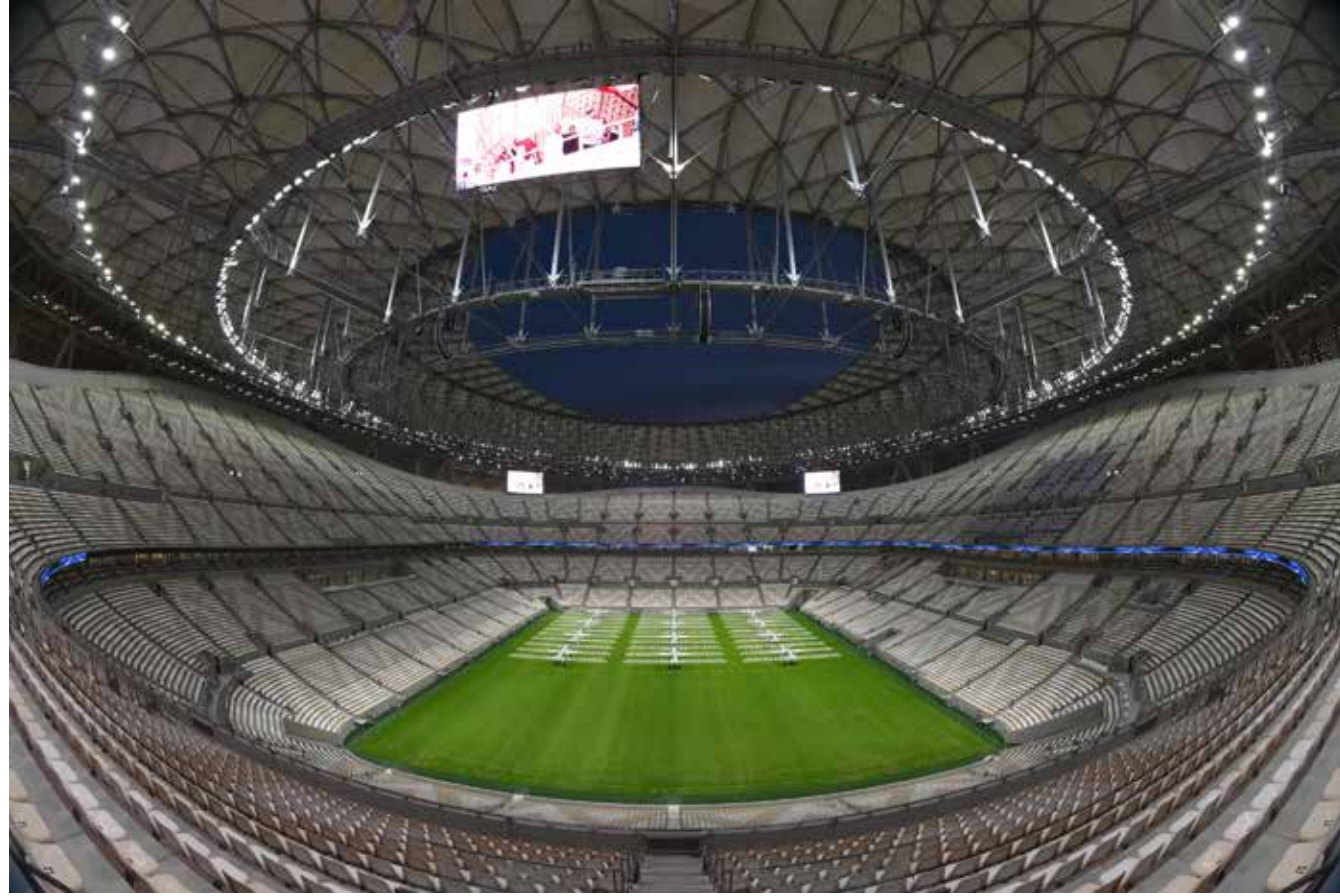
استاد لوسيل يستعد لاحتضان نهائي كأس العالم

على بيليه، كأكثر اللاعبين تسجيلاً للأهداف بكأس العالم قبل بلوغ 24 عاماً، حيث أحرز أيقونة الكرة البرازيلية 7 أهداف في هذا العمر. وبصعوده لنهائي مونديال 2022، أصبح منتخب فرنسا سادس فريق يتأهل لهذا الدور في نسختين متتاليتين بالمسابقة بعد منتخبات إيطاليا والبرازيل وهولندا وألمانيا والأرجنتين، كما صار رابع بطل للمونديال يبلغ المباراة النهائية في النسخة التالية للبطولة التي توج بها.