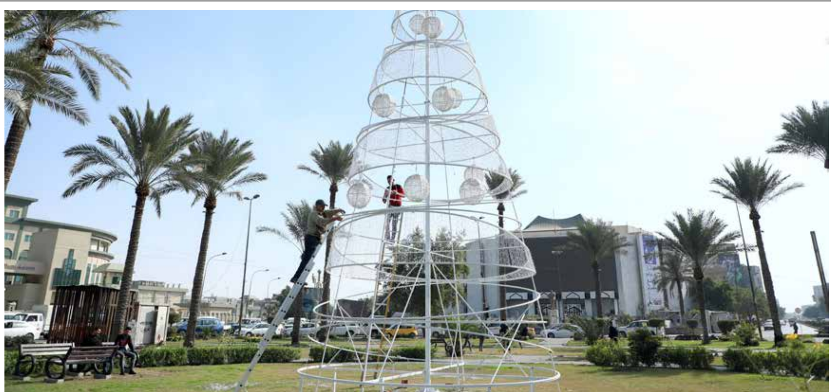
تحضيرات أمانة بغداد للاحتفال بأعياد الميلاد ورأس السنة في ساحة الفانوس وسط بغداد

ويضيف أن "النقاشات داخل مجلس النواب قد تستمر طويلاً لوجود كمية هائلة من الوعود التي اطلقتها الحكومة والجهات السياسية للمواطنين، وعدم الإيفاء بها يسبب مشكلة كبيرة للجميع"، كاشفاً عن ان "المعلومات المتوفرة تفيد بمبالغ الموازنة سوف تتراوح بين 130 - 140 ترليون دينار مع تحديد سعر برميل النفط بحدود 65 دولاراً".