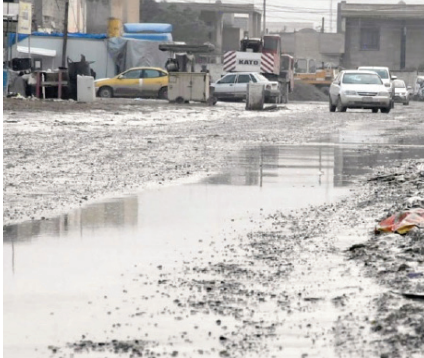
أحوال في الشتاء وغبار خانق في الصيف

ولفت إلى أن "بعض المشاريع لا يمكن تنفيذها، لأنها تحتوي على عوارض تحتاج إلى مبالغ عالية، ما اضطر الصندوق إلى إضافة مبالغ أخرى، مشيراً إلى أن "المحافظ عقد اجتماعاً مع الجهات المستفيدة، ولوح بإجراءات وعقوبات بحق من يستمرون في تأخير المشاريع".