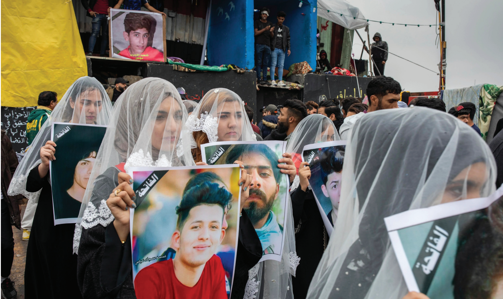
نساء عراقيات يرفعن صور شهداء انتفاضة تشرين 2019

اجزاء مما طرحه المنظمات، بينما تتجاهل كل شيء تقريبا في أغلب الأحيان، ولا تستمع إلى ما يقال من قبل هذه المنظمات.» وبشأن سبب عدم الاستماع إلى الآراء المهتمة بحقوق الإنسان، يشدد السلامي على أنها بسبب «الوضع السياسي الذي يراد منه تقويض الديمقراطية الحقيقية ومبادئها مثل نزع السلاح وعدم عسكرية المجتمع والذهاب نحو تنفيذ مبادئ حقوق الإنسان المثبتة في مواد الدستور»، مضيفا أن «الكثير من منفي القانون، بمعنى الشرطة والجيش والقضاء ولجان التحقيق يفترض أن ينفذوا القانون ولكن بعض الأحيان وضمن السياسة العامة للبلاد لا يكون من مصلحة هذه الأطراف الالتزام، ويعكسون تطبيق القانون وفق المزاجات الشخصية أو التراتبية وليست القانونية، وعليه هذا يجعل المؤسسات ذات طابع قمعي معزز بروح التعسف».