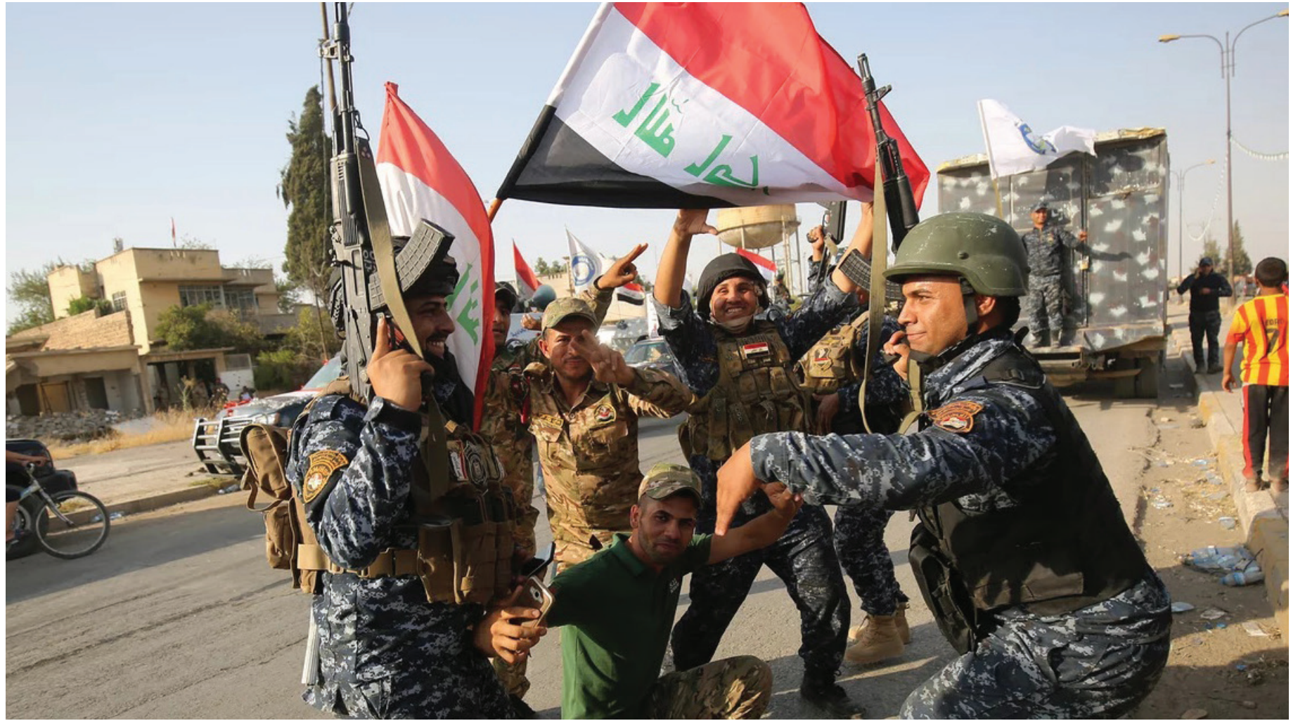
جانب من احتفالات القوات الامنية غداة اعلان النصر على داعش في كانون الاول 2017