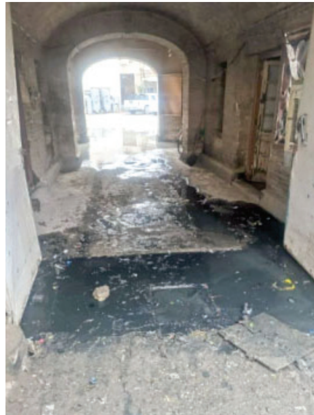
مياه المجاري تغزو أرضية المبنى