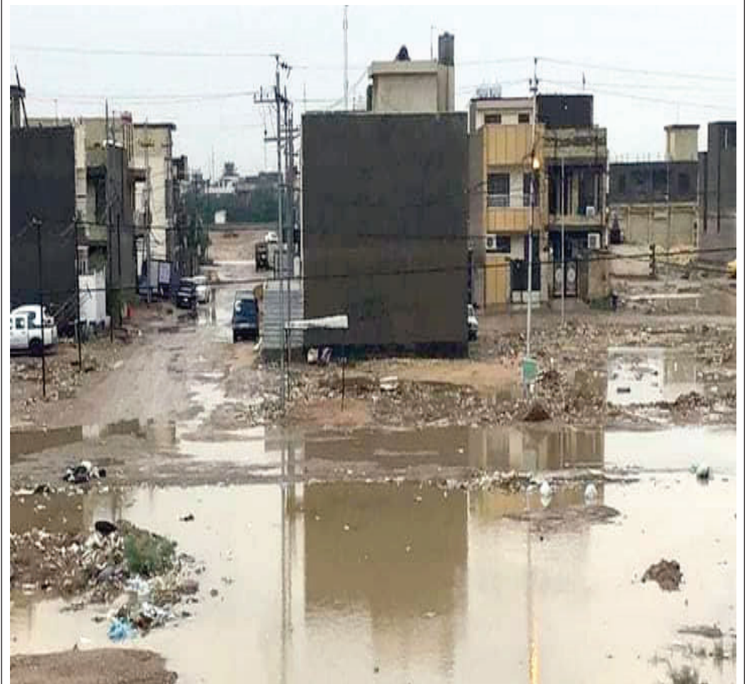
المحلة 864 - حي كراة في منطقة الدورة جنوبي بغداد منسية مهملة منذ نحو 20 عاما - وفق ما يذكره أحد السكان في منشور على فيسبوك. وللتذكير، أن هذه المحلة ضمن حدود مسؤولياتكمما الخدمية يا أمانة بغداد وبلدية الدورة!