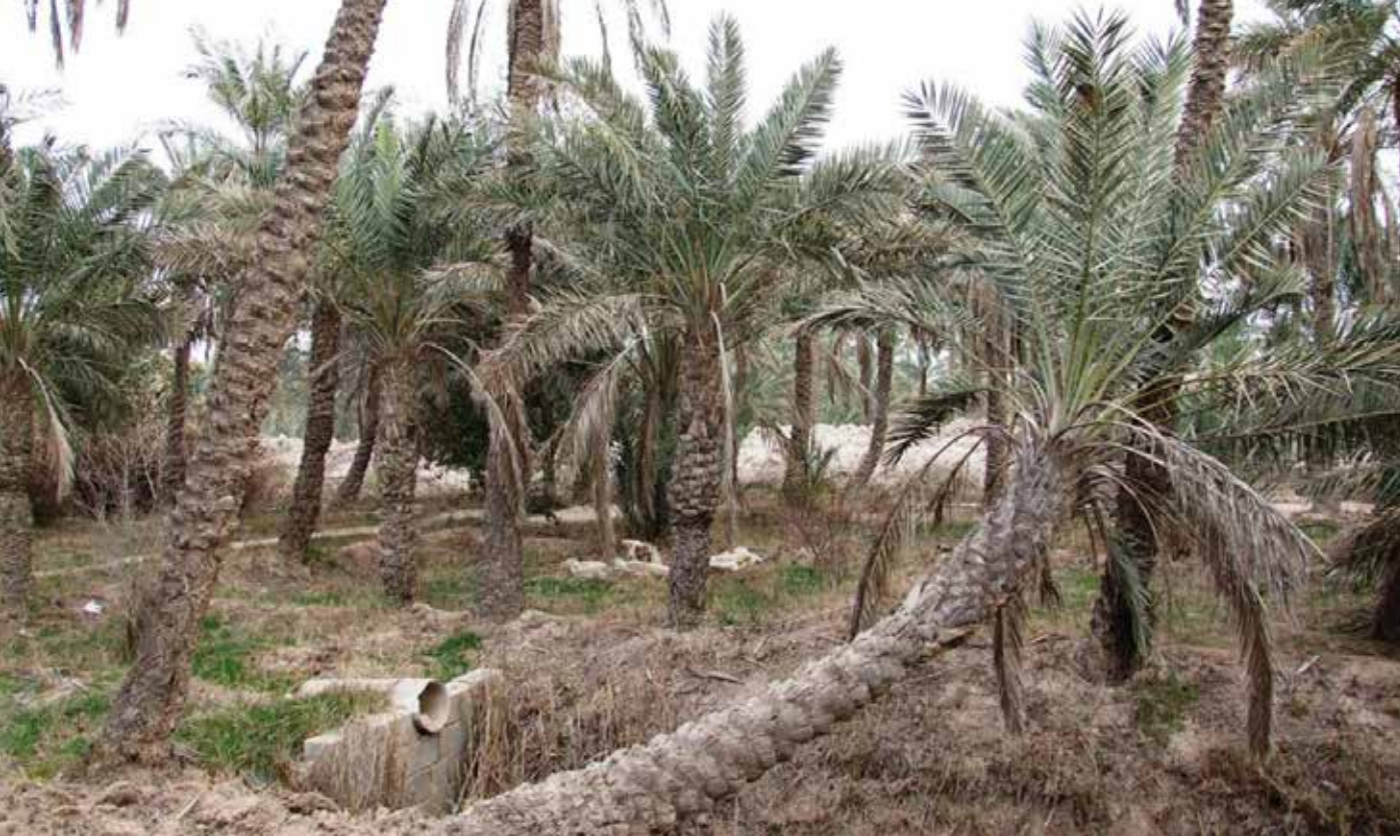
أهالي البصرة يستوردون التمور بعد ان كانوا يصنعونها

واعتبر البنك الدولي، أن غياب أي سياسات بشأن المياه قد يؤدي إلى فقدان العراق بحلول العام 2050 نسبة 20 في المائة من موارده المائية. وهنا يتوجب التحذير بان الامن الغذائي للعراقيين في خطر إذا لم تقم الدولة والحكومة بمعالجات وخطوات جادة لتلافي الخطر. محافظة البصرة كانت تعتمد على زراعة النخيل، ولكن بسبب الحروب على العراق جرفت بساتين النخيل، وتلاها حرب المياه من قبل تركيا وإيران، التي قطعت المياه بنسبة أكثر من 70 في المائة مما تسبب في تقدم اللسان الملحي في شط العرب بشكل مخيف، ما تسبب بعدم صلاحية المياه للاستهلاك البشري أو الزراعي، وأثر سلباً على الحيوانات. وفي الختام أين الحكومة من هذه المعاناة، وليس هناك من يسمع استغاثة جميع أهالي البصرة والمتضرر الاكبر هم سكان الريف والفلاحين بشكل خاص.