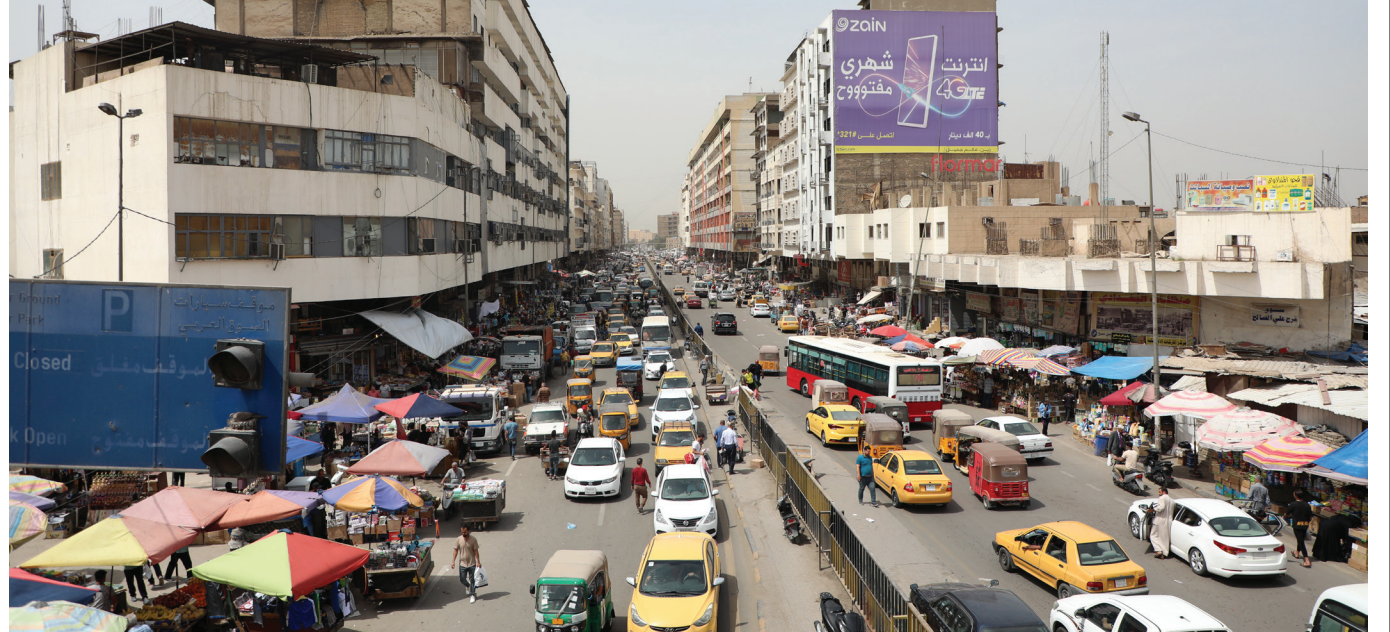
شوارع العاصمة لا تستوعب أعداد السيارات