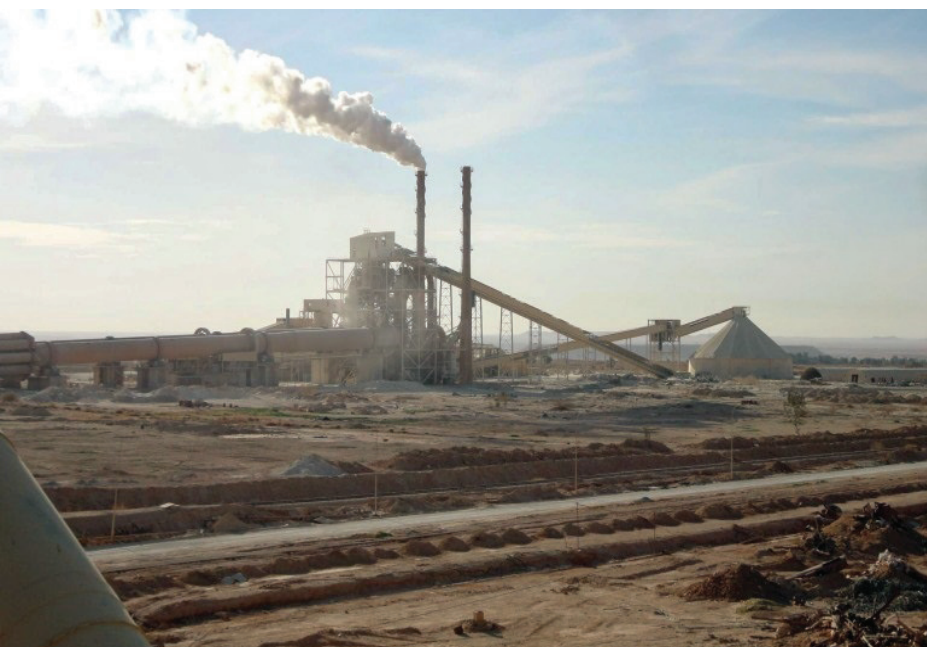
مداخل مصانع الأسمدة الفوسفاتية في صحراء العراق الغربية

ويحتل العراق المركز الثاني عالمياً في احتياطي الفوسفات، الذي يُقدَّر بنحو 10 مليارات طن، ويمثل ما يقارب 9 في المائة من حجم الاحتياطي العالمي. كذلك يمتلك العراق خامات المعادن الصناعية الفلزنية