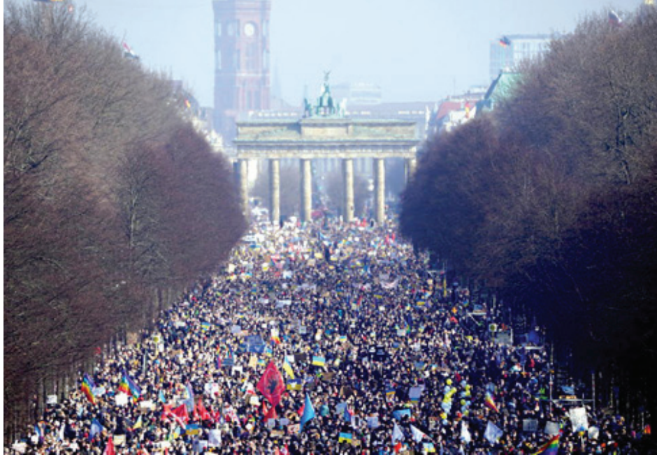
تظاهرات رافضة للحرب في ألمانيا

جميع المناطق المتضررة من الحرب، بما في ذلك المناطق الواقعة تحت السيطرة الروسية. ومن الضروري ان يكون البرنامج خارج دائرة صراعات الهيمنة بين أطراف المعسكر الغربي، كما هو الحال الآن. رفع العقوبات المفروضة وفق برنامج مقبول وقابل للتطبيق. ولتطمين روسيا أكثر إطلاق مفاوضات حول الحد من الأسلحة الاستراتيجية. والبدء بمؤتمر للأمن الأوروبي المشترك مع روسيا وليس ضدها، مع توفر إرادة سياسية واقعية لتقديم تنازلات متقابلة من الأطراف المشاركة.