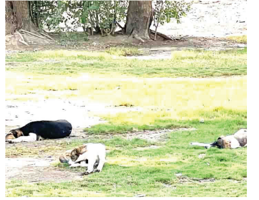
الكلاب السائبة تسرح وتمرح وتغط في النوم وسط حدائق أبو نؤاس!