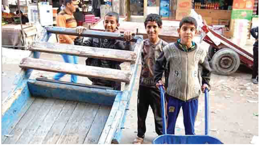
اطفال في سوق العمل بدل صفوف الدراسة!

الخطر في العراق، عندما قالت ان هناك 12 مليون شخص أمي في البلاد، وهذا العدد ضعف آخر إحصائية رسمية حكومية صدرت قبل عامين. حينها كان هناك 6 ملايين أمي. ولا يبدو أن ظاهرة الانقطاع عن المدارس سنتتهي في العراق، لأنها متراكمة منذ أكثر من 3 عقود، لكن ما يجب على الحكومة والجهات المعنية فعله، هو الحد قدر المستطاع من ارتفاع هذه النسب، لتجاوز آثارها السلبية على مستقبل البلاد، وهذا لن يتم إذا لم تول الحكومة قطاع التعليم اهتماما كبيرا، وتوفر متطلباته كافة، من بنى تحتية ومستلزمات دراسية وكوادر كفوءة، إضافة إلى معالجة مشكلة البطالة وتحسين الوضع الاقتصادي للعائلات.