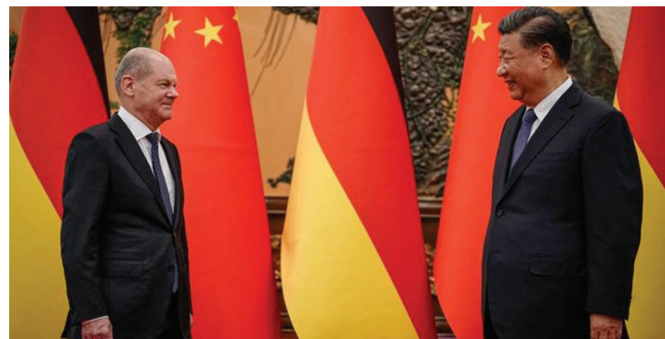
الرئيس الصيني يستقبل المستشار الألماني

حذر الرئيس الصيني شي جين بينغ من استخدام الأسلحة النووية أو التهديد بالقيام بذلك. وفي حديثه مع المستشار أولاف شولتز، قال الرئيس، بحسب وزارة الخارجية، إن المجتمع الدولي يجب أن يعمل على ضمان "عدم استخدام الأسلحة النووية وعدم خوض حروب نووية". ونقل عن شي جين بينغ قوله "يجب رفض استخدام الأسلحة النووية أو التهديد باستخدامها". ويجب تجنب أزمة نووية في أوراسيا. يعين على الأطراف المعنية أن تتحلّى بالعقلانية وأن تمارس ضبط النفس وأن تهيبّ الظروف لاستئناف المفاوضات. كما ينبغي للمجتمع الدولي أن يبذل كل جهد يفيضي إلى حل سلمي. وقال شي إن الصين تدعم ألمانيا وأوروبا لتسهيل محادثات السلام وبناء هيكل آمني مستدام في أوروبا. ومع ذلك، استمر في عدم انتقاد روسيا كشريك استراتيجي.