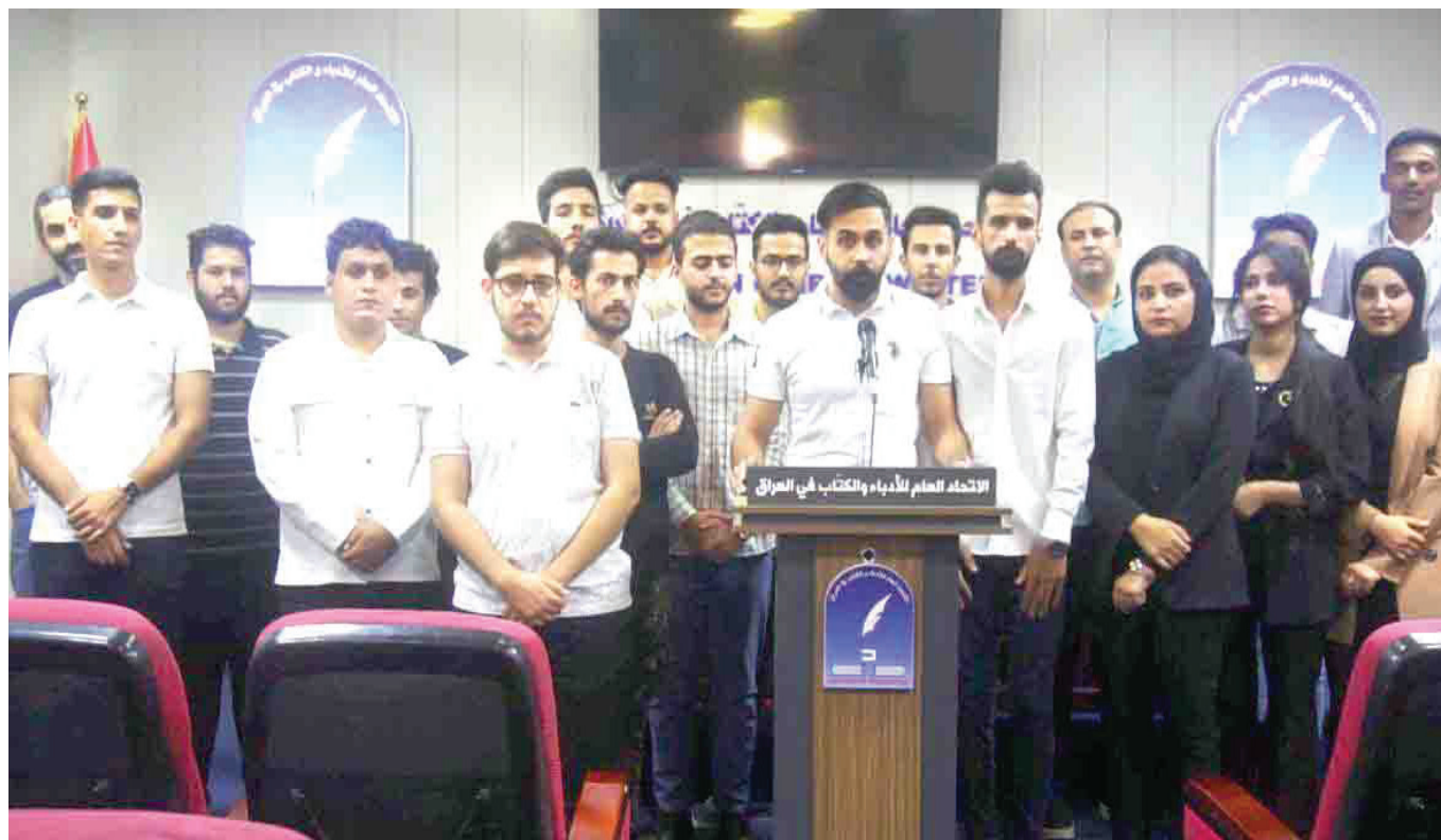
جانب من المؤتمر الصحفي لإطلاق حملة «المنحة حقنا»

عقد اتحاد الطلبة العام في جمهورية العراق اول امس الجمعة، مؤتمراً صحفياً في مقر اتحاد الأدباء والكتاب العراقيين، واعلن عن انطلاق حملة المنحة الطلابية تحت عنوان (المنحة حقنا)، والتي توقف صرفها في العام 2014 بذريعة الحرب على تنظيم داعش الإرهابي، وقلة الموارد وتخصيص الجزء الأكبر من ميزانية الدولة للحرب.