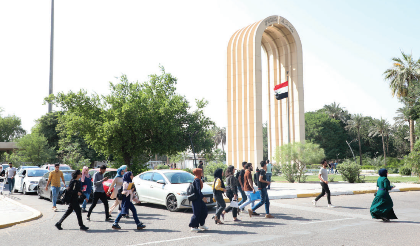
آلاف الطلبة المقبولين يتوجهون الى مقاعد الدراسة.. بعضهم يقول: مصيرنا مجهول!

وتوجه انتقادات كثيرة إلى الحكومة ووزارة التعليم بعدما أصبحت المعدلات العالية ليست مؤثرة مثل السابق في الحصول على الكلية التي يطمح الطالب إليها. وفي المقابل، أصبحت هناك جامعات أهلية كثيرة وانها كالدكاكين التي لا تهتم بالجانب الأكاديمي، بل باب لتمويل الاحزاب الفاسدة، ولا تهتم مطلقا بالرسالة العلمية، ولا يعنىها شيء سوى جني الأموال على حد قول الكثيرين.