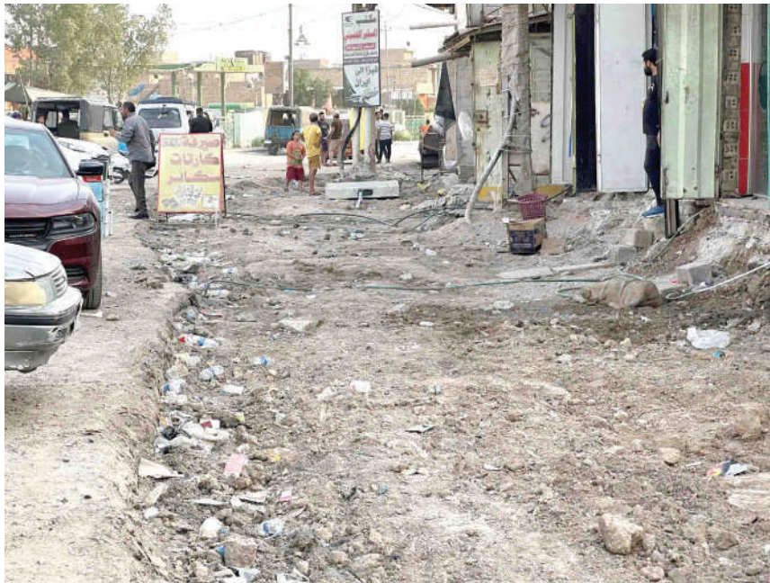
"شارع فهمي المدرس" في حي اور ينتظر إكمال مشروع تبليطه الذي باشرت به أمانة العاصمة نهاية أيلول الماضي

يوجد في حي اور سوق شعبي، لكنه غير منظم ولا تمتد إليه يد الخدمات بشكل منتظم. فالأريال تتراكم باستمرار عند مداخل السوق وعلى الشارع العام المحاذي له، مخلفة رائحة كريهة ومنظراً مقرفاً. بينما يعاني السوق بشكل عام، الفوضى وعدم التنظيم من ناحية المحال والبسطات وطريقة عرض البضاعة. أهالي حي اور يدعون الجهات المعنية إلى الوقوف على مشكلاتهم الخدمية المذكورة في هذا التقرير، واتخاذ الإجراءات اللازمة لمعالجتها عاجلاً.