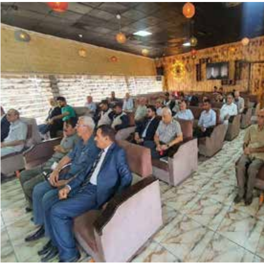
الكوت - طريق الشعب

أقام اتحاد الأدباء والكتاب في واسط، أخيراً، مهرجان العراق السنوي المحلي الأول - دورة الشاعر سعد الواسطي. حضر المهرجان الذي أقيم بالتعاون مع البيت الثقافي الواسطي وإذاعة "الكوت أف أم" ومؤسسة طور نفسك، جمع من الأدباء والمثقفين والمهتمين في الشأن الثقافي.