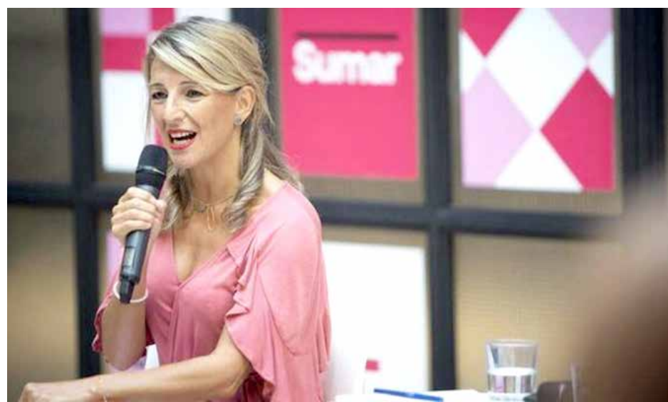
يولاندا دياز في اجتماع سومار ايلول 2022

تخبرنا نعومي كلاين (صحفية كندية ناقدة للراسمالية والعهولمة) أن كل السياسات هي عمليا سياسات مناخية. بعبارة أخرى، سومار يعني، ان يفكر كل فرد بما هو ضروري في العشر سنوات المقبلة، وفي إطار سوماتجري محاولة تقرب الشؤون العامة من المواطنين وسد الفجوة الموجودة في اسبانيا بين المواطنين والسياسة، وهي فجوة هائلة. وعندما تكون السياسة مجرد ضجيج والسياسيون يمثلون مشكلة للمواطنين، فهناك خطأ ما. لذلك، سومار هي أداة تهدف إلى توسيع الديمقراطية، باعتبارها قيمة وأولوية قصوى. والتحدي هو فك الارتباط بين حقوق المواطنين وسوق العمل، كما يقول عالم الاجتماع البرتغالي وايفنتورا دي سوزا سانتوس.