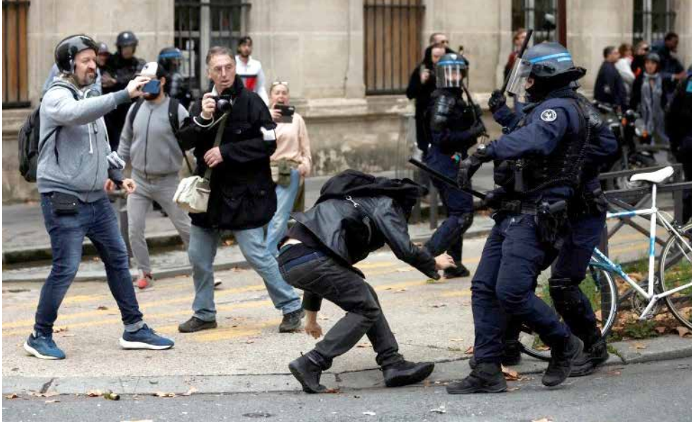
الإضرابات والاحتجاجات مستمرة في ظل رفض الحكومة لمطلب ربط الأجور بالأسعار

500 يورو. وتضيف أن نحو 140 عاملاً بمجموعة "سيرو" الصناعية في منطقة لاروش سيخ يون نظموا إضراباً دام ساعة للمطالبة برفع أجورهم.