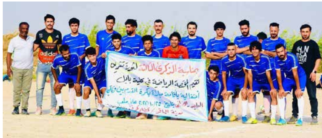
الحلة - طريق الشعب

قدم بين فريقين شعبيين، وذلك على ملعب مدينة الباقر في قضاء كوثن. المباراة التي نظمت بالتعاون مع اللجنة الأساسية للحزب في ناحية جبلة التابعة للقضاء، جرت بين فريق «العابدة» و«المصطفى»،