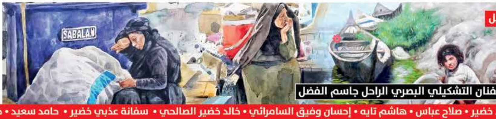
في العدد المقبل الطريق الثقافي

ملف خاص عن الفنان التشكيلي البصري الراحل جاسم الفضل