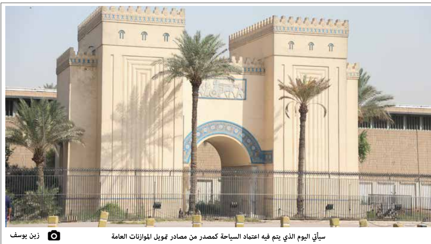
سيأتي اليوم الذي يتم فيه اعتماد السياحة كمصدر من مصادر تمويل الموازنات العامة

قيادة الاطار التنسيقي في حالة عدم اخذ الاستحقاق الانتخابي وفق القانون في تشكيل الحكومة الجديدة ستعمل على اخذ منصب رئيس البرلمان.