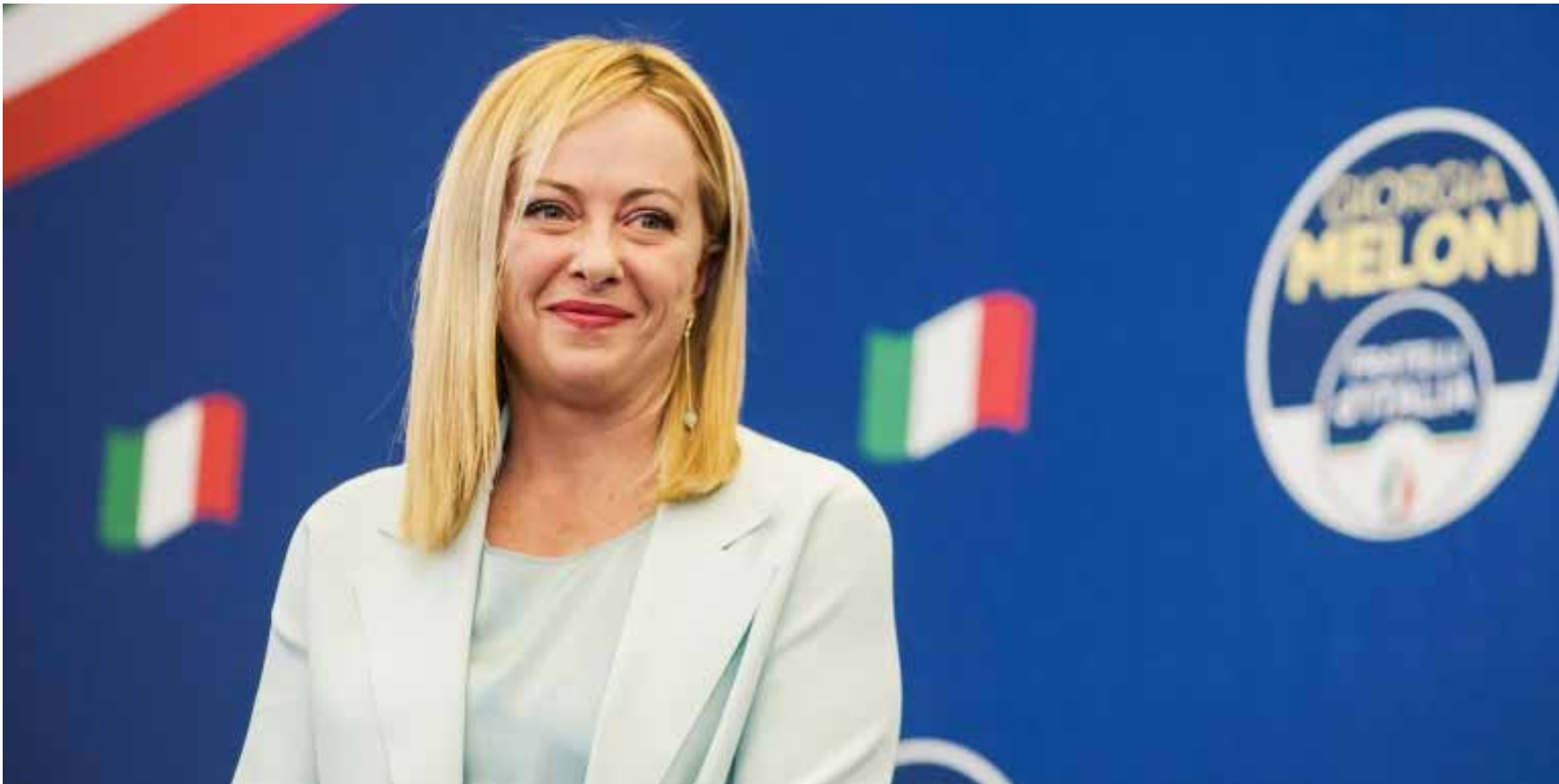
تكليف جورجيا ميلوني رئيسة حزب «فرايتلي ديتاليا» (إخوة إيطاليا) اليميني المتطرف بتشكيل الحكومة الإيطالية

تاريخ اليسار، مع التأكيد على ضرورة الدفاع عن جملة التضحيات الجسام التي رصّعت جبين هذا التاريخ، في مجرى النضال من أجل الحرية وحقوق الإنسان والديمقراطية والمساواة والتنمية والتقدم الفردي والمجتمعي.