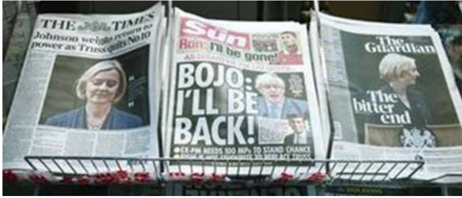
هل يعيد المحافظون جونسون ثانية؟

مرة أخرى. يشعر المحافظون الآخرون بالفزع من هذه العودة. قال عضو البرلمان جيسي نورمان: "ستكون كارثة مطلقة".