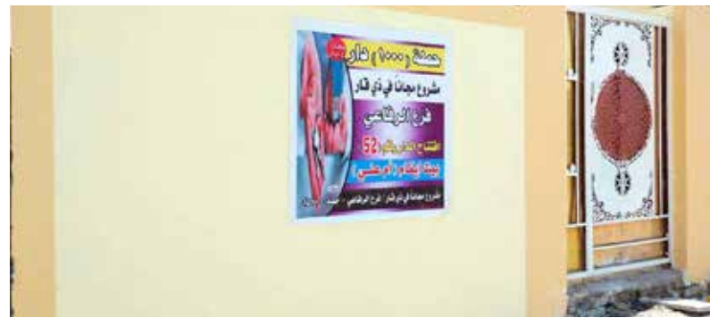
منزل ضمن "حملة 1000 دار" في ذي قار جرى تسليمه لعائلة مستحقة

ويضيف في حديث صحفي، أنهم يسعون لأن يكونوا أداة تغيير واسعة النطاق، ليس عبر التظاهر والاعتصام فقط، بل على مستوى مساعدة المجتمع.