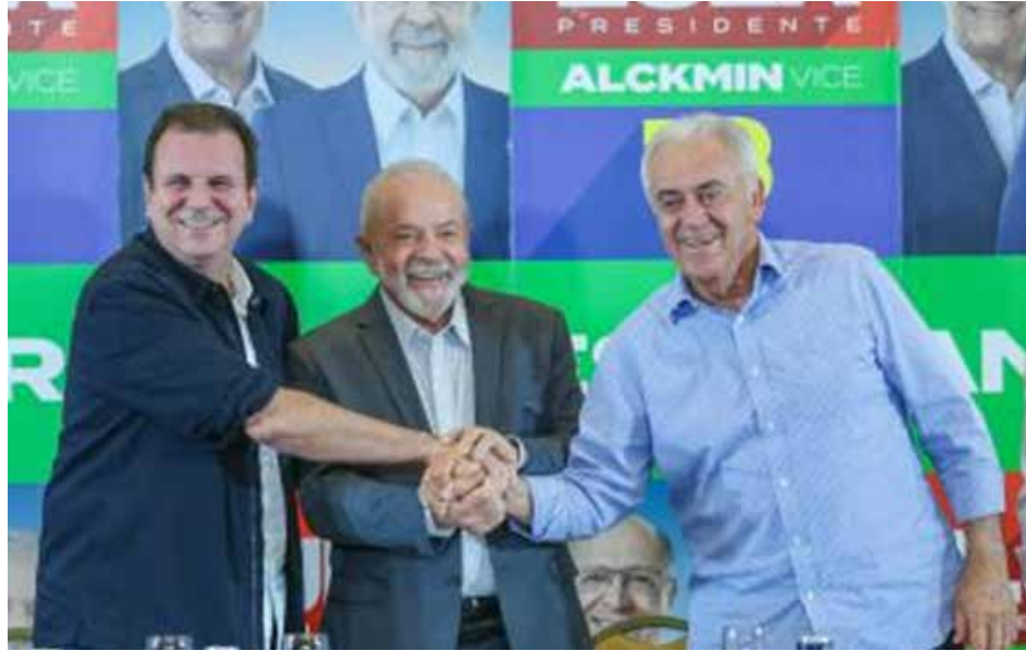
«لولا» مع شخصيات داعمة جديدة في ساو باولو

توجهاتهم ضد الدكتاتورية العسكرية والذي أنتج التحول الديمقراطي عام 1988، دفع العديد من شخصيات يمين الوسط، واليمين التقليدي، إلى إعلان الدعم للمرشح اليساري، الذي يختلفون معه فكريا وسياسيا، انه تحول يعكس لنا أهمية تراكم الوعي بالديمقراطية والدفاع عنها