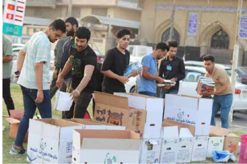
«حملة شبابنا» في النجف تستقبل التبرعات

ولم تكن هذه المبادرة جديدة من نوعها. فهي مستمرة منذ نحو 7 سنوات. إذ يواصل