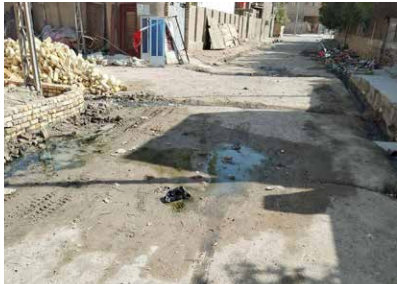
هنا "الحي العسكري". ماذا لو أمطرت السماء!؟