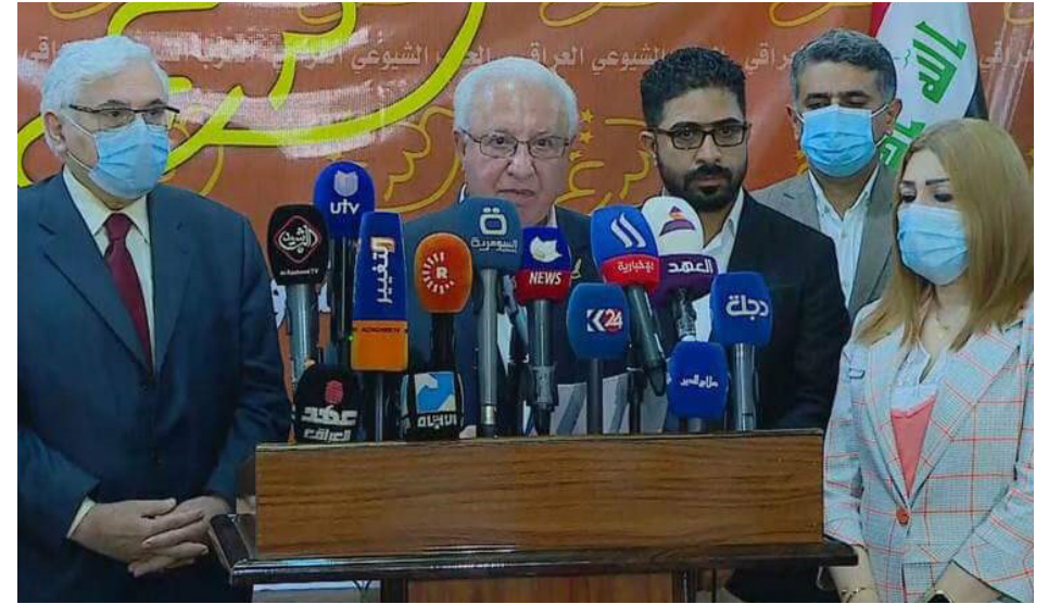
من المؤتمر الصحفي للحزب الشيوعي العراقي يوم ٢٤ من تموز ٢٠٢١ لاعلان مقاطعته الانتخابات

يقول الخبير في الشأن الانتخابي دريد توفيق: إن مخيبة للآمال، بعدما عزز نواب البرلمان وقواهم "الانتخابات المبكرة الأخيرة وعلى الرغم من الآمال السياسية ظاهرة الاستمرار في التجاوزات الدستورية