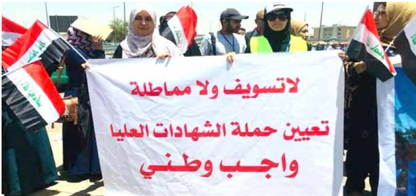
تظاهرة سابقة لحملة الشهادات العليا