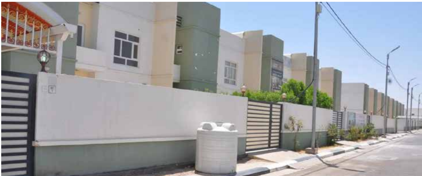
الفساد يدخل على خط السكن.. الفقراء من لهم؟

ولفت الى انه «يجب ان تكون هناك موازنة تليق باسم وزارة التربية حتى يكون للمعلم مستوى عال من التدريب والخدمة، كذلك ابنية مدرسية وصفوف لائقة يقوم المعلم فيها بواجباته»، مؤكداً ان «المعلم العراقي اليوم حريص كل الحرص، على ان يعيد ذهن وفكر وعقل الطالب من خلال النصح والارشاد، وسط كل الحالات السلبية الدخيلة على مجتمعنا، والعمل على خلق انسان صالح في من وزارة التربية وفق المادة 229 ع لدى قاض هذا المجتمع».