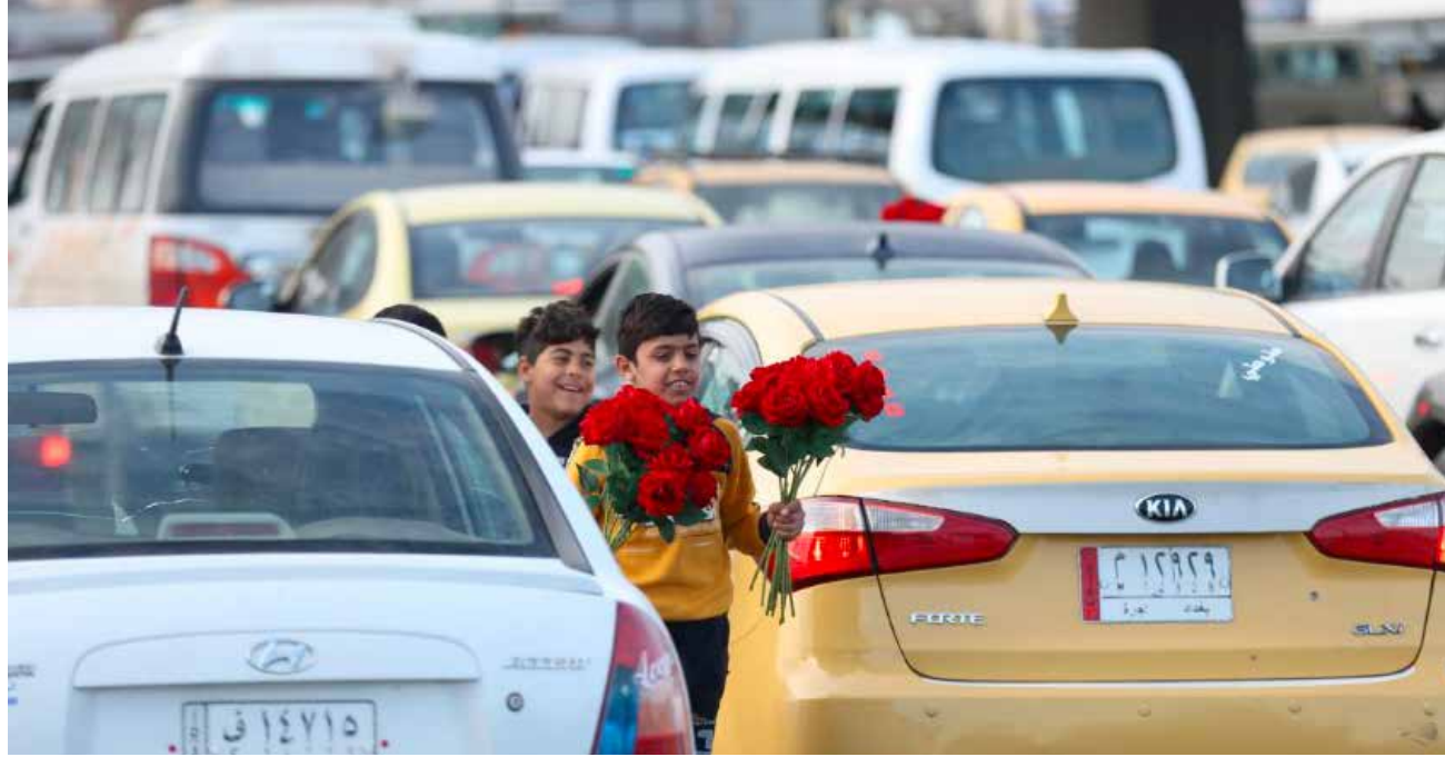
يبيعون الورود فيما أوراق طفولتهم تتساقط!

الابتدائية حين كنت في الصف الثاني كي أعمل في بيع المناديل وقناني المياه في الشارع. فأنا أحتاج إلى أن أعيل نفسي وعائلتي"، مضيفاً قوله أن "والدي يبيع الشاي والمناديل هو الآخر في الشارع، لتأمين احتياجات العائلة".