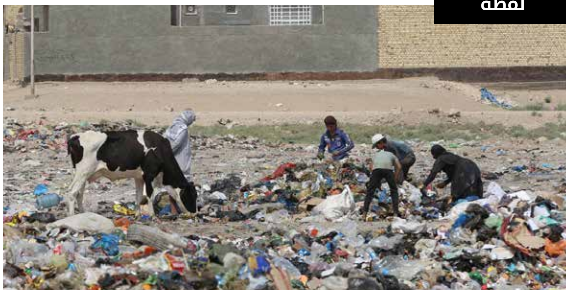
فقراء بلد الثروات يبحثون عن قوتهم في النفايات سوية مع دوابهم، بينما عبدة المناصب الفاسدون، الذين صدوا على أكتافهم، ينعمون بالعيش الرغيد والثراء الفاحش!