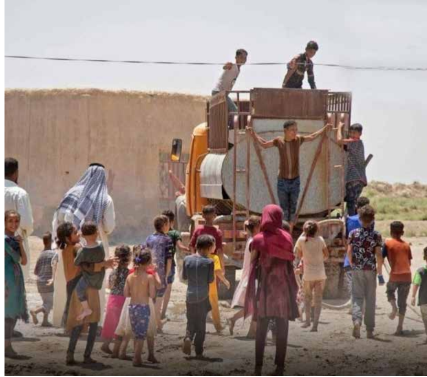
الأطفال يستقبلون بفرح السيارات الحوضية المحملة بالمياه!

يشكو كثير من المواطنين وأصحاب المحال التجارية في حي الحارثية ببغداد، وتحديداً في “شارع الكندي” والشوارع المتفرعة عنه، من قيام بعض الأشخاص وحراس المباني باستيلاء “كراجية” من أي سيارة يتم ركنها إلى جوار الرصيف. ووفقاً لما نشره أحد السكان على صفحته في “فيسبوك”، فإنه ما أن يركن أحدهم مركبته في الشارع حتى يأتيه شخص يطالبه بـ “الكراجية”، متسائلاً: “هل أصبح الشارع العام ملكاً شخصياً؟“. وبسبب عدم توفر أماكن نظامية مخصصة لوقوف السيارات، يضطر المواطنون إلى ركن مركباتهم في الشوارع وعلى الأرصفة، سيما في المناطق التجارية وأماكن تواجد العيادات الطبية مثل “شارع الكندي”، ما فسح المجال أمام البعض لاستغلال هذا الأمر في استيلاء الأموال من الناس، عبر عزل جانب من الشارع وتحويله إلى ما يشبه كراجات الوقوف المؤقت!