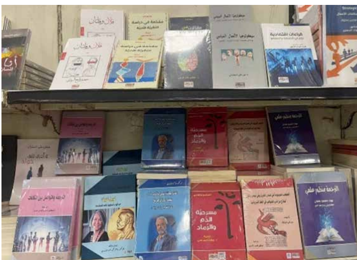
من ترجمات الجمعية في معرض عتبان للكتاب مطلع أيلول الجاري

كالتى تتناول التراث العراقي، مثل كتاب (صور بغدادية) للرخالة الإنكليزية فريا ستارك.