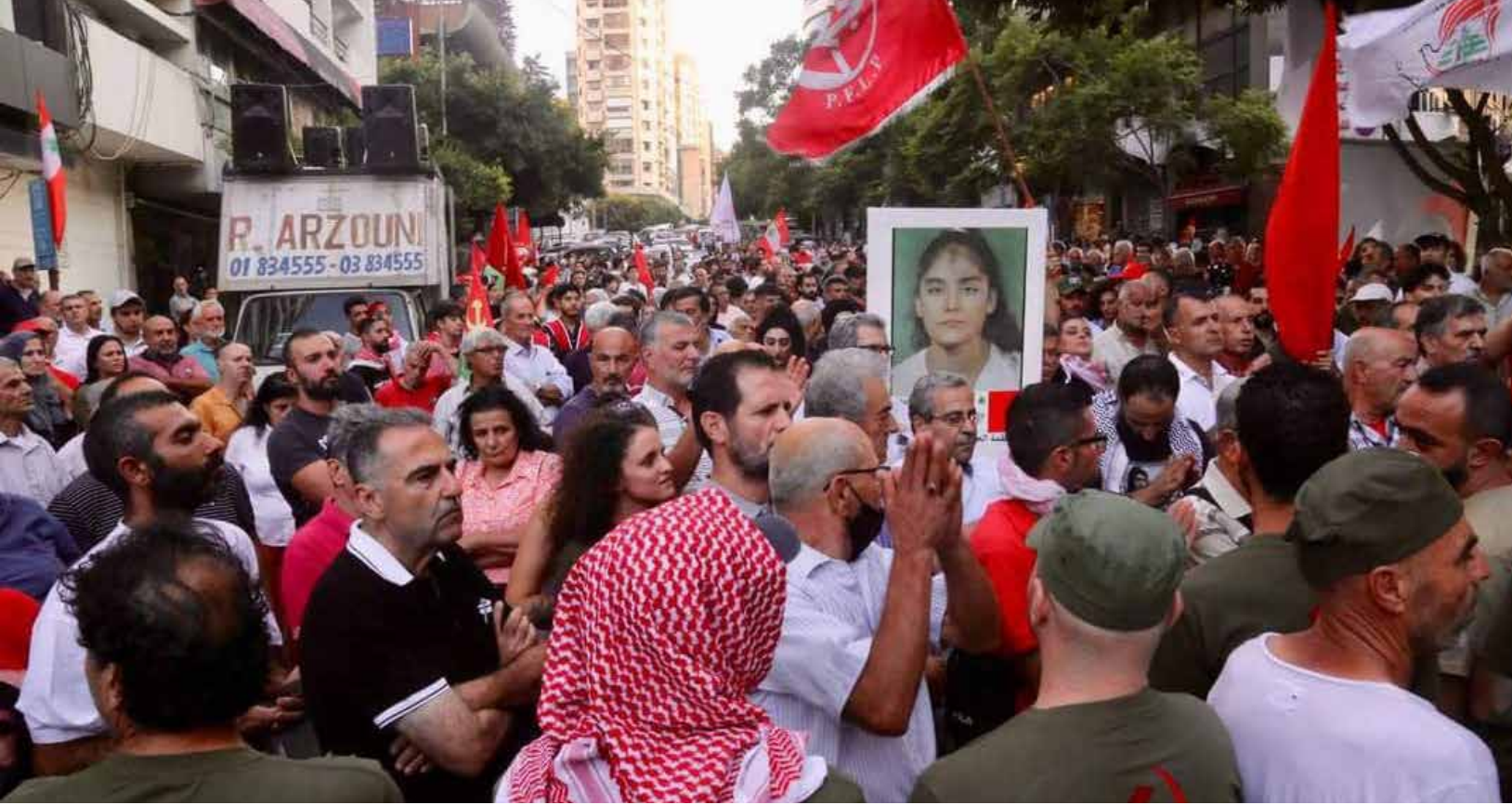
مشاركة جماهيرية في مهرجان احياء الذكرى

بيروت - وكالات أحيا الحزب الشيوعي اللبناني، أمس الأول، الذكرى الأربعين لانطلاق «جمول» المقاومة الوطنية اللبنانية - جمول» ضد الاحتلال الإسرائيلي في عام 1982. ونظم الحزب مهرجاناً أمام صيدلية بسترس - الصنائع في ذكرى التأسيس وتكريماً للمقاوم الراحل مازن عبود، مطلق الرصاصات الأولى على قوات الاحتلال الإسرائيلي في بيروت. وقد كانت كلمة لرئيس الحزب حنا غريب، تلتها مسيرة إلى مكان استشهاد المقاومين جورج قصابي ومحمد مغنية في محلة الوردية في الصحرار. وفي بيان للمكتب السياسي، قال الحزب إن «أربعين عاماً مضت منذ تلك الرصاصات المباركة، والعدو لا يزال ينتهك برزنا وبحرنا وسماءنا، فيما نظامنا السياسي يتخبط في التفاوض والذي يبدو كشكل من أشكال التطبيع، وبواسطة راعي الإرهاب الدولي الولايات المتحدة الأميركية». وأكد الحزب أن «المعركة لم تنته بعد. فخيّار التمسك بالمقاومة طريقاً للتحرير والتغيير هو الخيار الوحيد المتاح والمجدي. فالمعركة واحدة بين دحر الاحتلال وإسقاط النظم التابعة،