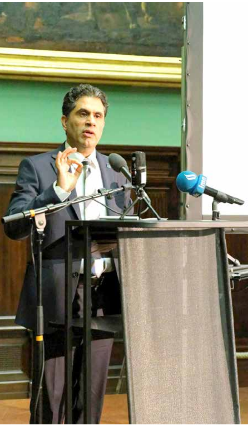
الاكاديمي سعد سلوم

يشار الى ان سلوم هو أول مثقف عراقي يحصل على جائزة ابن رشد للفكر الحر والتي انطلقت عام 1999 في العاصمة الألمانية برلين، بمناسبة مرور ثمانية قرون على وفاة الفيلسوف ابن رشد. وسبق أن فاز بها أبرز المفكرين العرب مثل محمد عبد الجابري وسمير أمين ونصر حامد أبو زيد ومحمد أركون. وهي الجائزة الرابعة التي يحصل عليها الاكاديمي والمثقف العراقي بعد نياله جائزة تحالف ستيفانوس الدولية في أوسلو عام 2018 وجائزة البرطيركية الكلدانية وجائزة كامل شياح لثقافة التنوير.