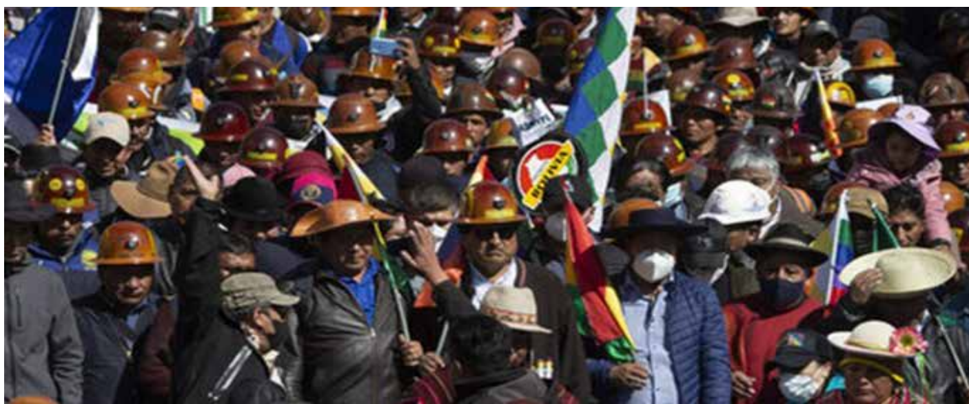
جانب من المسيرة المدافعة عن الديمقراطية

تمتلك بوليفيا أكبر احتياطي لمعدن، الليثيوم المكتشف في العالم، والتي تقدر بقرابة 21 مليون طن. ويدخل هذا المعدن الثمين في العديد من الصناعات الالكترونية والمعدنية، و بينما تحاول الحكومة الاستفادة من المعدن لتطوير الصناعات المحلية، وافتتحت قبل أسابيع قليلة أول مصنع إنتاج لبطاريات الليثيوم، تريد الولايات المتحدة، بشكل خاص، وكذلك الاتحاد