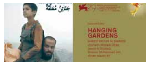
ملصق فيلم "جنائن معلقة"