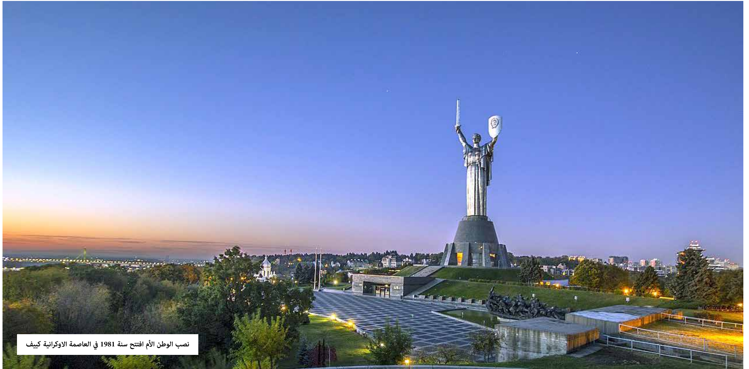
نصب الوطن الأم افتتح سنة 1981 في العاصمة الأوكرانية كييف