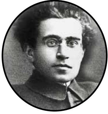
انطونيو غرامشي (1891-1937)

منظر ماركسي معروف ومؤسس الحزب الشيوعي الإيطالي. في عام 1928 أصدرت محكمة فاشية في إيطاليا حكمها على غرامشي بالسجن عشرين عاماً بسبب نشاطاته الثورية. لعب غرامشي دوراً بارزاً في كشف النزعة الآلية والأساس الإيديولوجي للانحراف اليميني، كما كرس جهده لدراسة مشكلات المادية التاريخية وشغف بعلم الجمال وعلم الاجتماع وتاريخ الفلسفة.... الخ. وقد تناول غرامشي مسألة علاقة القاعدة بالبناء الفوقي والبروليتاريا بشرية المثقفين، كما تناول مسألتها الثقافية ودور الإيديولوجية في البنية الاجتماعية-الاقتصادية. وطبعاً لا يمكن فهم موقف غرامشي بإعطائه أهمية أساسية للمستوى الإيديولوجي في البنية الاجتماعية - الاقتصادية من دون ربط ذلك بالظروف التاريخية التي كانت سائدة آنذاك في أوروبا الغربية بفعل ابتعاد أفق الثورة الاجتماعية. فقد اعتقد غرامشي أن المشكلات "الثقافية" هي مشكلات ذات أهمية خاصة في مراحل تطور النشاط الثوري، كما في أوروبا 1815، ثم ثانية بعد عام 1921. ويقول إنه في مثل هذه الأوقات لا تكون هناك معارك مباشرة بين الطبقات، ويتحول الصراع الطبقي إلى "حرب مواقع"، وتصبح "الجبهة الثقافية" هي الميدان الرئيسي للنزاع (غرامشي، حياته وأعماله ص 253).