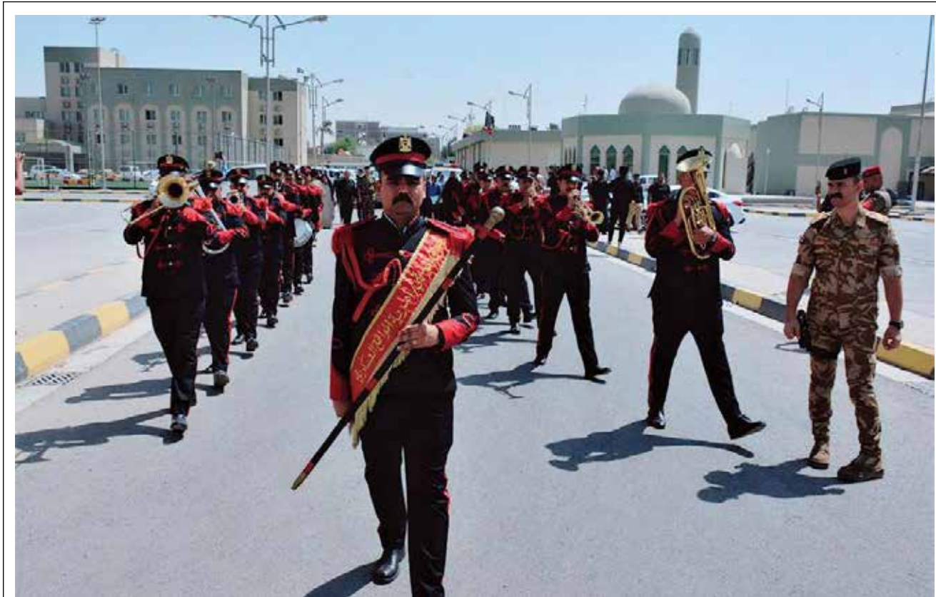
وزارة الدفاع شيعت يوم امس رفات 26 شهيداً من مجزرة سبايكر .. متى يحاكم من تسبب بهذه الجريمة ؟

أثارت فضيحة الفيديو المسرب لوزير سابق، وهو يؤدي القسم أمام زعيم كتلة سياسية ويعدده بالطاعة وتسخير الوزارة لخدمته، استياء شعبياً واسعاً وتنديدات بالفساد الذي انتجته منظومة المحاصصة الطائفية.