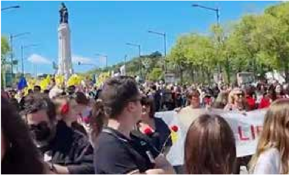
مسيرة الشيوعي البرتغالي احتفالاً بالذكرى 48 لثورة القرنفل نيسان 2022

ان الوضع المكشوف جدا، شكل مناسبة لسلسلة من تبريرات جديدة بشأن تراكم الأرباح نتيجة للاستغلال المتزايد والمضاربة المتفشية. إن ادعاء أحد أكبر المصرفيين بأن هناك "عداء ثقافياً لرأس المال وتراكمه" أو الاتهام