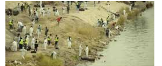
متطوعون في الحملة ينظفون ضفاف دجلة في بغداد