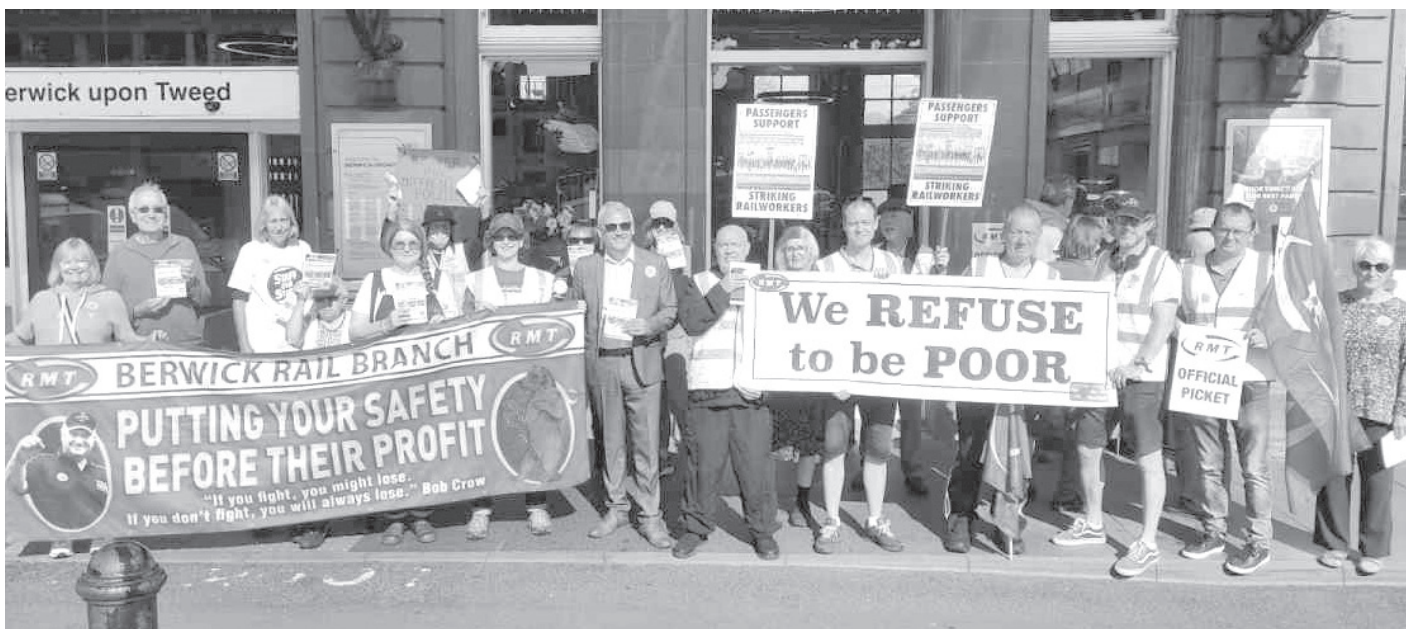
جانب من اعتصام عمال السكك الحديدية البريطانية

إذا كان انخفاض القيمة الحقيقية للأجور هو الذي يسبب موجة الإضرابات، فإن ارتفاع أسعار المواد الغذائية والطاقة والوقود، وارتفاع التضخم الآن إلى أكثر من 9 في المائة يثقل جيوب البريطانيين، مقابل تراجع الدخل الحقيقي. وفقاً لهيئة الإحصاء الوطنية، انخفضت الأجور الحقيقية بمعدل 2,8 في المائة في الربع مقارنة بالعام السابق، ولم يحدث أن انخفضت