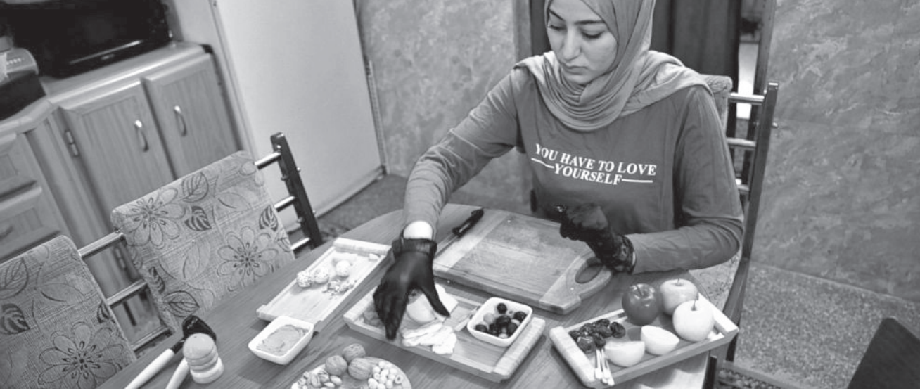
مواطنة عراقية تجد فرصة عمل من خلال بيع الأطعمة