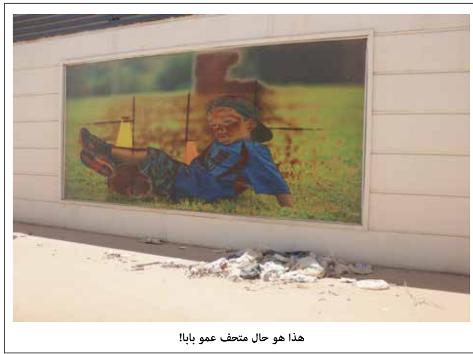
هذا هو حال متحف عمو بابا!

واضاف في حديثه لـ"طريق الشعب"، ان "تظاهرة الجمعة ليست جديدة فقوى التغيير منذ 2011 تنظم تظاهرات، وترفع شعارات ضد المحاصصة"، مؤكداً ان هذه التظاهرة "ليس لها علاقة باي طرف وتحمل شعار التغيير من أجل مصلحة الشعب والوطن، وان قوى التغيير لديها بالفعل موقف واكدت على انها ليست جزءاً من هذا الصراع".