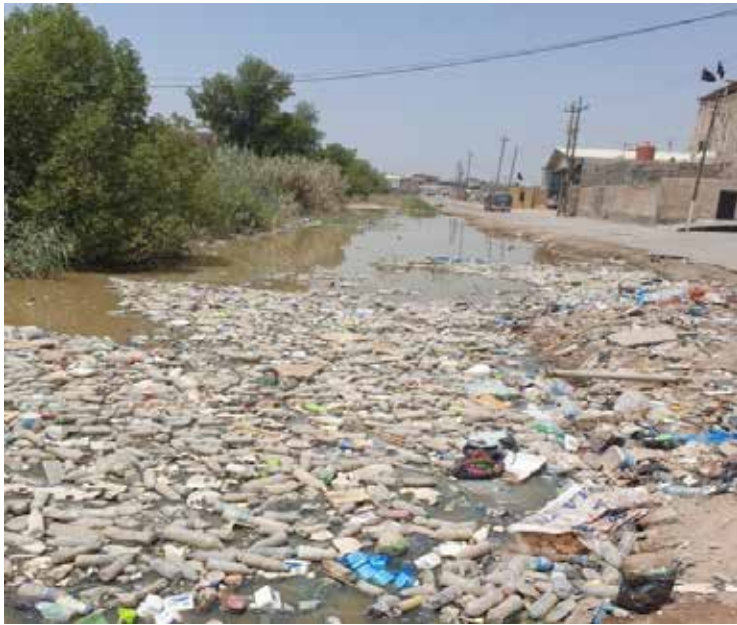
سابقاً "نهر جلاب" واليوم مكب نفايات!

بعد اختناقنا بالأزبال، أو غطت المنازل المتجاوزة أجزاءً منهم! ماذا لو أقدمت الجهات المعنية على إطلاق حملة كبرى لكري هذه الأنهر وتظيفها ورفع التجاوزات عنها!؟