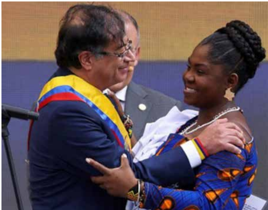
الرئيس ونائبته بعد أداء اليمين الدستوري

في خطاب التنصيب كرر الرئيس التزامه بالتغيير والوفاء بوعوده الانتخابية. وقال "اليوم فرصتنا الثانية". وأضاف "حان وقت التغيير". في البداية اقتبس من رواية "100 عام من العزلة" لغابرييل غارسيا ماركيز: "كل ما كتب فيه كان صالحاً إلى الأبد، لأن أولئك الذين حكم عليهم مئة عام من العزلة لم يكن لديهم فرصة ثانية على الأرض". وأضاف: "مرات عديدة في تاريخنا، حُكم على الكولومبيين بعدم الحصول على الفرص. أريد أن أقول بصوت عالٍ للجميع أن اليوم هي فرصتنا الثانية. اليوم تبدأ كولومبيا الممكن. نحن هنا ضد كل الصعاب، ضد تاريخ يقول إننا لن نحكم أبداً، وضد أولئك الذين فعلوا ذلك دائماً، أولئك الذين لن يتخلوا عن السلطة (ما نظيفاً). لكننا فعلنا. جعلنا المستحيل ممكناً. بدءاً من اليوم، نعمل على جعل المزيد من الأشياء المستحيلة ممكنة. وتناول الرئيس أولوياته الأساسية، كالتطبيق الكامل لاتفاقية السلام مع الحركة المسلحة في البلاد "السلام هو حياتي"، والعمل الحربي بنصائح "لجنة الحقيقة"، ومكافحة المخدرات، والحفاظ على البيئة، والدفاع