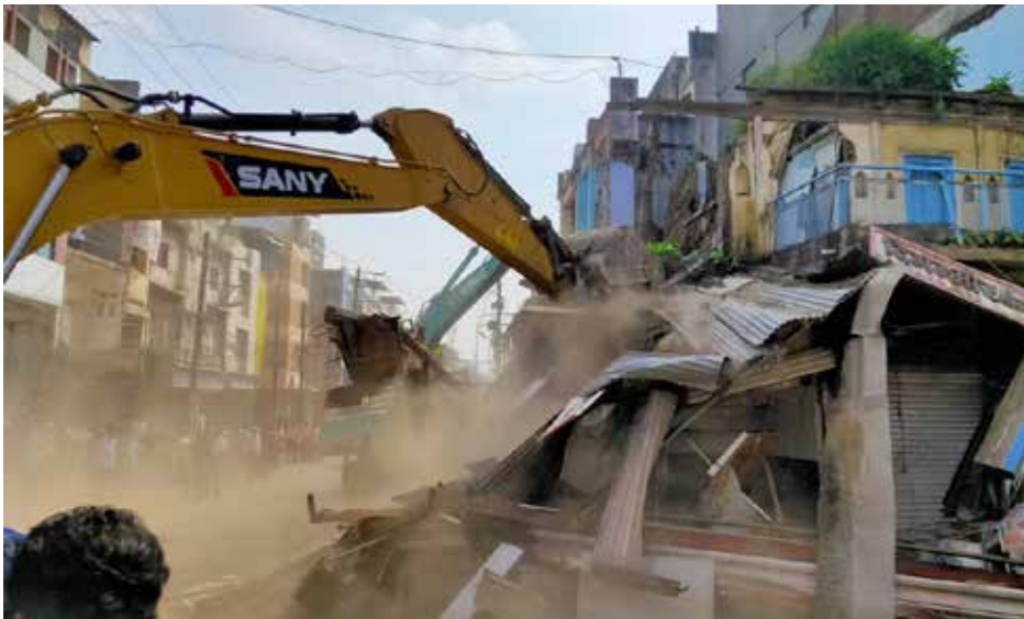
جرافات الحكومة العنصرية تهدم بيوت الفقراء