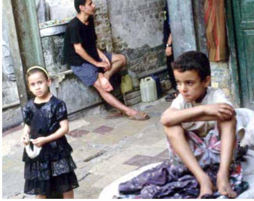
الفقراء هدف سهل للعصابات الاجرامية

تفاقمت في العراق خلال الفترة الأخيرة ظاهرة الاتجار بالأعضاء البشرية. ويأتي هذا جراء تفاقم الأزمت المعيشية والاجتماعية والاقتصادية، وفي مقدمتها معضلة ارتفاع نسب الفقر. وتحولت عمليات الاتجار بالأعضاء البشرية مع مرور الوقت إلى ظاهرة، ارتباطاً بانتشار العصابات المتخصصة فيها، مقابل استعداد الكثيرين من المواطنين لبيع بعض أعضائهم في سبيل مواجهة تدهور أوضاعهم المعيشية. وكشفت تقرير نشره مجلس القضاء الأعلى في 26 تموز الماضي، عن اعتقال عصابة تقودها امرأة، كانت قد نفذت نحو 250 عملية اتجار بالأعضاء البشرية من خلال شبكات التواصل الاجتماعي. ونقل التقرير عن اعترافات العقل المدبر والمعتقلين الآخرين، أن "العصابة تشكلت عام 2017، وضمت خمسة أشخاص أنشأوا صفحات على مواقع التواصل الاجتماعي، ونفذوا عبرها مهام لاسدراج أشخاص للترع بأعضائهم مقابل مبالغ مالية كبيرة، ثم بيعها".