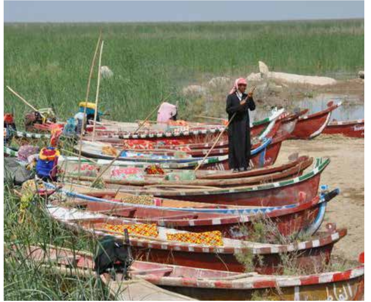
هل تخرج اهورانا من لائحة التراث العالمي بعد 6 سنوات على ذلك؟