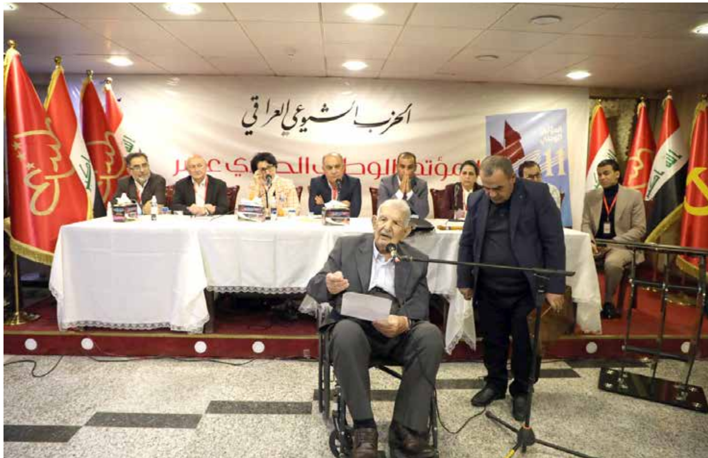
ثناء مشاركة الرفيق كريم أحمد في المؤتمر الوطني الـ 11 للحزب الشيوعي العراقي

من جانبه، بعث محمود العكلي، الأمين العام لحزب الأمة العراقية، برقية تعزية. وقال العكلي: "ببالغ الحزن والأسى تلقينا نبأ وفاة الشخصية الوطنية المدنية سكرتير الحزب الشيوعي العراقي والكرديستاني الأسبق (الاستاذ كريم أحمد). كان مناضلاً شجاعاً قارع النظام البعثي الصدامي المجرم وكانت مواقفه الوطنية هي دليل واضح على الانتماء إلى العراق وشعبه الصابر. أتقدم بخالص التعازي القلبية الصادقة إلى الأخوات والأخوة في الحزب الشيوعي العراقي والصبر والسلوان إلى عائلة الفقيه ولروحه السلام".