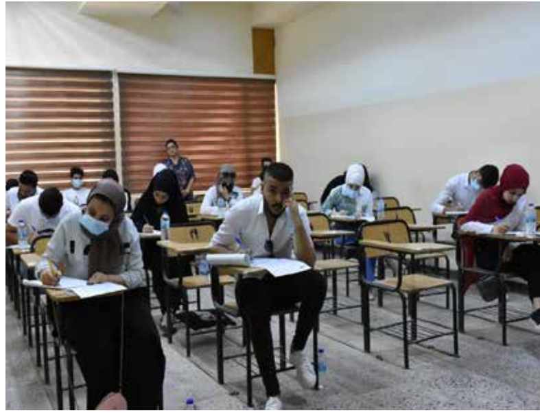
جانب من امتحانات كلية الاعلام في جامعة بغداد

يصطدم خريجو كليات الإعلام من الجامعات الاهلية والحكومية بواقع مؤلم بعد مغادرة كراسي الدراسة حاملين معهم شهادات البكالوريوس، لأن أغلب ما كان يتلقونه من دروس ومحاضرات، لا تصنع منهم إعلاميين مؤهلين للعمل في المؤسسات المعنية، وبالتالي يضطر كثير من الطلبة الى البحث عن فرصة عمل، بعيداً عن مجال تخصصه.