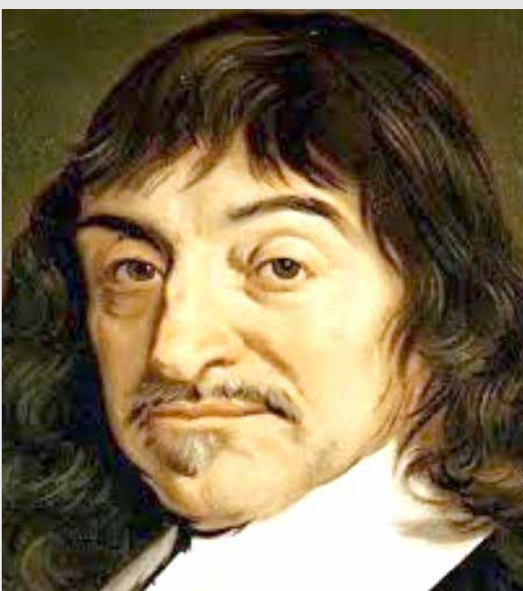
اعداد: د. صالح ياسر