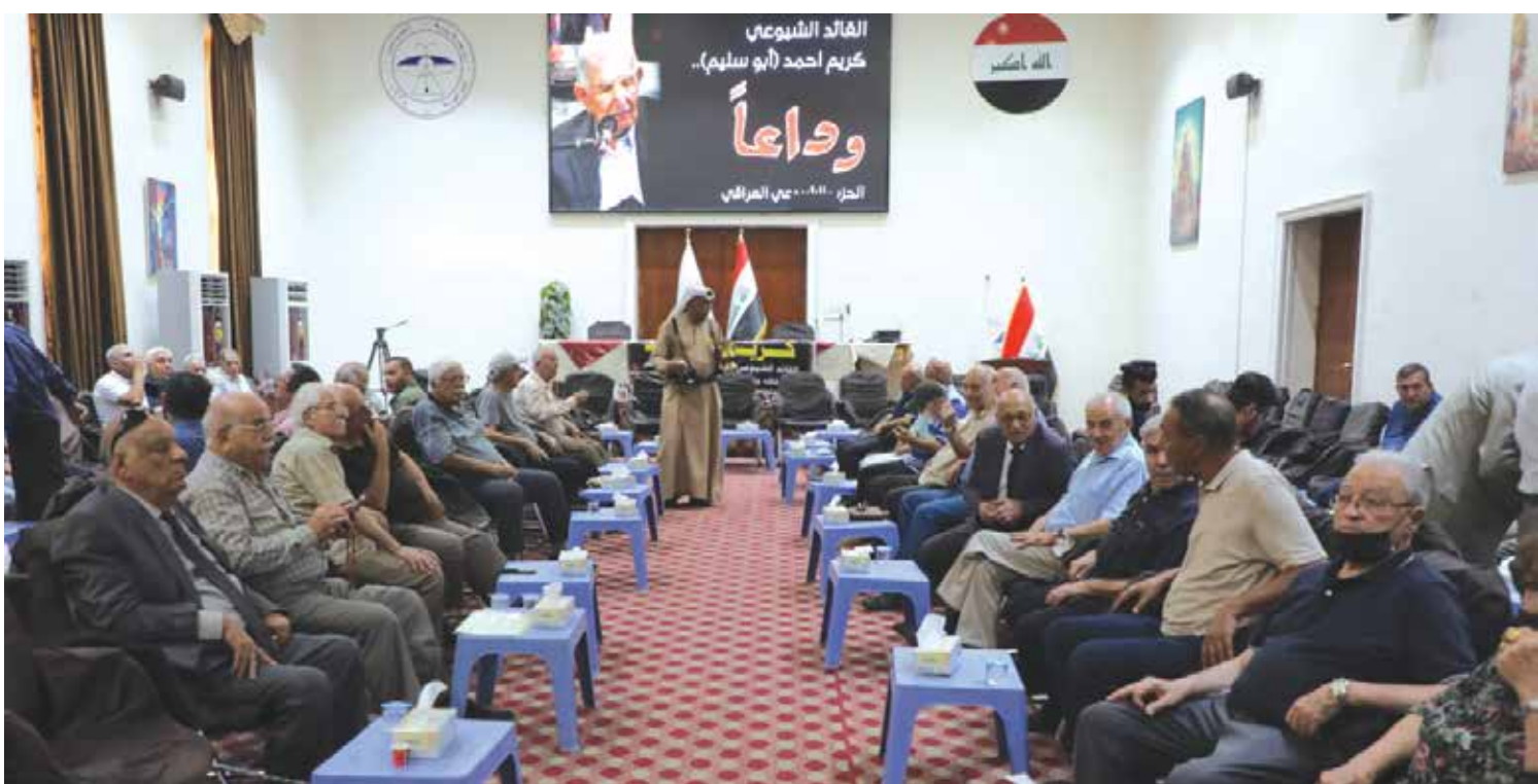
جانب من مجلس عزاء القائد الشيوعي الراحل الرفيق كريم احمد الذي اقامته اللجنة المركزية للحزب الشيوعي العراقي يوم امس في بغداد

المهموم على الدوام بقضايا الوطن والشعب على اختلاف اطيافه المتأخية، مساهمًا نشطًا في النضال الوطني والطبقي، وفي حركة الأنصار الباسلة. في مسيرته النضالية الحافلة بالبطء تباين جدارته ومواقف قيادية في الحزب الشيوعي العراقي، وفي الحزب الشيوعي الكردي، وكان على الدوام قدوة في التواضع وتكران الذات، ومثالاً يحتذى في الصمود والتحدى، ومقارعة الأنظمة الدكتاتورية والرجعية وسلطة الاقطاع، مناضلاً ثابتاً من اجل التحرر الوطني والاستقلال الناجز وبناء العراق الديمقراطي الذي يتسع لمواطنيه كافة، بعيداً عن الظلم والاستغلال والاضطهاد والقمع.