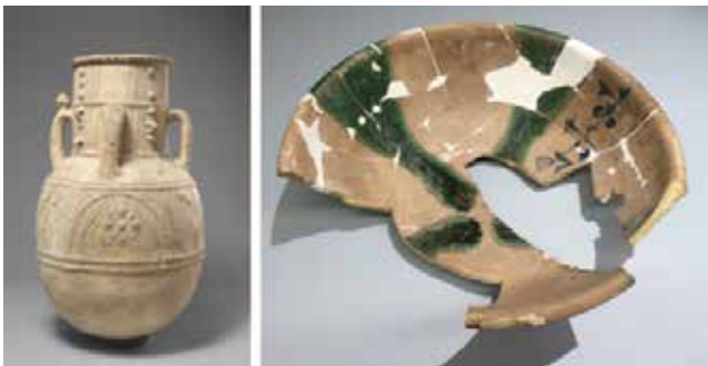
صحن وجرة من القرن التاسع الميلادي مكتشفان في سلمان باك

الصحن منتوج عراقي دون شك، ذلك أن تقنية الطلاء ذي البريق المعدني البراق هي من إضافات الخزافين العراقيين في العصر العباسي كما أن نقشه ولونه هي من النقوش العراقية التي كانت تقلد في البدء نقوش الخزف الصيني المعاصر.