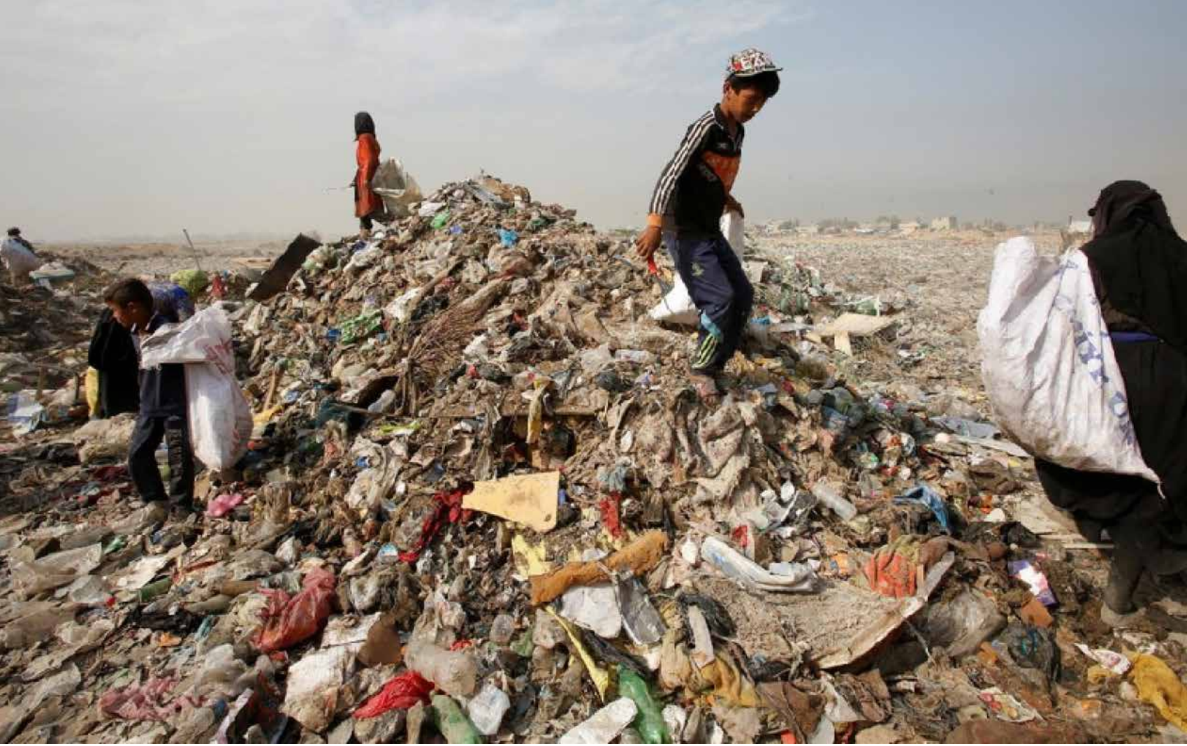
غياب الإرادة وسوء الإدارة والفساد عوامل تعرقل مشروع تحويل النفايات الى كهرباء

التلوث، منوهاً إلى أن الحكومة تتجه صوب استخدام الطاقة النظيفة من خلال القروض التي منحها لتشجيع المواطنين على استخدام الطاقة الشمسية. واستغرقت مجيد من عودة الحديث عن الموضوع مجدداً في ظل تأكيدات الحكومة في أكثر من مرة على موضوع التلوث البيئي، مستبعدة قدرة العراق على تلبية هذه الشروط الصارمة. وإلى جانب الأسباب المعرقله لتنفيذ المشروع التي ذكرها المتحدثون في أعلاه، هناك تحديات أخرى مثل عملية نقل النفايات إلى أماكن الفرز بحسب نوعيتها، ومن ثم إلى معامل الحرق، حيث لا يمكن استخدام الزجاج والمعادن ومواد البناء في توليد الطاقة.