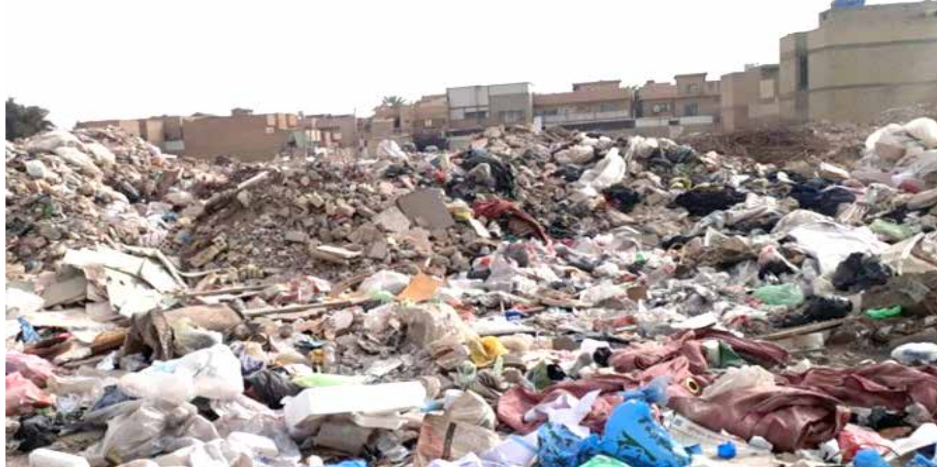
مكب نفايات بين المنازل في الشعلة

ولم يكن الحال في مدينة الحرية أفضل مما في مدينة الشعلة. ففي هذه المدينة ذات المساحة الكبيرة والكثافة السكانية العالية، يوجد نقص واضح في الخدمات البلدية، وضعف في البنية التحتية. يقول أبو حيدر، أحد سكان المدينة، أن معظم شوارعهم وأزقتهم، خاصة في حي "دار الشؤون"،