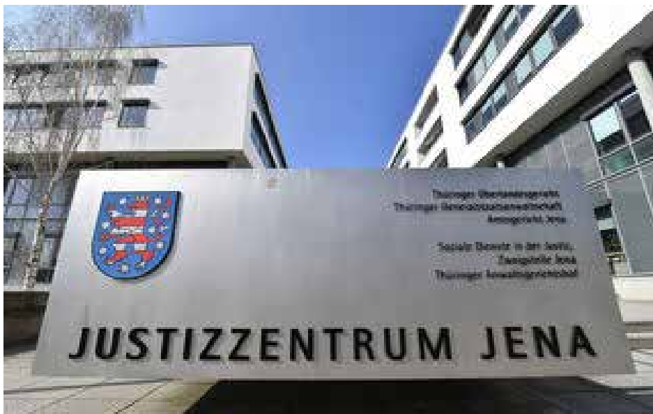
المركز القضائي في مدينة ينا في شرق المانيا

النشر من الألمان الشرقيين 20، مقارنة بـ 9 في المائة عام 2016. وهناك أربعة ألمان شرقيين (31 في المائة) يقودون مؤسسات بث عامة في الشرق. ويذكر معدو الدراسة، أن الوصول المتوقع للشباب الألمان الشرقيين إلى مناصب إدارية في العديد من المجالات لم يتحقق، ودعا كارستن شنايدر، مفوض الحكومة الاتحادية لشؤون الشرق، الذي حضر عرض الدراسة، إلى تمثيل الألمان الشرقيين بقوة أكبر في المناصب القيادية في شرق ألمانيا. وقال شنايدر المنحدر من مدينة إرفورت في شرق ألمانيا: "يتعلق الأمر بفرص المشاركة وما إذا كانت وجهات نظر وخبرات الألمان الشرقيين تؤخذ في الاعتبار في عمليات صنع القرار". وحتى الآن لم تُستغل "الإمكانات الكبيرة للألمان الشرقيين". في اتفاقية حكومة ولاية برلين المكونة من الحزب الديمقراطي الاجتماعي والخضر والحزب الديمقراطي الحر ثبت هدف تحسين تمثيل الألمان الشرقيين في المناصب القيادية وهينات صنع القرار في جميع المجالات. وأعلن شنايدر أن ائتلاف الحكومة الاتحادية، المكون من الأحزاب الثلاثة ذاتها، سيعمل على تحقيق هذا الهدف في عموم ألمانيا الاتحادية.