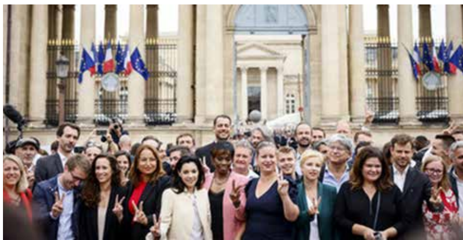
نواب تحالف اليسار امام الجمعية الوطنية في باريس يوم الثلاثاء الفائت

من أهم التغيرات في ميزان القوى البرلمانية في فرنسا هو رفع عدد نواب اليسار إلى ثلاثة أضعاف، ومساعدة بعض أطرافه على تشكيل كتلها البرلمانية المستقلة. ضم تحالف اليسار حركة فرنسا الآبية بزعامة ميلونشون، وحزب الخضر الفرنسي، والذي على عكس شقيقه الألماني لا يزال يتبنى سياسات يسارية، ولم يجد ما يمنح وجوده في تحالف انتخابي يضم الشيوعيين أيضاً، والحزب الشيوعي الفرنسي، وأكثرية ما تبقى من الحزب الاشتراكي.