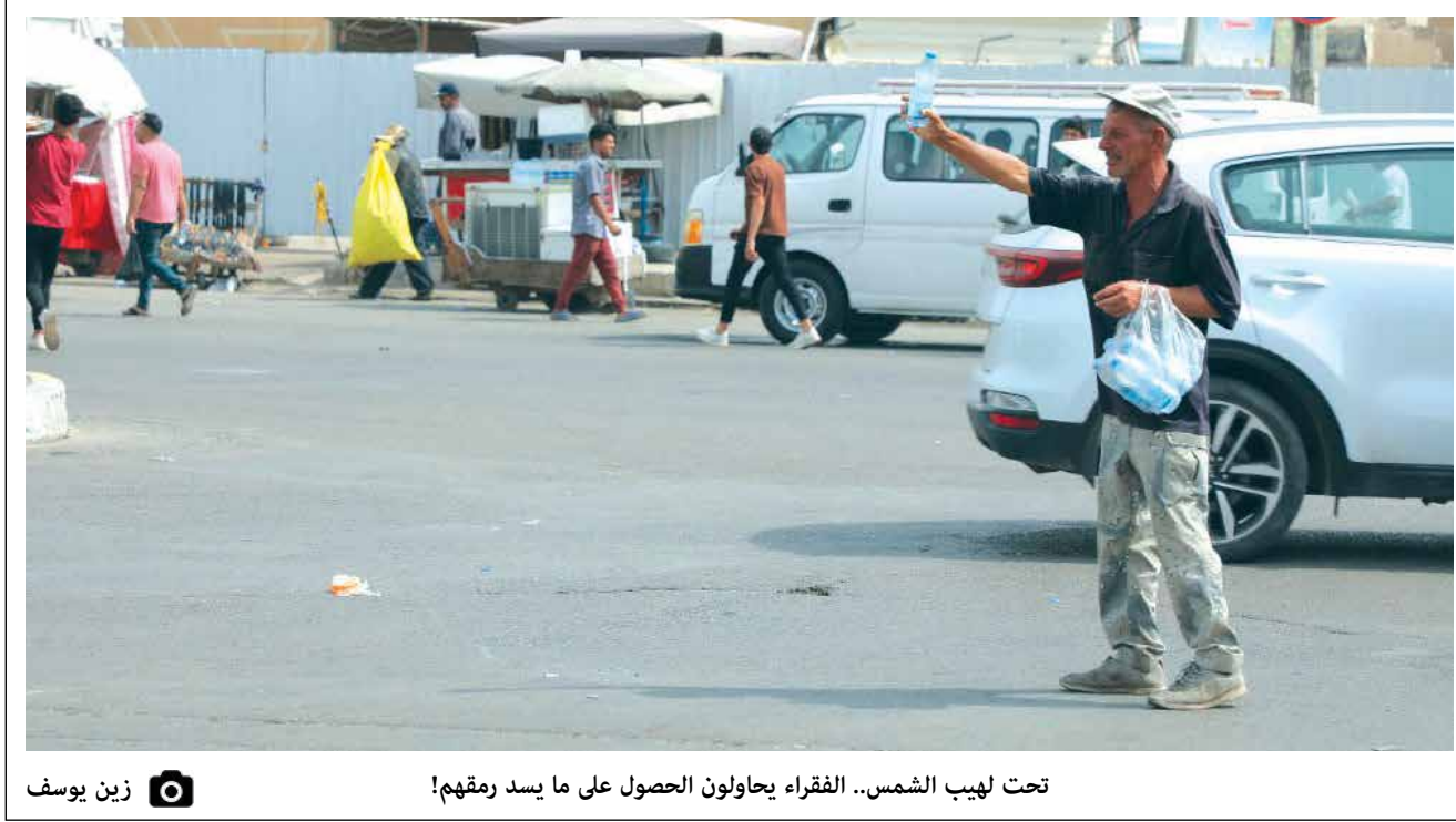
تحت لهيب الشمس.. الفقراء يحاولون الحصول على ما يسد رمقهم! زين يوسف

تصريحات كثيرة يصدرها قادة كتل نيابية وسياسية متنفذة، داخل مجلس النواب وخارجه بشأن ضرورة حل البرلمان لنفسه والتوجه لإعادة الانتخابات.