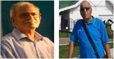
الدكتور هاشم كماش الرفيق سعدي اللبان

معاً حتى يكتمل بناء بيت الشيوعيين.. بيت العراقيين.