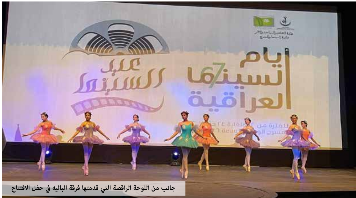
جانب من اللوحة الراقصة التي قدمتها فرقة الباليه في حفل الافتتاح