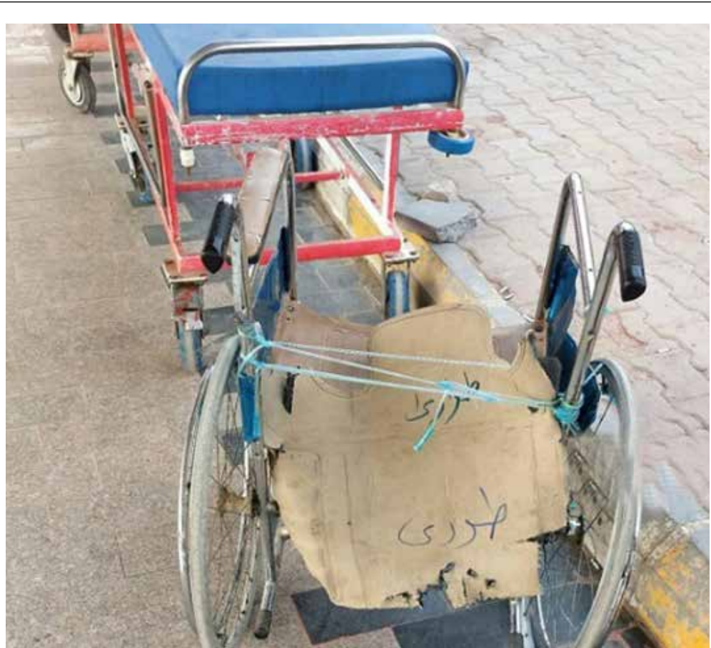
بيدو الكرسي الوحيد متهاكلاً!

الكارب اختفت والبني والقطان في طريقهما للمصير ذاته". وتابع في حديث صحفي قائلاً، أن "الكثير من أنواع الأسماك اختفت من شط العرب بسبب شدة الملوحة وشح المياه في نهري دجلة والفرات وارتفاع درجات الحرارة". وأشار عبد الرزاق إلى أن حل هذه المشكلة يتوقف على قيام وزارة الموارد المائية بزيادة إطلاقات المياه.