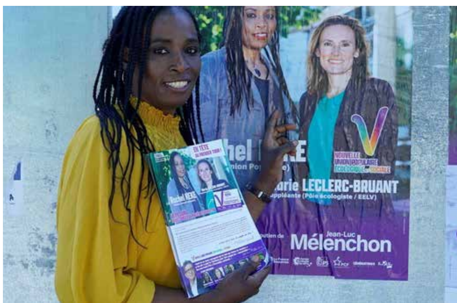
راشيل كيكى عاملة النظافة اليسارية التي هزمت وزيرة فرنسية وشغلت مقعدها في الجمعية الوطنية الفرنسية!

وبعيدا عن هذه الحقيقة، عملت وسائل الاعلام التقليدي على تسليط الضوء على نجاح اليمين المتطرف، في محاولة منها، ضمن أمور أخرى، للتغطية على عودة اليسار القوية والتي لم تكن في الحسبان، قبل شهرين. إن خطورة نجاح اليمين المتطرف تكمن في الزخم الذي سيكسبه متطرفو أوروبا عموما بسببه، بالإضافة الى الدور المؤثر الذي ستلعبه كتلة بهذا الحجم في الجمعية الوطنية الفرنسية. إن إمكانية تعاون تيارات اليمين المتنوعة، لمواجهة صعود اليسار امر وارد جدا، وبالتالي فان يسار الجمعية الوطنية الفرنسية لا غنى له عن تفعيل عمله المشترك مع النقابات العمالية والحركات الاجتماعية خارج البرلمان.