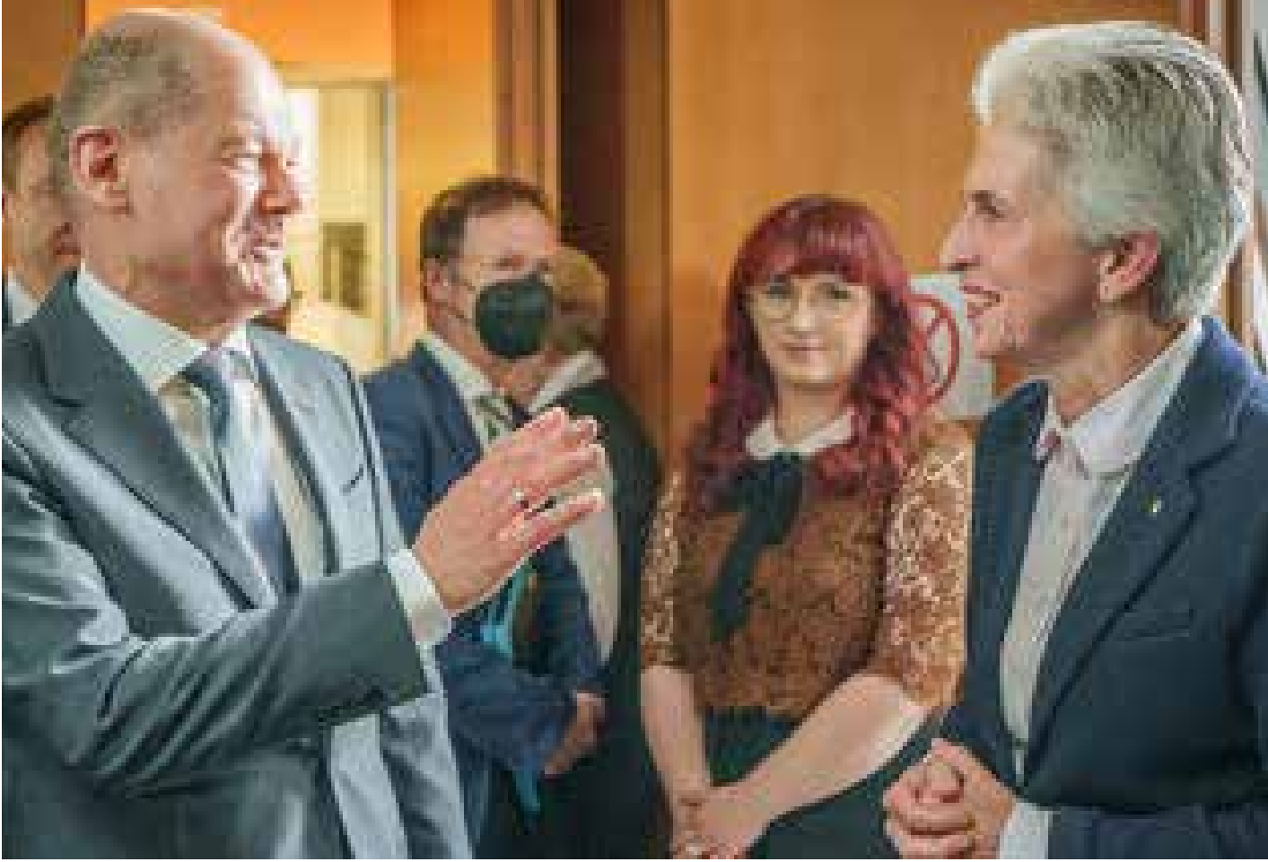
المستشار الألماني سولز وأعضاء لجنة الدفاع في البرلمان في 13 أيار 2022