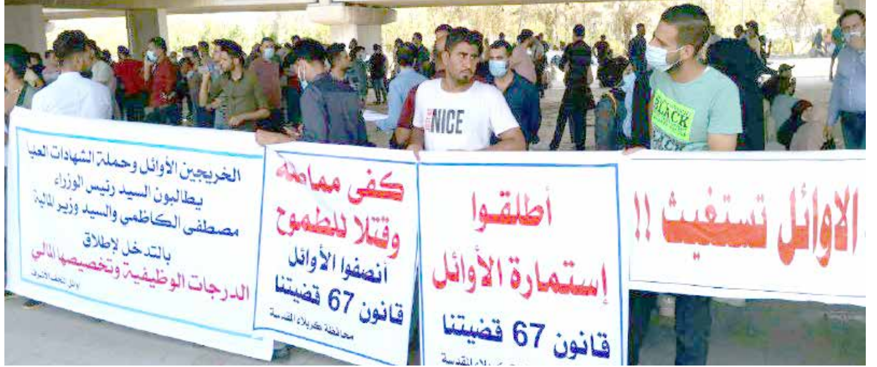
تظاهرة سابقة للخريجين الأوائل