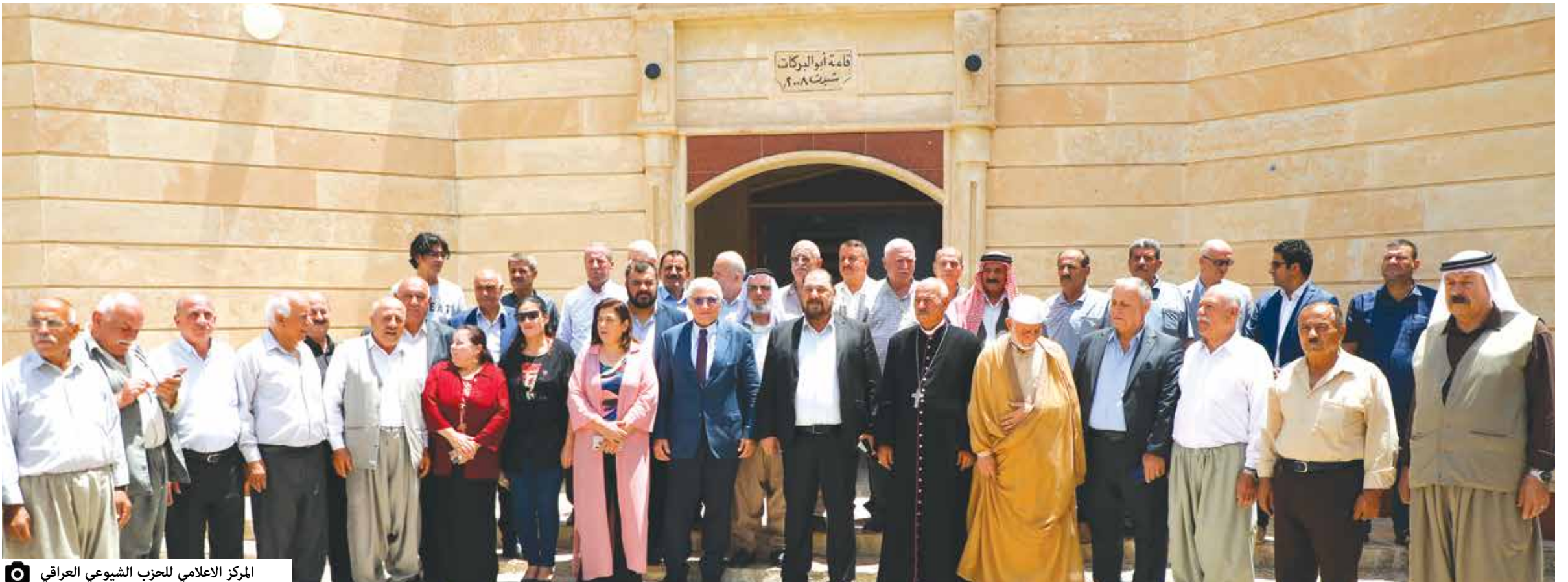
المركز الاعلامي للحزب الشيوعي العراقي