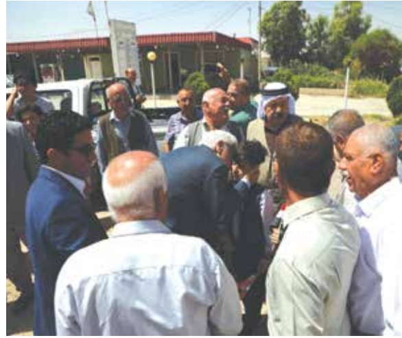
استقبال وفد الحزب قرب سيطرة بعشيقه الرئيسية