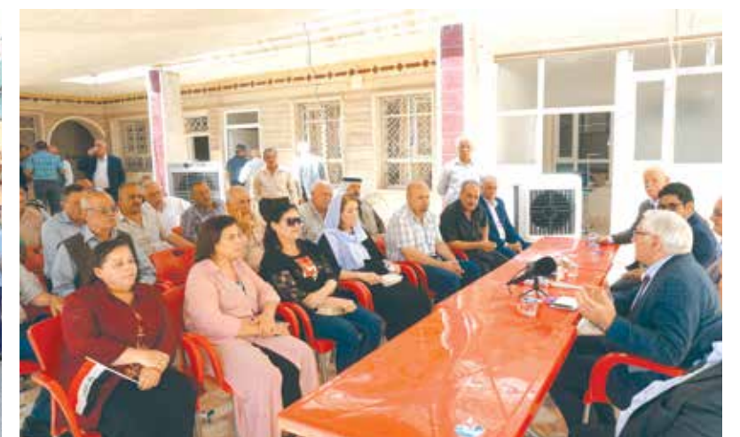
ندوة سياسية في مقر الحزب ببعشيقه