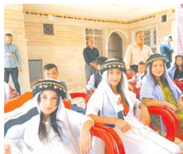
جانب من استقبال وفد الحزب في بعشيقه