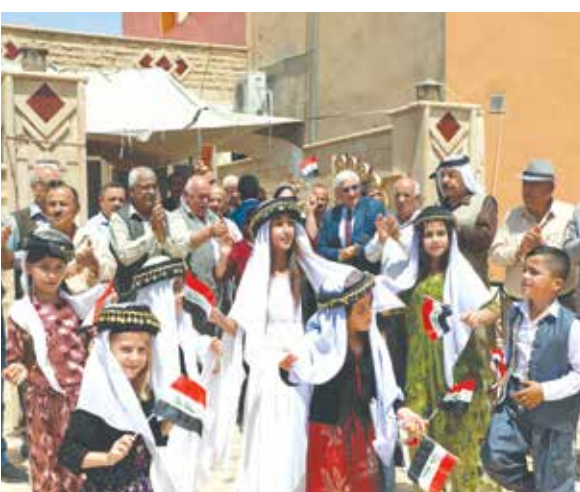
حفاوة الاستقبال في بعشيقه