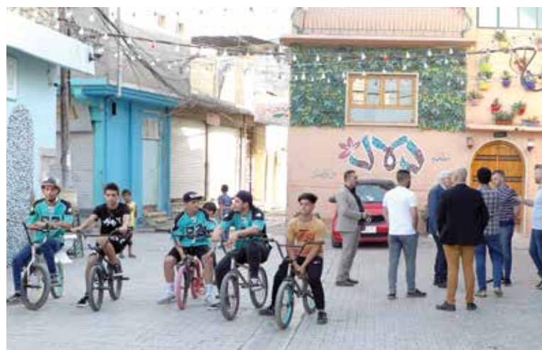
زقاق في مدينة الموصل القديمة بعد اعادة اعماره