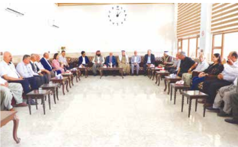
وجوه اجتماعية وشخصيات مدنية تستقبل وفد الحزب في قاعة بحزاني للمناسبات