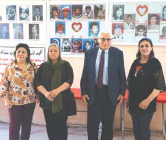
مع مجموعة من الرفيقات في مقر الحزب ببغداد