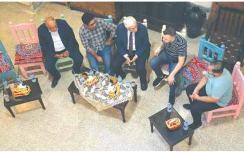
حديث عن نشاطات الشباب في مؤسسة بيتنا في الجانب الايمن من الموصل