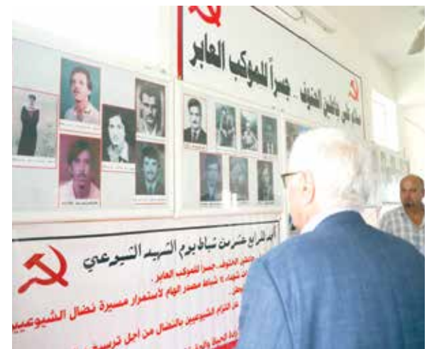
شهداء الحزبين الشيوعيين العراقي والكرديستاني في بحزاني