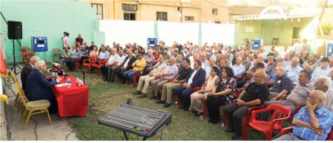
جانب من الندوة الجماهيرية التي عقدها محلية نينوى في نادي ألقوش العائلي