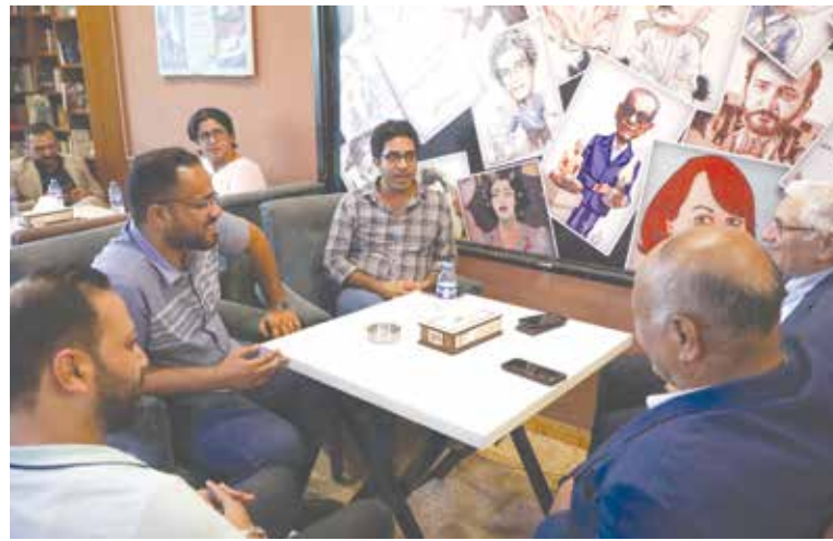
نقاش سياسي مع الشباب في مقهى ملتقى الكتاب بالمجموعة الثقافية