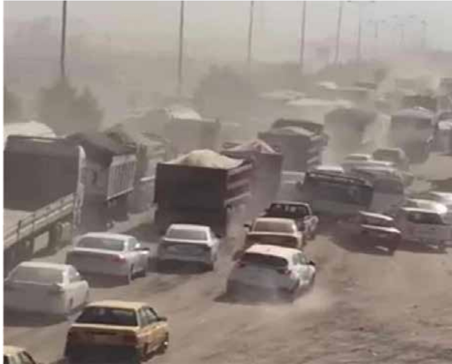
مدخل لبغداد.. أم ساحة حرب!

ويؤكد الخالدي أن «المسؤولية تقع على عاتق الحكومات المتتابعة التي حكمت البلاد، وأحزاب السلطة المنتفذة»، متسائلاً: «أين تذهب أموال البلد؟