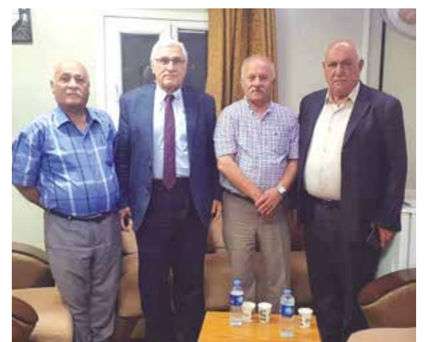
مع الهيئة الادارية لنادي ألقوش العائلي