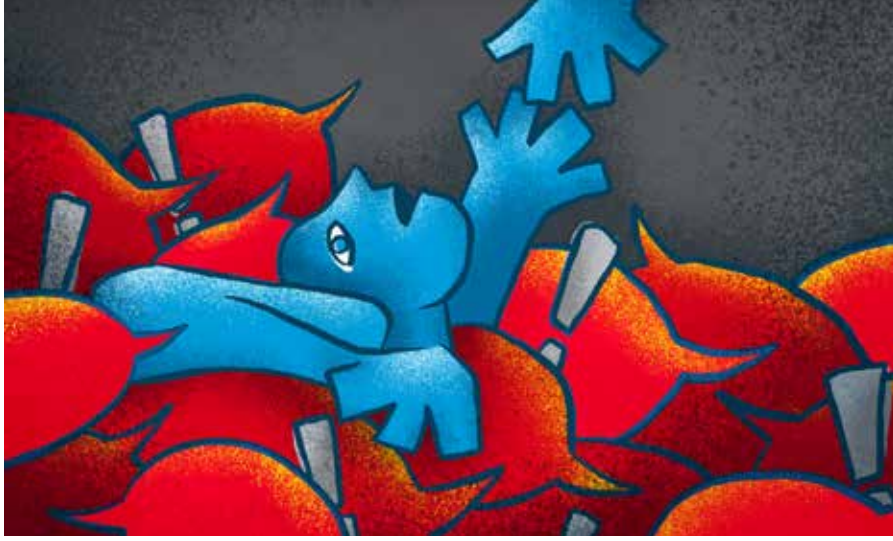
ملصق لمواجهة خطاب الكراهية نشره موقع منظمة الامم المتحدة في المناسبة

الإعلاميين، والفنيتين الاخيرتين تمثلت بالنخب الأكاديمية ورجال الدين، الأمر الذي يعكس أهمية استهداف الفئة الأولى كون منصات التواصل الاجتماعي مثلت المنصات التي انطلقت منها غالبية خطابات الكراهية المستخدمة من قبل جميع الفئات التي تم استهدافها.