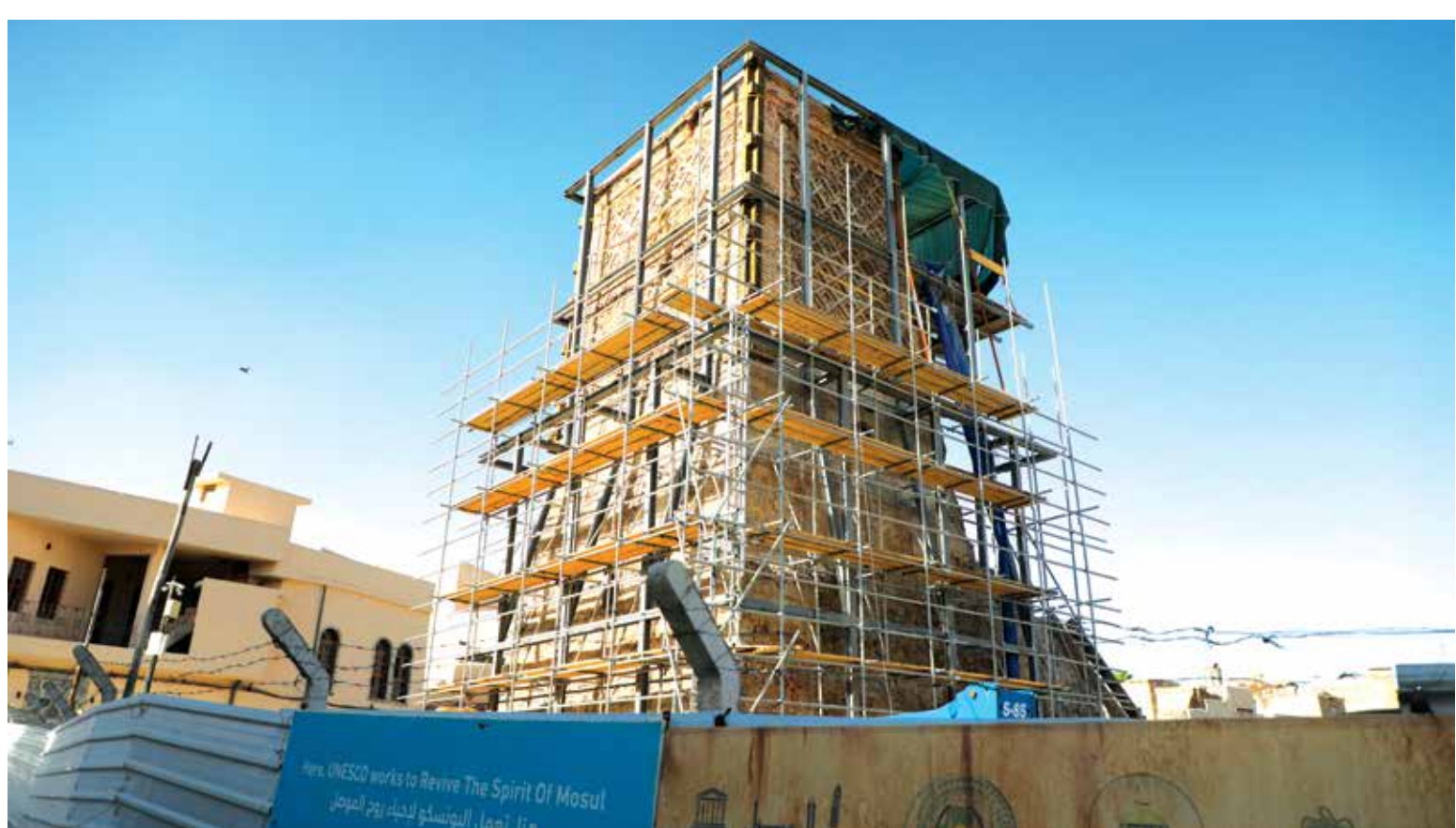
غابة الصقالات المحيطة بما تبقى من مئذنة جامع النوري في الموصل تؤثر تواصل حركة الاعمار في المدينة