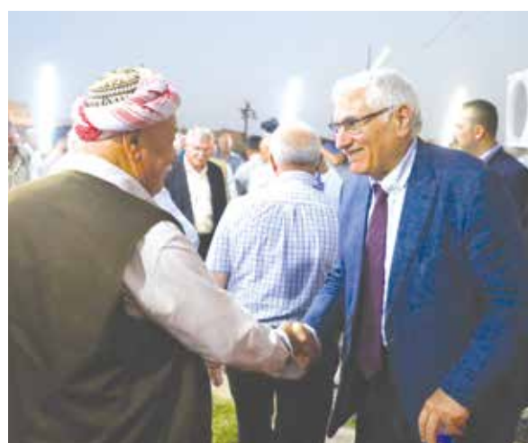
لقاء حار مع مجموعة من المواطنين في ألقوش