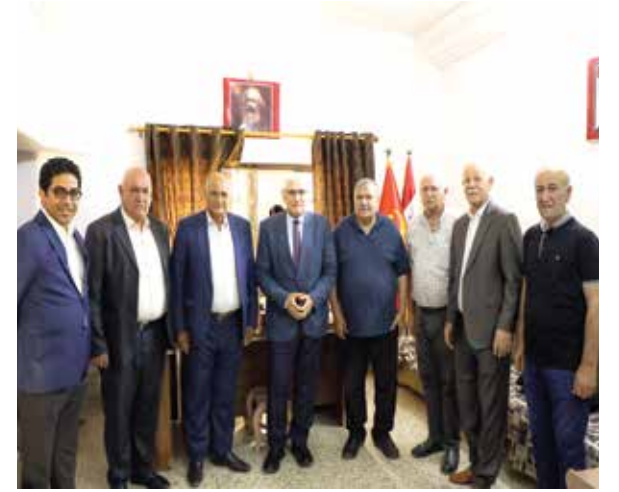
سكرتير الحزب مع اعضاء محلية نينوى