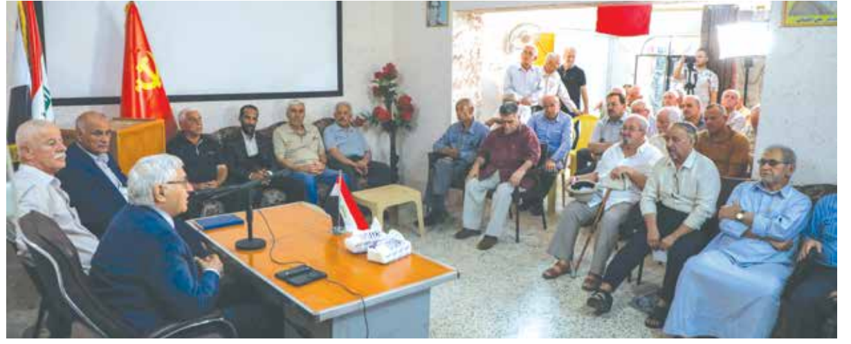
لقاء مع البعديين عن الحزب في مقره بالموصل