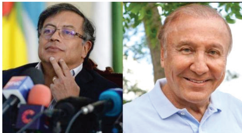
هل سيحكم اليسار في كولومبيا للمرة الأولى؟

الاحراج الذي سواجاه ناخبي ماركون في الدوائر التي يجب عليهم الاختيار بين مرشحي اليسار ومرشحي اليمين المتطرف. ماركون نصح ناخبيه بالامتناع عن التصويت، لكن هذا يعرض 15 وزيرا في حكومته إلى الاستقالة في حال خسارة دوائره. كانت نتائج الدورة الأولى في منطقة باريس بمثابة صدمة للرئيس حيث تقدم اليسار في 12 دائرة من أصل 18، ونجح ثلاثة مرشحين يساريين من حسم السباق الانتخابي من الدورة الأولى بصمولهم على أكثر من 50 في المائة من أصوات الناخبين.