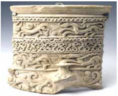
جرة عباسية، القرن الثاني عشر الميلادي، محفوظة في متحف الفن الإسلامي في برلين.

لو كان القرن الثاني عشر الميلادي هو قرن هذه الجرة، كما يُورخ لها المتحف، فإن التئين كان ثيمة بارزة في فن بغداد العباسي، وصلت عبر تأثيرات متشابهة: سلجوقية، هندية، آسيا الوسطى وصينية. وهي ثيمة ما زالت معلقة على أبواب منازل بغداد والموصل العتيقتين، وقد كتبنا ذات مرة عن أحد الأبواب البغدادية التي تحمل نحتاً بارزاً لهذا التئين.