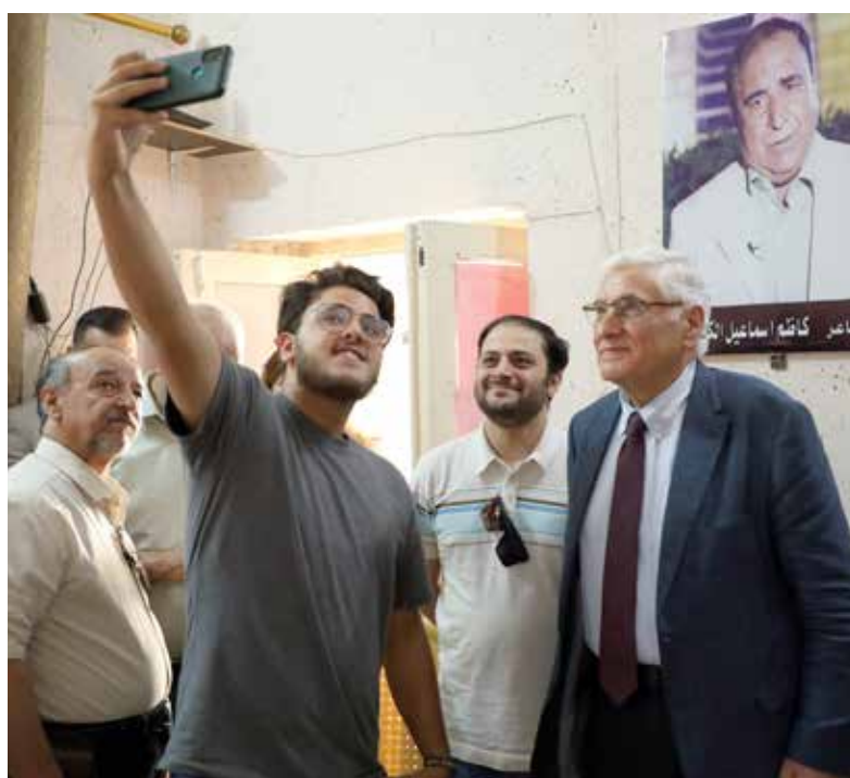
في مقر الحزب بالموصل