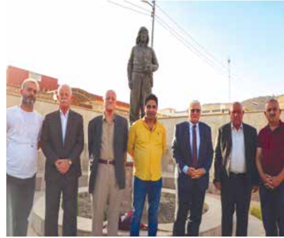
في منزله القائد الشيوعي توما توماس