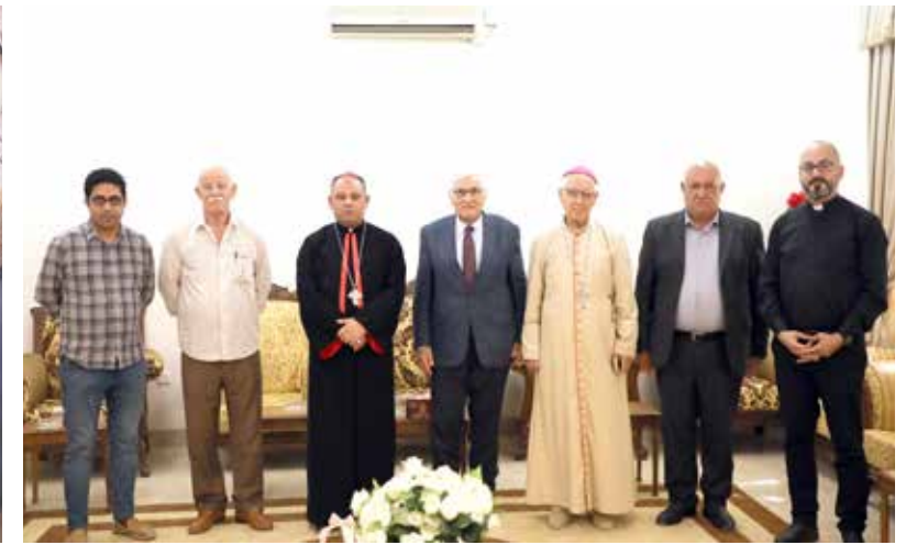
اثناء زيارة مطرانية ألقوش