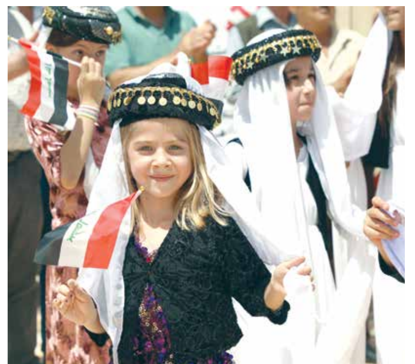
اثناء الاستقبال في بعشيقه