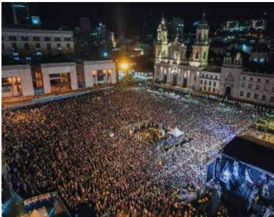
حضور استثنائي في التجمع الختامي لمرشح اليسار

بل يعيش الناشطون السياسيون الآخرون في خطر دائم أيضاً. لقد اغتيل أكثر من 50 ناشطاً خلال العام الحالي، وشمل ذلك النقابيين والسكان الأصليين والكولومبيين من أصل أفريقي. بينما تواصل الميليشيات اليمينية القتل بلا هوادة.