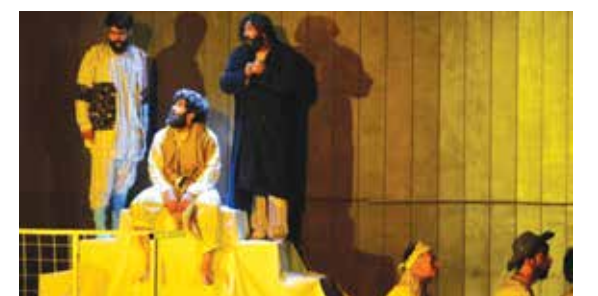
لقطة من مسرحية "شماعية" الفائزة بجائزة المهرجان