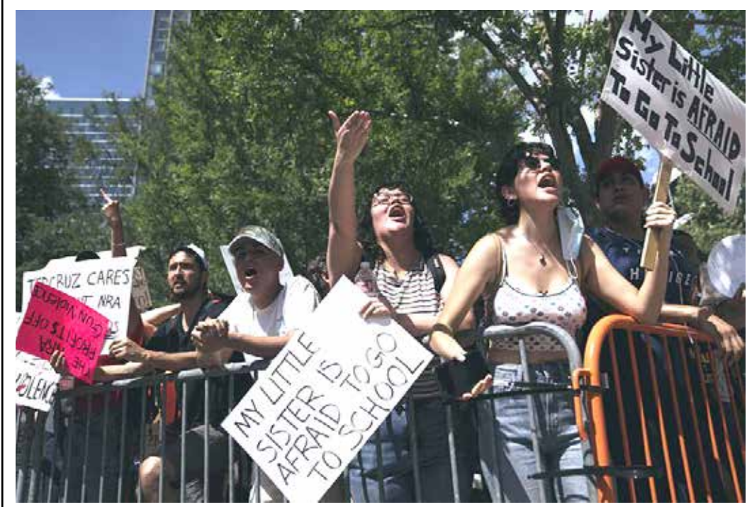
وكالات: تظاهرة رافضة لـ "معرض للأسلحة" في الولايات المتحدة في تكساس بعد ثلاثة أيام من "مجزرة البنادق" في المدرسة الابتدائية

وحتى الآن، أكثر من 200 إصابة بين مؤكدة ومشبهة بها حوالي 20 منها في مناطق لم يظهر فيها الفيروس من قبل. وأوضحت في إحاطة للدول الأعضاء في المنظمة، "نعتقد أننا إذا اتخذنا الإجراءات الصحيحة الآن يمكننا احتوائه بسهولة"، مؤكدة أن هناك فرصة سانحة لمنع الانتشار، وحثت عامة الناس على تجنب القلق لأن انتقال العدوى أبطأ بكثير من الفيروسات الأخرى مثل فيروس كورونا.