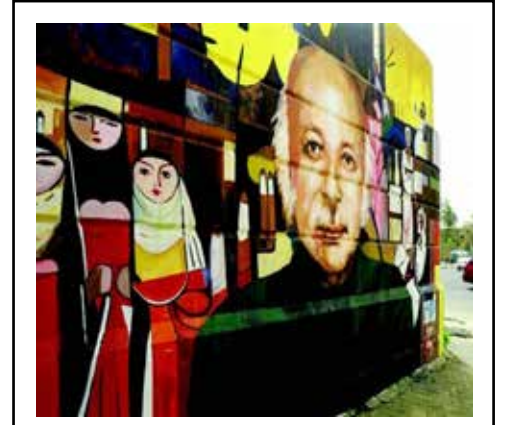
جدارية في الوزيرية للغائنة وجدان الماجد

* شبيء من قصيدة القاها النواب الراحل في امسية بلندن سنة 1995