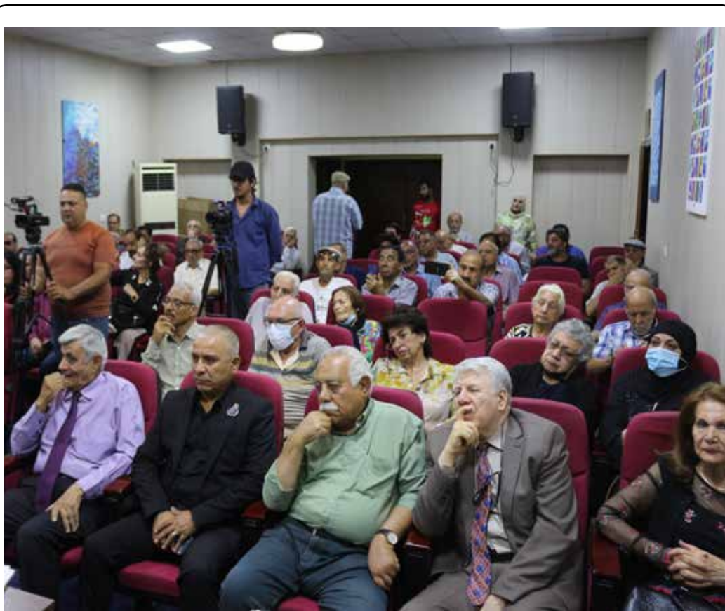
جانب من جلسة عقدت أمس الاربعاء تحت عنوان (مظفر النواب في ضمير الأدب ووجدان الشعب) نظمتها الاتحاد العام للأدباء والكتاب في العراق، وتحدثت فيها نخبة من الأدباء ومجاليي الشاعر وقارئ تجربته الشعرية والنضالية.