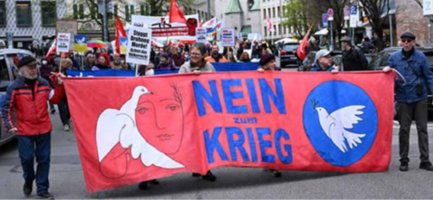
تظاهرة للسلام في ميونخ بمناسبة عيد الفصح

فعاليات كبيرة في المناسبات السنوية الثابتة لحركة السلام مثل ذكرى القصف النووي الأمريكي لهيروشيما وناغازاكي في 6 و 9 آب 1945. واليوم المضاد للحرب بمناسبة اندلاع الحرب العالمية الثانية في الأول من أيلول. وستدخل حركة السلام مع اتحاد نقابات العمال الفيدرالي الألماني في حوار في سبيل اعلان تحالف للعمل من اجل السلام، وذلك لان الأول من أيلول تحتفي به النقابات كيوم لمناهضة الحرب. وتُظهر المساهمات المتنوعة في مؤتمر العمل رغبة العديد من النشطاء في التأثير على المناخ الاجتماعي لصالح التعاون ونزع السلاح ودفع منطلق الحرب لصالح منطلق السلام.