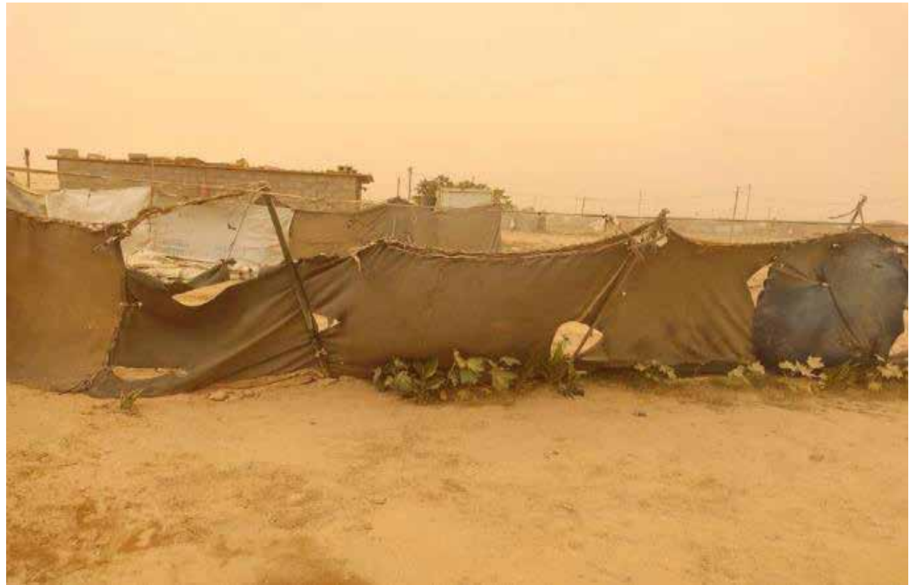
موجات الغبار تزيد من معاناة النازحين الإنسانية

من برنامج الحزب، الذي أقره المؤتمر الوطني الحادي عشر 2021