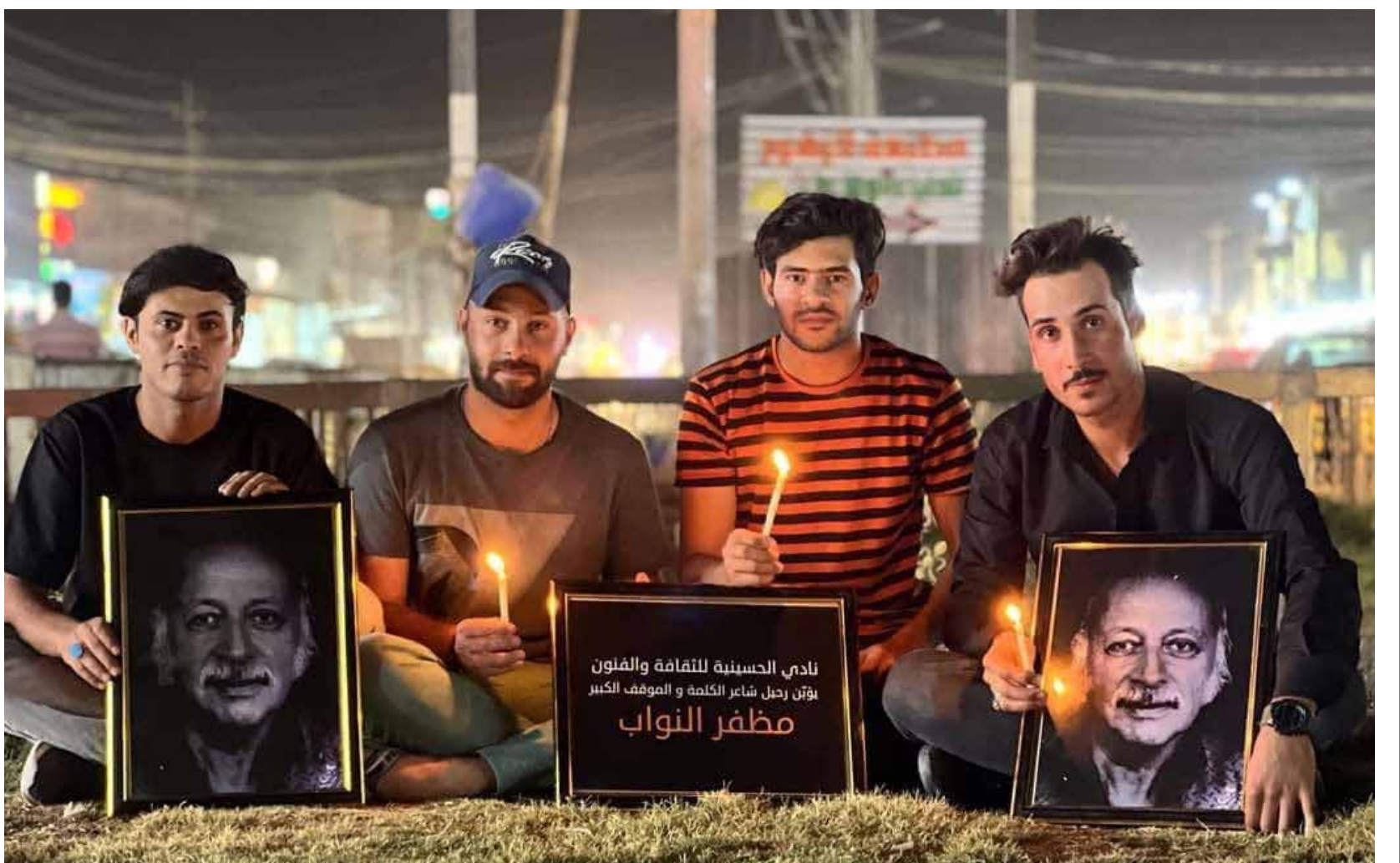
نادي الحسينية للثقافة والفنون في بغداد يؤنّن رحيل شاعر الكلمة والمواقف الكبيرة