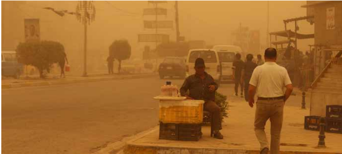
يستمر بالكبح مع العاصفة الترابية