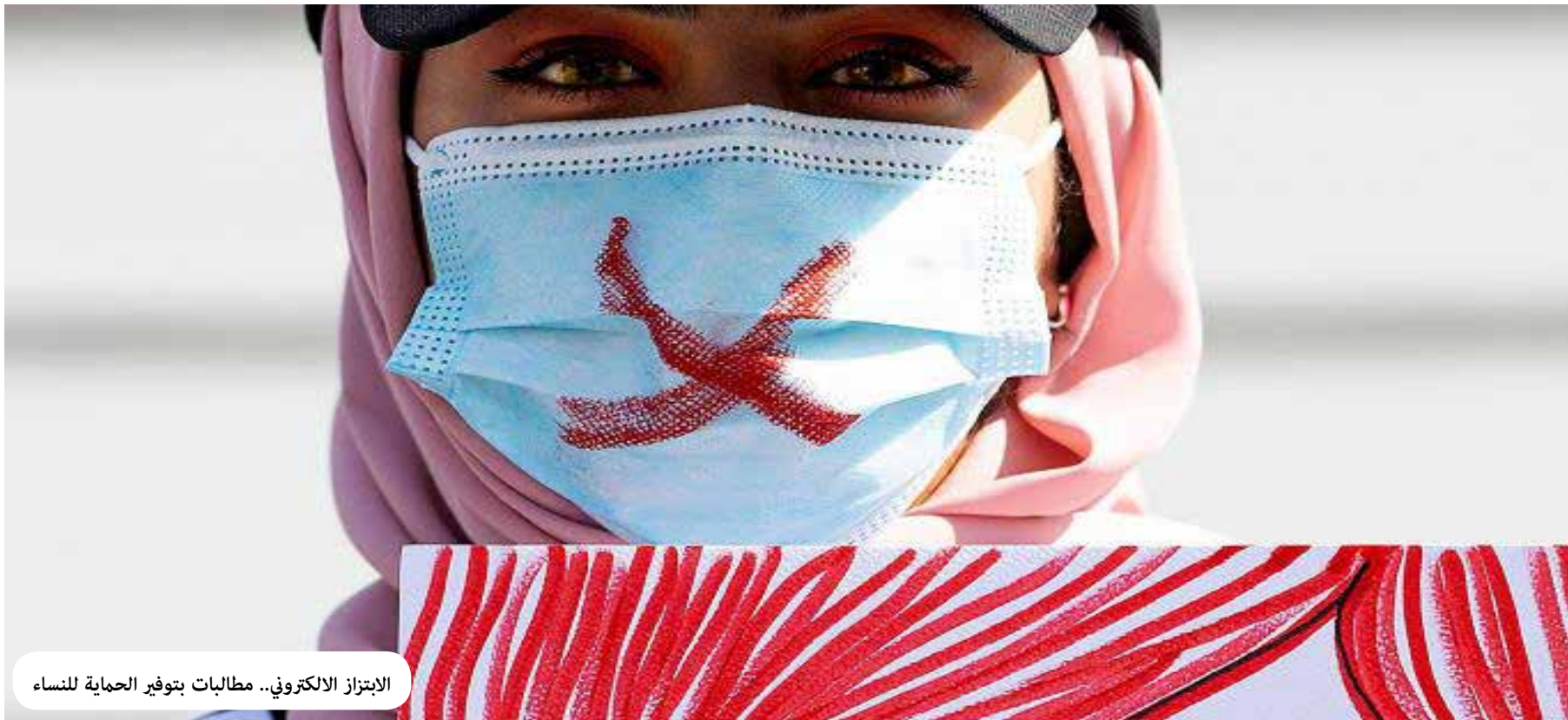
الابتزاز الإلكتروني.. مطالبات بتوفير الحماية للنساء

ورصدت "طريق الشعب"، منشوراً لأحد المحاميين على وسائل التواصل الاجتماعي، كشف فيه عن أن "أباً دفع برجل لإقامة علاقة مع طليقته، وذلك بسبب ذهاب حضانة الاطفال الى الام استناد الى احكام المادة 57 ف 1 من قانون الاحوال الشخصية. وكان هدفه التمهيد لإقامة دعوى اسقاط الحضانة عن الام امام محكمة الاحوال الشخصية. وبالفعل فقد شهد العشيقي مع الاب في المحكمة ضد الطليقة"، الا ان القاضي كان اكثر فطنة واستدرج العشيقي، واحاله مع الاب لقاضي التحقيق، لاتخاذ الاجراءات القانونية وفق المادة 395 عقوبات، بتهمه من واقع امرأة بوعد الزواج ورفض الزواج منها يعاقب بالحبس، وتم رد الدعوى.