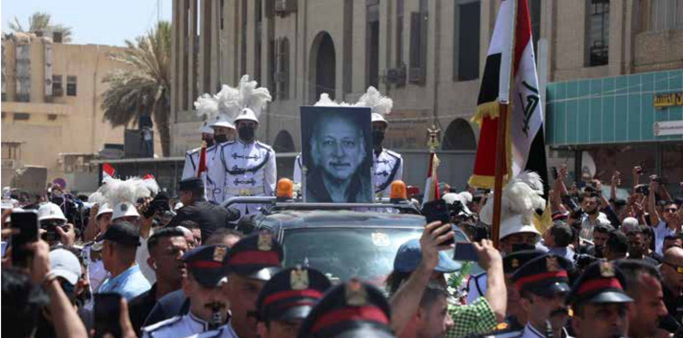
تشيع الشاعر الكبير مظفر النواب من مقر اتحاد الادباء طريق الشعب