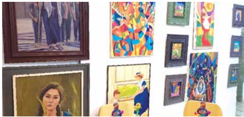
من اللوحات المعروضة

وقد تبنى عضو الجمعية من الحكومة المحلية دعم مقرهم والاهتمام بالفن التشكيلي والفن المشرق بأسلوب المدرسة الانطباعية. وأضافت قائلة عن لوحاتها "أنها تمثل تجريبي في الفن التشكيلي التي امتدت إلى أكثر من عقد من الزمن"، داعية الجهات المسؤولة إلى الاهتمام بهذا الحقل الفني، وإيجاد قاعات مناسبة لاحتضان فعالياته.