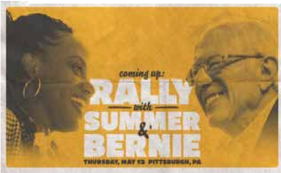
ملصق انتخابي: سمر لي وبييري ساندرز

وتتركز حملة الإعلانات الداعمة للجناح اليميني، والموجهة ضد الجناح اليساري على اتهامات مثل عدم فعالية النواب التقدميين في نشاط السلطة التشريعية، وهم ليسوا ديمقراطيين حقيقيين، ولا يوالون الرئيس بايدن. وفي لقاء تلفزيوني أعلنت سمر لي: "نحن كديمقراطيين علينا أن نقرر ما إذا كنا نريد أن نكون حزب رجال الأعمال أو حزبا لطبقة العاملة".