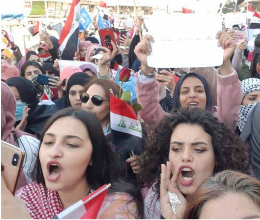
طالبات جامعيات في انتفاضة تشرين