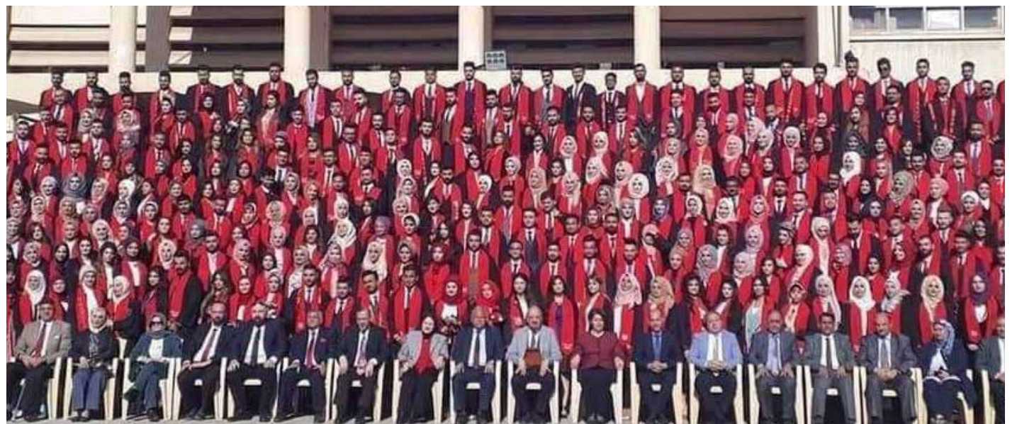
كلية الطب جامعة بغداد

ويضيف، أن "الفكرة الاساسية للتخرج هو الاستفادة من المسيرة الدراسية بعد الانتهاء من الامتحانات وحصولهم على درجة اكايدمية وعلمية لتكون الفرحة أكبر".