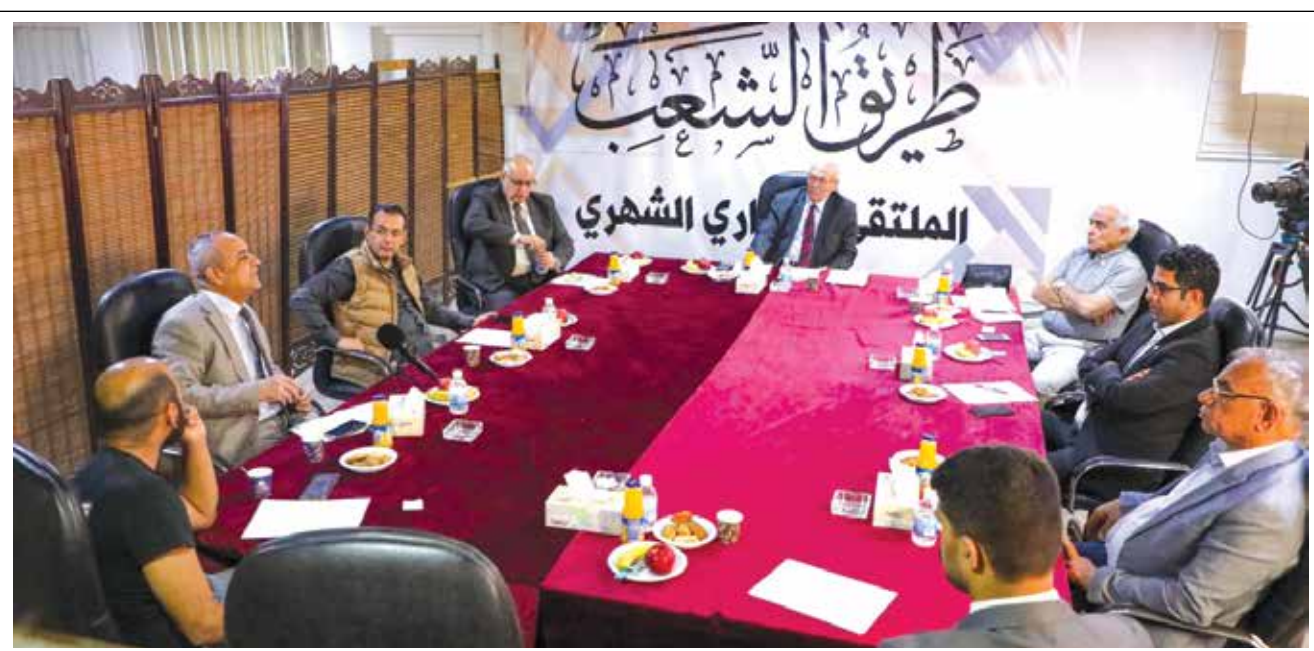
في الفعالية الاولى للملتقى الحواري الشهري لـ"طريق الشعب" المنعقدة يوم امس الاول (12 نيسان 2022). التفاصيل في العدد القادم

مقاعدها النيابية في الجلسة الأولى لمجلس النواب أكثر عدداً من الكتلة أو الكتل الأخرى".