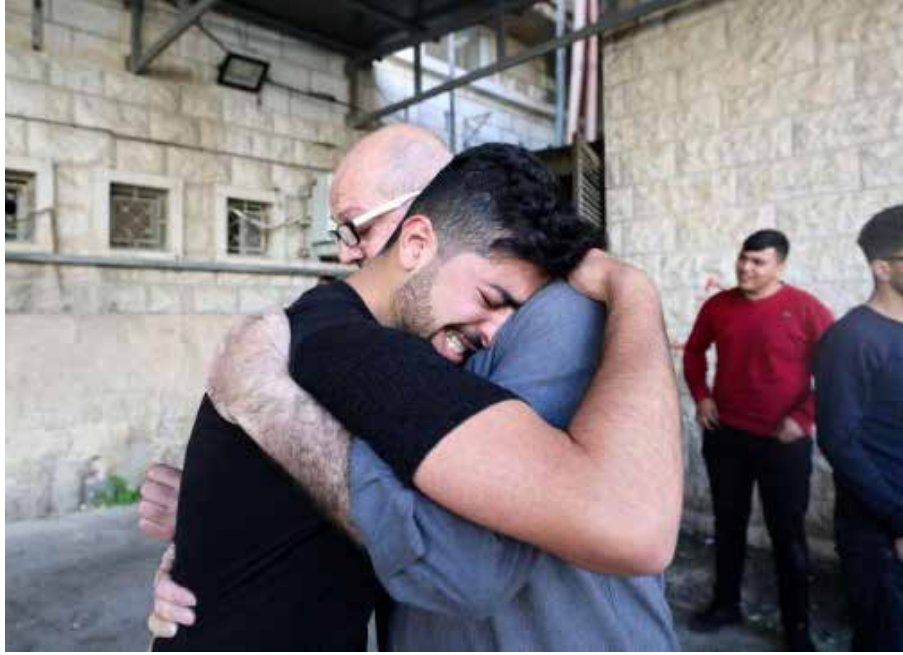
فلسطينيون يبكون إثر مقتل صديقهم برصاص قوات إسرائيلية في مدينة نابلس في 13 نيسان 2022

وأقدمت قوات الاحتلال يوم أمس، على قتل محام فلسطيني في مدينة نابلس في شمال الضفة الغربية المحتلة على ما أفادت به وزارة الصحة الفلسطينية. وأفاد مدير الاسعاف والطوارئ في الهلال الأحمر في نابلس أحمد جبريل، بأن خمسة مواطنين أصيبوا بالرصاص الحي، وخمسة بـ"المطاط"، ومواطن بحروق جراء إصابته بقتلة غاز، إضافة إلى إصابة شاب برضوض بعد أن دعتسه دورية احتلالية،