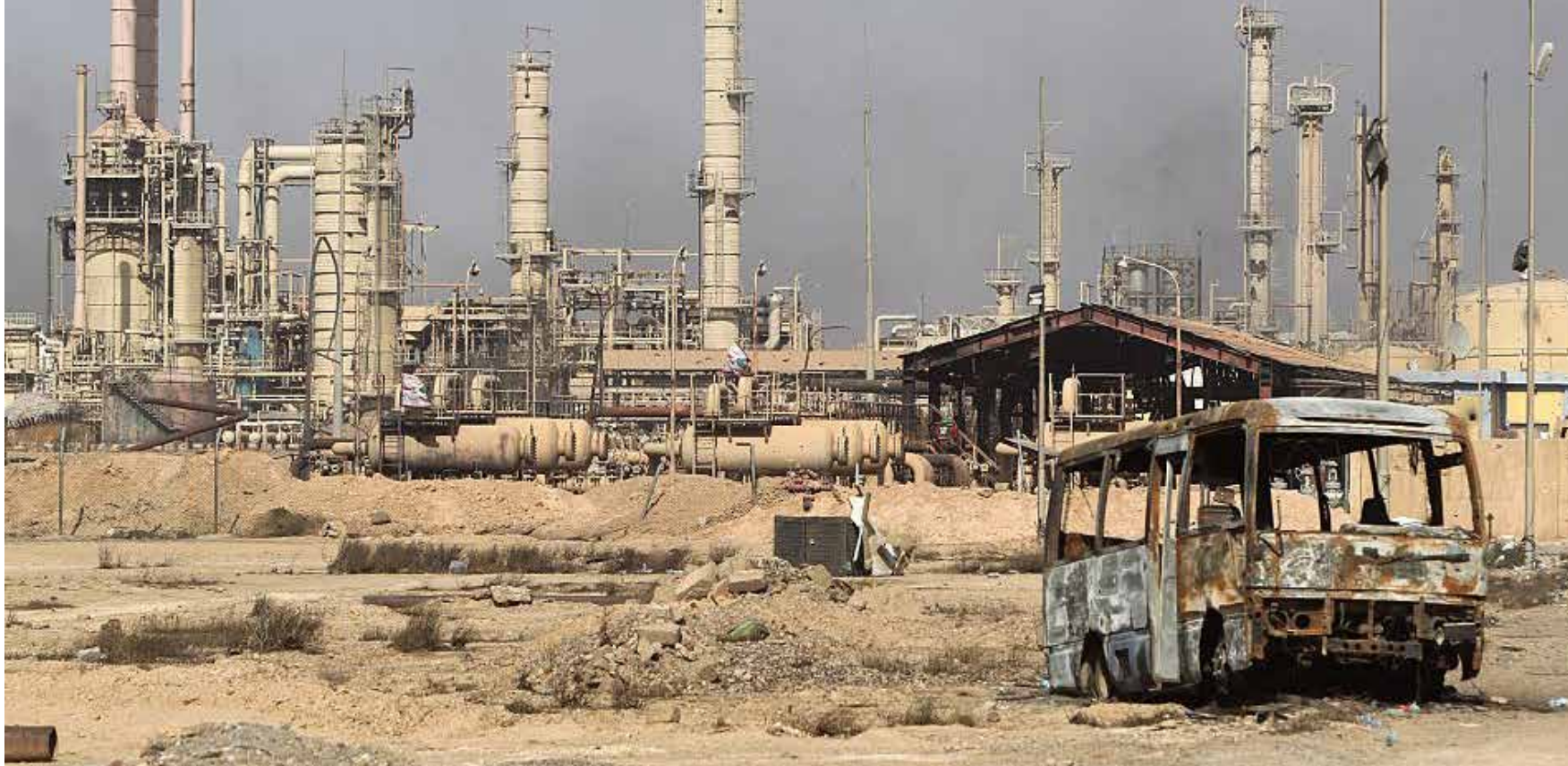
مصطفى يبيجي غداة عمليات تحرير المدينة من تنظيم داعش الارهابي

عراقي، إلا أن الوثائق تثبت وضع المشروع في قائمة المحافظة بقيمة 25 مليار دينار عراقي، ومن ثم تم إبرام العقد بزيادة أكثر من 3 مليارات، وهي مبالغ مرصودة لمشروع لم ينفذ بعد. وتؤكد المصادر أنه "تم إقرار مشروع إنشاء مركز للسرطان في صلاح الدين منذ حوالي سنة ونصف السنة، ولكن تحول المشروع إلى قسم داخل مستشفى تكريت التعليمي الذي قامت بإنشائه إحدى المنظمات الدولية أساساً، في وقت ساهمت المحافظة في جزء بسيط فقط من التجهيزات".