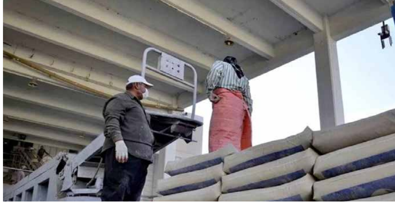
مئات العوائل مهددة بالفقر نتيجة لقرارات حكومية خاطئة

وعودا على النفط الأسود، فقد بررت الوزارة قرارها بـ"متغيرات التسعيرة في سوق النفط العالمية" ما دفعها الى المعادلة بين الداخل والخارج للحد من عمليات التهريب. لكن مختصين وصفوا اجراءات الوزارة بأنها