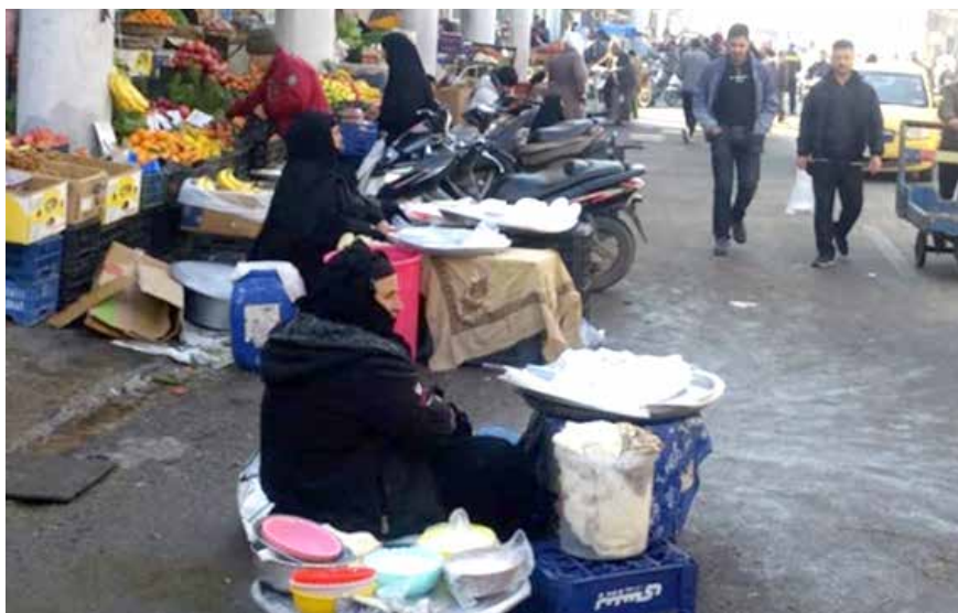
في "سوق الصدرية" ببغداد