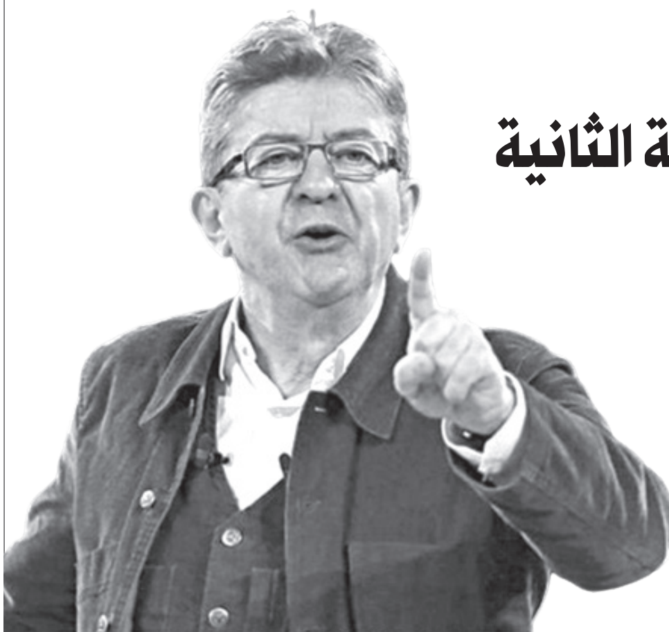
جولة الانتخابات الأولى: فرصة ميلنشون الضائعة

وكان أكبر الخاسرين في هذه الانتخابات مرشحة اليمين التقليدي فاليري بيكريس، والتي حصلت على 4.7 بالمائة فقط، في تراجع كبير لحزب يتصدر الساحة السياسية في البلاد، والشئ نفسه ينطبق على الحزب الاشتراكي الذي يعيش منذ سنوات حالة من التشرذم والتراجع، جعلته يحصل على 1.74 بالمائة فقط.