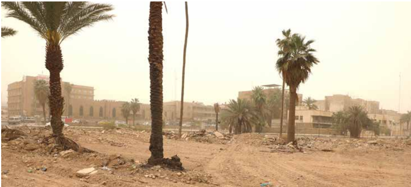
مواطنون: متنفذون يقطفون الاشجار في بارك السعدون للاستحواذ على الارض واستثمارها

ويقول ان "نجاح هذه الفكرة يضمن دخلا ماليا كبيرا يغطي تكاليف الإنتاج"، مشيراً الى ان "الغابة من ذلك تعود إلى أن اقتصاد الغابات يعتبر من القطاعات الاقتصادية المهمة، وتنعش مبدأ غرز القناعة بدور الغابات وعطائها المادي، وهي تربط عناصر الإنتاج من أرض وأشجار وعامل ورأسمال في قالب اقتصادي وطني واحد". ويهزن عبد القادر نجاح هذه المشاريع البيئية بتوفير "للأشجار الملائمة لنوعية التربة وكميات المياه المتاحة في حالة الشروع في هذه الخطوات وزيادة حجم الاستثمار في إنشاء الغابات، ويمكن الاستفادة من قانون الاستثمار رقم 13 لسنة 2006 وكذلك محاولة زيادة نسبة مساحة الغابات في العراق من 4 في المائة إلى 6 في المائة من خلال وضع مقاييس حقيقية للكفاءة الاقتصادية ما بين حجم الإنتاج للأخشاب وبين الموارد الإنتاجية الأخرى".