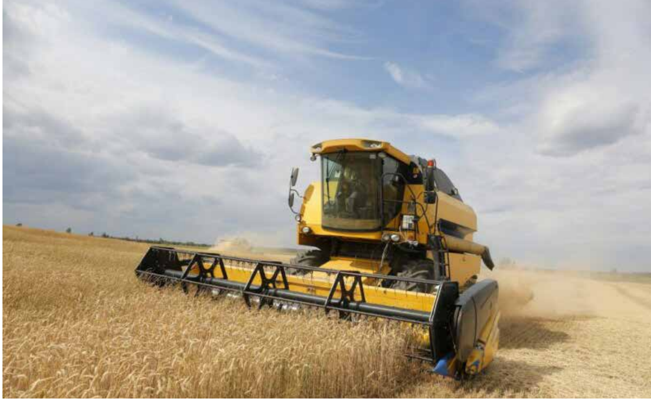
مخاوف عالمية من ارتفاع اسعار الحنطة

صدمة اقتصادية على الطريق واستمرار ذلك يسبب مشكلات ليس لأوكرانيا فحسب، بل على الإمدادات العالمية وسلاسل التوريد ويرفع أسعار الغذاء عالمياً.