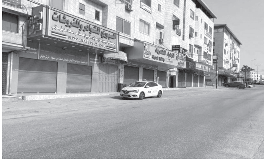
إضراب شامل في بيت لحم