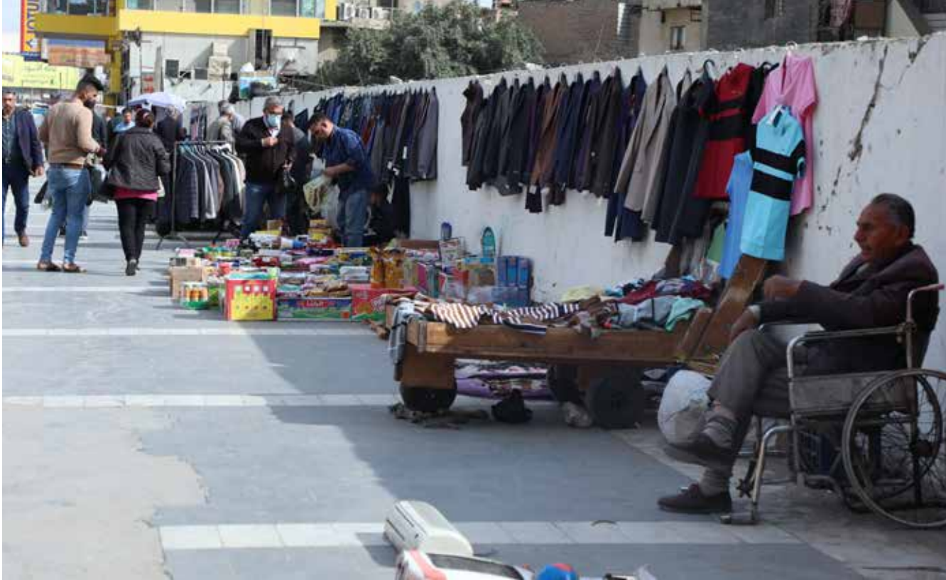
عمال القطاع الخاص غير مؤمنين.. ماذا عن اصحاب الجنازير والباعة الجوالين ؟ طريق الشعب