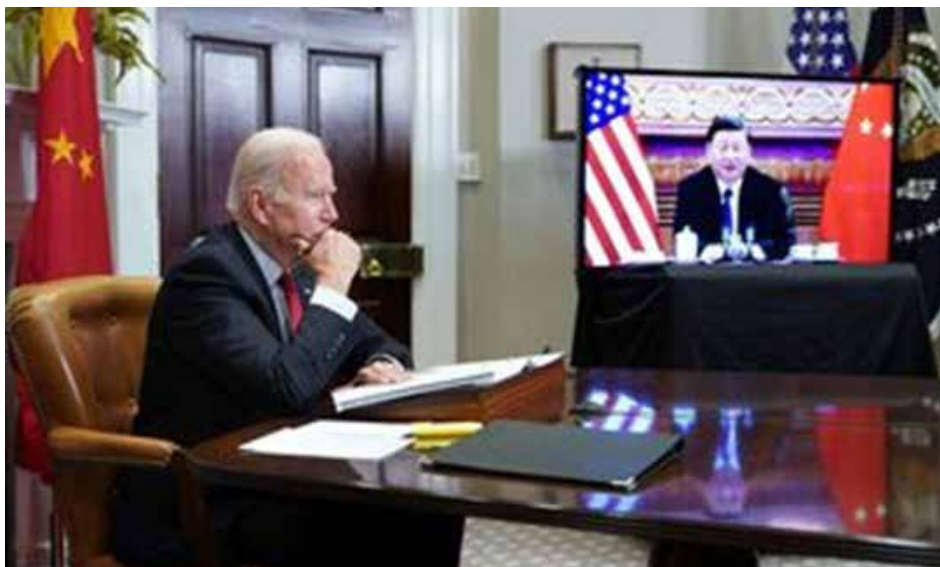
حوار مباشر بين الرئيسين الصيني والأمريكي بشأن الحرب في أوكرانيا

القوتين العظميين. وأكد الحوار المباشر الأول بين رئيسي الدولتين منذ الغزو الروسي لأوكرانيا، حقيقة الصعود الجيوسياسي للصين خلال الحرب في أوكرانيا، فلم يسبق أن احتاجت واشنطن بهذه السعة لدور الصين لحل نزاع من هذا النوع.