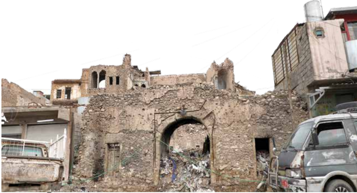
مدينة الموصل بانتظار الاعمار

وتشير نجيب إلى أن "المؤتمر كان مهماً، ولكن