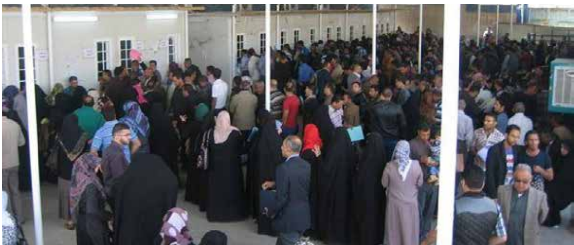
اعداد الموظفين في تناسب عكسي مع المنجز

وأضاف ان «مركز التطوير الإداري أحد المراكز المتخصصة على مستوى الاستشارات الوظيفية وتطوير قدرات العاملين تكفل باستراتيجية مهمة وهي استراتيجية الإصلاح في الدوائر الحكومية». ولكنه أكد أن «هذا الموضوع أكبر من أن تتكفل به وزارة التخطيط وحدها بل بحاجة إلى جهود كبيرة وتشريعات وقوانين»، مضيفاً أنه «نتيجة للمشاكل الاقتصادية تكونت فجوة