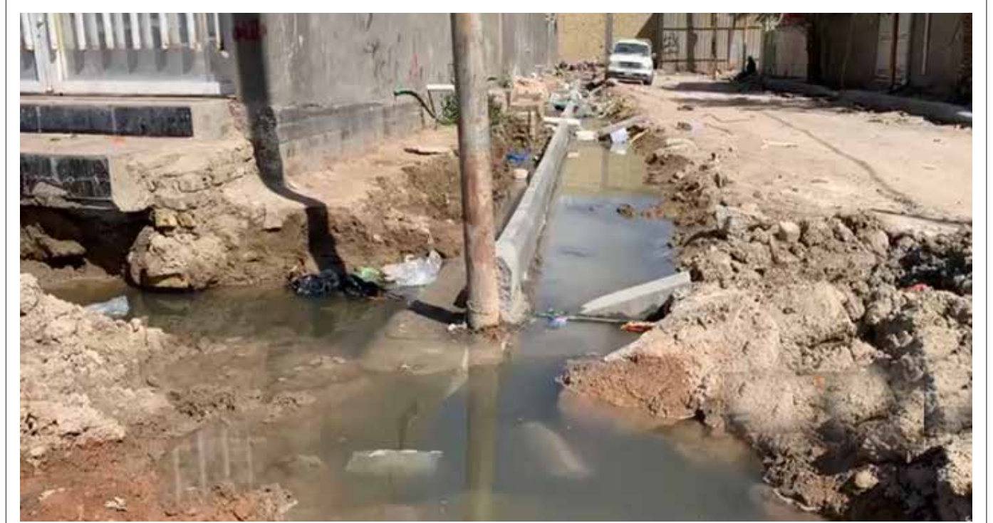
عندما يتلأأ تنفيذ المشاريع الخدمية! هذا ما يحصل في بعض أحياء مدينة السماوة