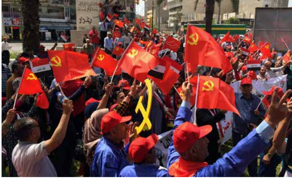
من مسيرات الال من أيار في بغداد