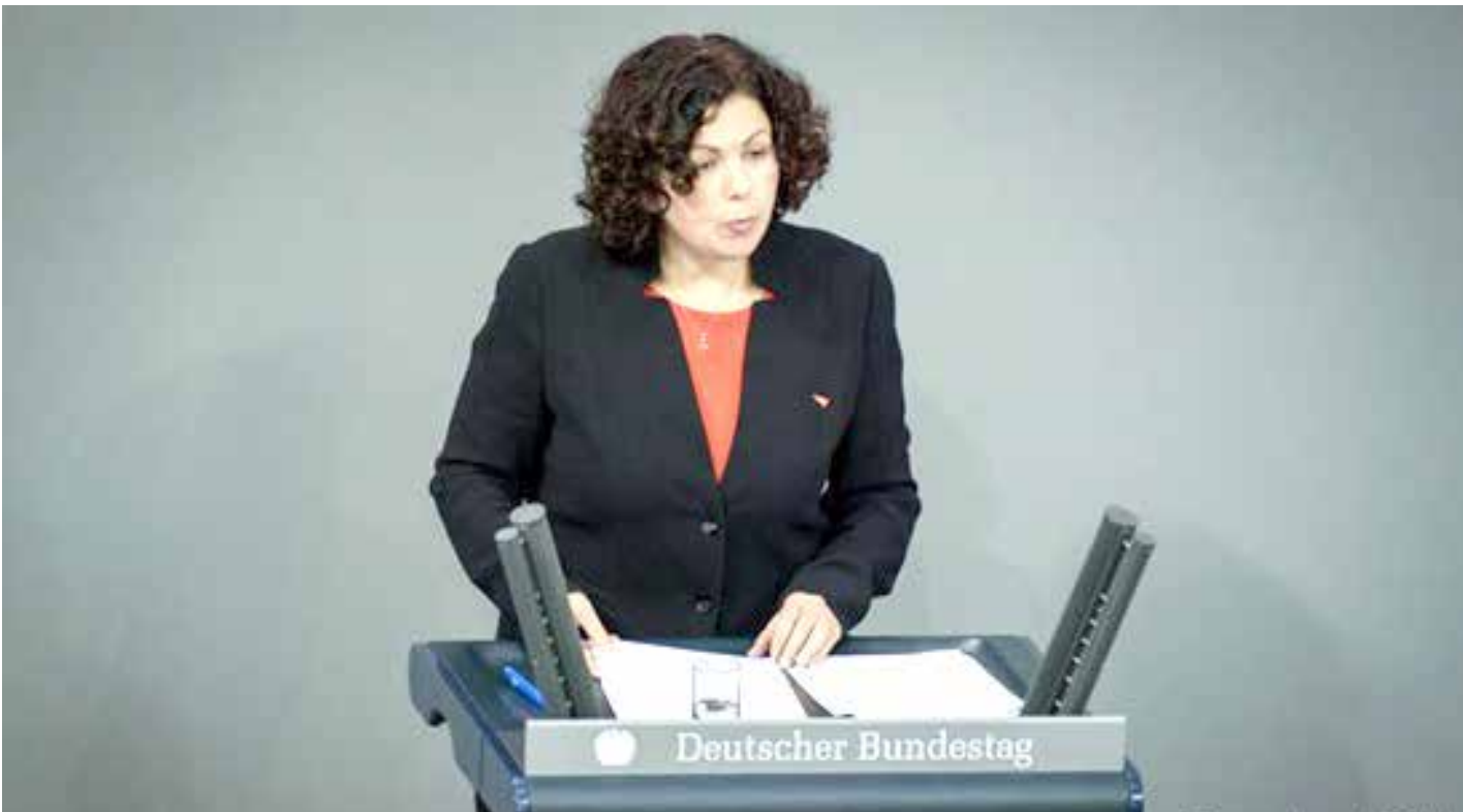
أميرة محمد الرئيسية المشاركة لكتلة حزب اليسار الالمانى

وأعلن وزير المالية الفيدرالي كريستيان ليندнер من الحزب الليبرالي الحر أنه مستعد لتحمل ديون جديدة من أجل تمويل إعادة تسليح الجيش الألماني. وقال ليندнер إن النقاش حول تعزيز القدرة العسكرية يجب ألا يجري، تحت طائلة "تحذير من ديون جديدة". وإن 100 مليار يورو المخصصة لدعم الجيش هي "في هذا الوضع العالمي استثمارات مبدئية في حريتنا". ويجب من الآن، أن ينتهي إهمال الجيش الألماني.