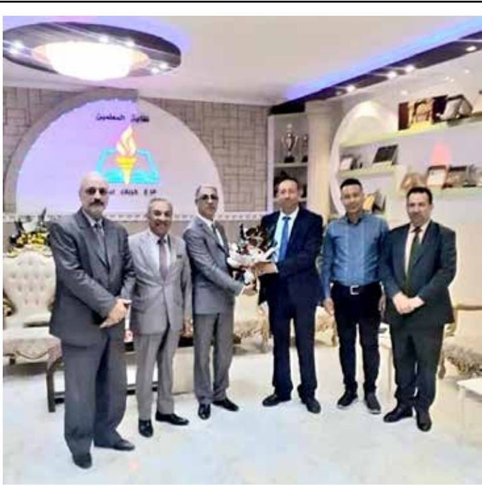
زيارة وفد من اللجنة المحلية للحزب الشيوعي في كربلاء مقر نقابة المعلمين في المحافظة وتقديم باقة ورد في المناسبة.