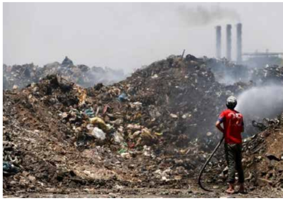
العشب في البيئة مستمر

وشدد المسؤول في حديثه على "ضرورة تقويم عمل المؤسسات الحكومية المهتمة بشؤون البيئة وبالاعتماد على المعايير المهنية والكفاءة الإنتاجية والجودة، ودراسة القوانين المتعلقة بالبيئة، مع تحديد نسب ومصادر تلوث الماء والهواء والتربة، وزيادة الوعي المجتمعي والترويج شعبياً لأهميته"، مؤكداً "ضرورة تشديد الرقابة على مصادر التلوث المائي الهوائي وتطبيق القوانين بحزم لوقف ومنع هذه الملوثات".