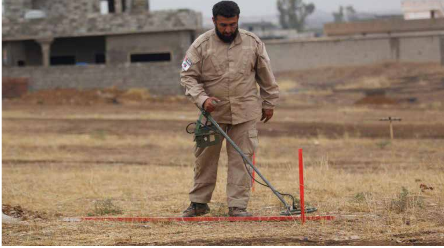
البحث عن الالغام لا يتوقف

وبحسب التقرير "شاركت الفتاة والديها في غرف صغيرة جداً برقعة ثلاثة أشقاء بالغين وجدتهم العزوف كان هذا مأوهم طيلة ثماني سنوات. وأن العائلة لا تشعر به كمنزلهم الذي تركوه خلفهم مجبرين. وعلى