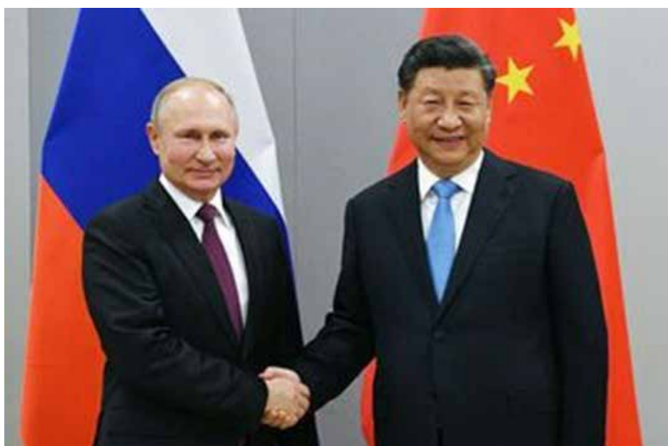
روسيا والصين.. تعاون ورؤى مختلفة

ورد وزير الخارجية الصيني وانغ يي "نحن نواجه نظاماً عالمياً متغيراً، محذراً من عودة "عقلية الحرب الباردة" وأن العقوبات الأحادية تقوض القانون الدولي. وقال: "لقد ولت الحرب الباردة منذ زمن طويل" والناتو "نتاج الحرب الباردة"، مضيقاً أنه "لا ينبغي لأي دولة أن تحاول إعادة عجلة التاريخ إلى الوراء". وتعمل الصين على "نوع جديد من التعاون الدولي" يقوم على أساس الأمن المشترك والشامل واحترام "قواعد عدم التدخل". وعبر الوزير الصيني عن امه، في أن يكتسب الاتحاد الأوروبي "قدراً أكبر من