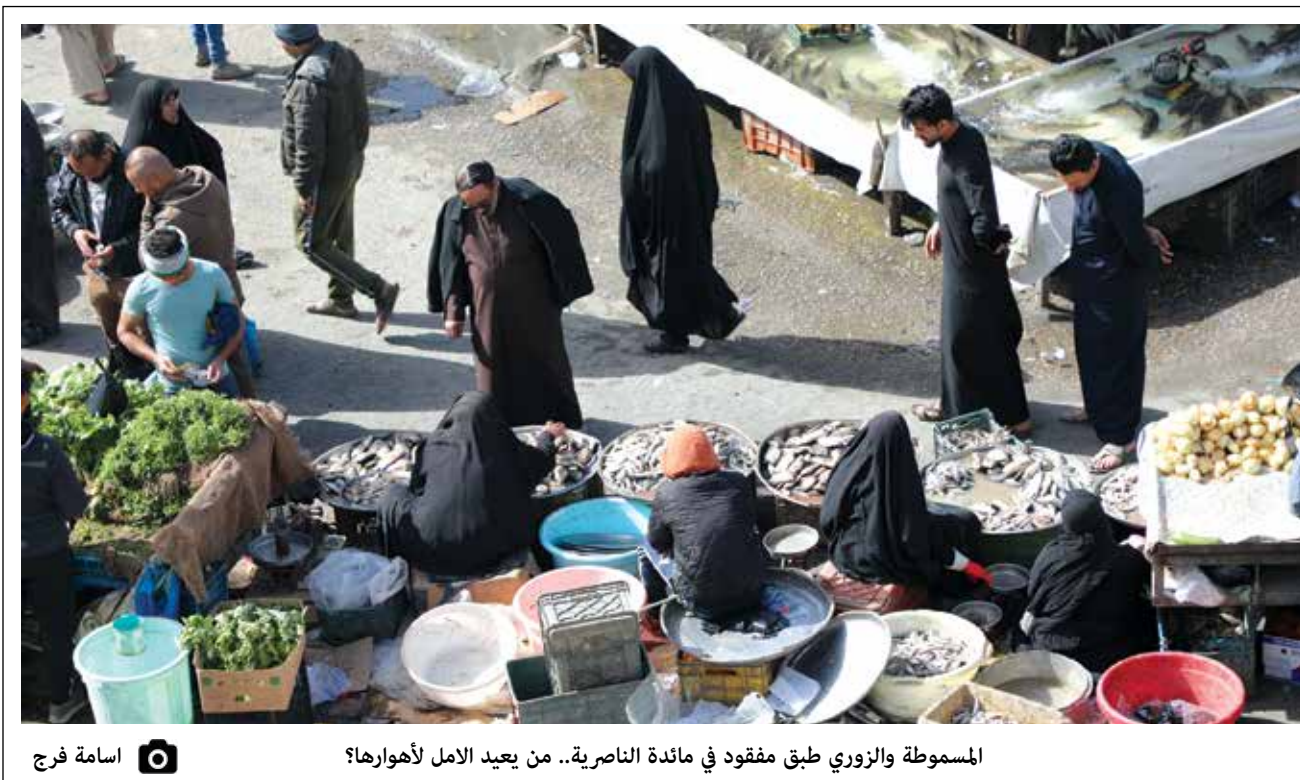
المسموطة والزوري طبق مفقود في مائدة الناصرية.. من يعيد الامل لأهوارها؟