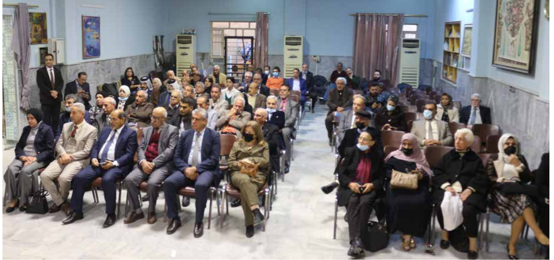
جانب من مؤتمر تسيقية الرصافة