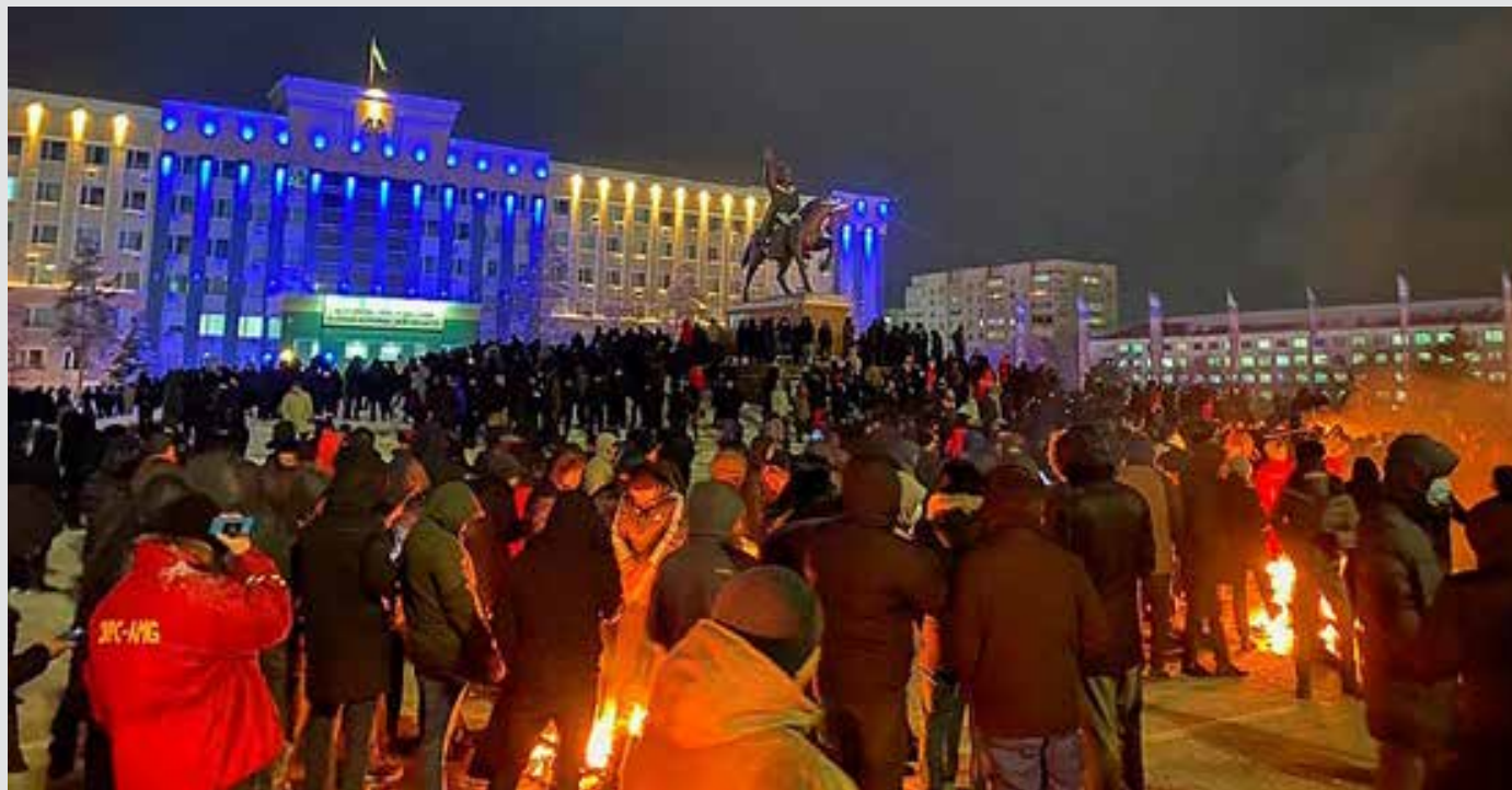
جانب من الاحتجاجات

تشارك احتجاجات كازاخستان مع موجة الاحتجاجات التي عمت العديد من بلدان العالم في عام 2019، بانها أفقية وتفتقر للهرمية وكرامات قيادية. ويرجع خبراء بشؤون البلاد هذه المشكلة الأساسية إلى طبيعة النظام الاستبدادي الذي لا يسمح لمن له خبرة في المعارضة بالنمو، فضلاً عن التهم الجاهزة بالارتباط بالخارج، أو وصم المتظاهرين بالإرهاب.