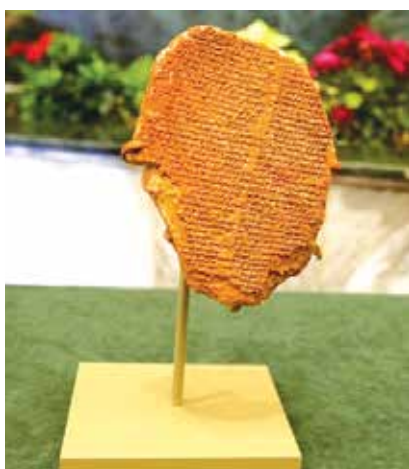
"لوح جلامش" الذي أعادته الولايات المتحدة الأمريكية للعراق الشهر الماضي

مع هذه المشكلة، إلا أن الناشطين أعادوا تذكيرها بأن جزءاً غير بسيط مما استردته العراق من الولايات المتحدة، يتمثل في قطع أثرية تم تهريبها عبر لندن دون أن تطاولها رقابة صارمة.