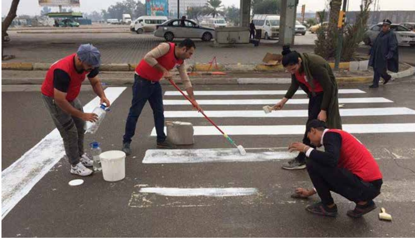
متطوعون يخططون شارعاً في بغداد