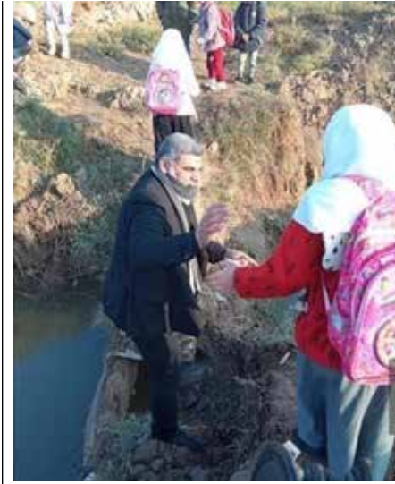
معلم يساعد التلميذ على عبور قنطرة منهارة

كشفت الخبر البيئي في محافظة السماوة، عن تعرض بادية المحافظة إلى ما أطلق عليه ”إرهاب بيئي“، وذلك بعد أن أقدمت مجموعات بشرية على قطع شجيرات ”الرمث“ البرية. ويعتبر نبات ”الرمث“ من أفضل نباتات المراعي في المنطقة الصحراوية، ومن أهم النباتات التي تصلح لمكافحة التصحر، كما انه يدخل في صناعات طبية. ولت حمدان في حديث صحفي، إلى ان ”عصابات تمثل متاجرين ونفعيين