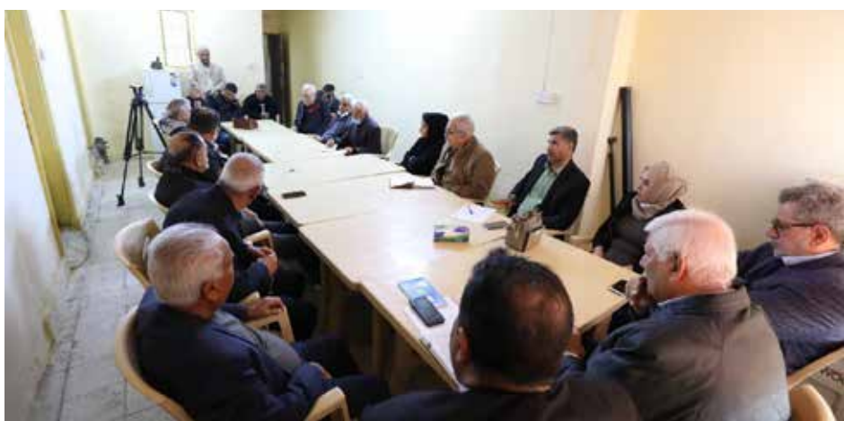
المركز الاعلامي للحزب الشيوعي العراقي

اقام الاتحاد العام لنقابات عمال العراق، أمس الاول السبت، ندوة موسعة لممثلي شركات وزارة الصناعة والمعادن الذين تعرضوا لعقوبات من قبل الادارات، كونهم يطالبون بحقوق العاملين في الشركات التابعة للوزارة. وشدد المجتمعون على رفضهم المطلق لهذه الاجراءات التعسفية بحق العاملين والاصرار على موقفهم بحماية الاقتصاد والصناعة الوطنية، وما يتبذر على الصفة الربعية للاقتصاد العراقي وانخفاض معدلات النمو الاقتصادي، وانتشار الفقر والبطالة وانعدام العدالة الاجتماعية في توزيع الدخل والموارد.