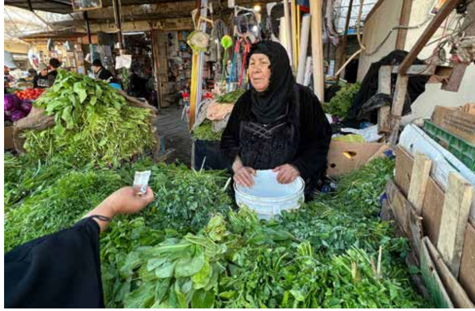
الامهات في سوق العمل غير المنتظم.. متى يحظين بعيش كريم؟ طرق الشعب

مع ازدياد حالات العنف ضد المرأة، يواصل جميع المعنيين بحقوقها، والناشطون في الدفاع عنها، تأكيدهم ودعواتهم للإسراع في تشريع قوانين تحمي النساء من التعنيف وتوفر إجراءات عقابية رادعة ضد منتهكي هذه الحقوق ومرتكبي الاعتداءات الصارخة على النساء، لاسيما مع ازدياد هذه الجرائم والمواجهة الخجولة وغير المجدية من قبل السلطات المعنية لها. ويبدو إن العنف ضد المرأة في مجتمعنا، لم يعد مقتصرًا على الإيذاء الجسدي، كما هو شائع، بل راح يشمل التحرش والابتزاز والازدراء والتمييز على أساس الجندر والإساءات اللفظية وإرغام القاصرات على الزواج وإرتكاب جرائم الاغتصاب وغسل العار وغيرها من مصائب إجتماعية تزداد صعوبة وتستفحل كل يوم، في وقت يقف القانون وأصحابه في موقف ضعيف أمامها، مما جعلها تصل الى مستويات خطيرة، تؤكدتها الأرقام المبرعة، سواء المعلنة منها أو المستترة.